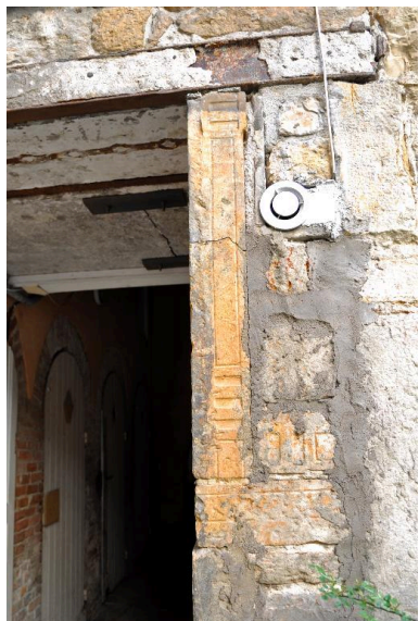
Détail du piédroit de la porte sur cour