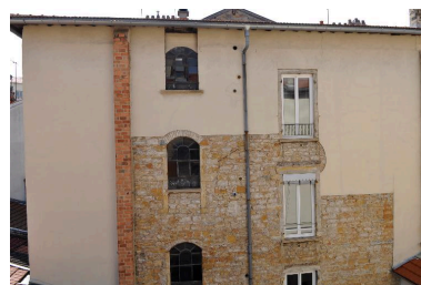
Elévation sur cour, vue partielle IVR84_20176901358NUCA