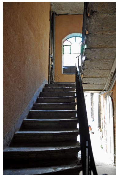
Vue intérieure : l'escalier IVR84_20176901361NUCA