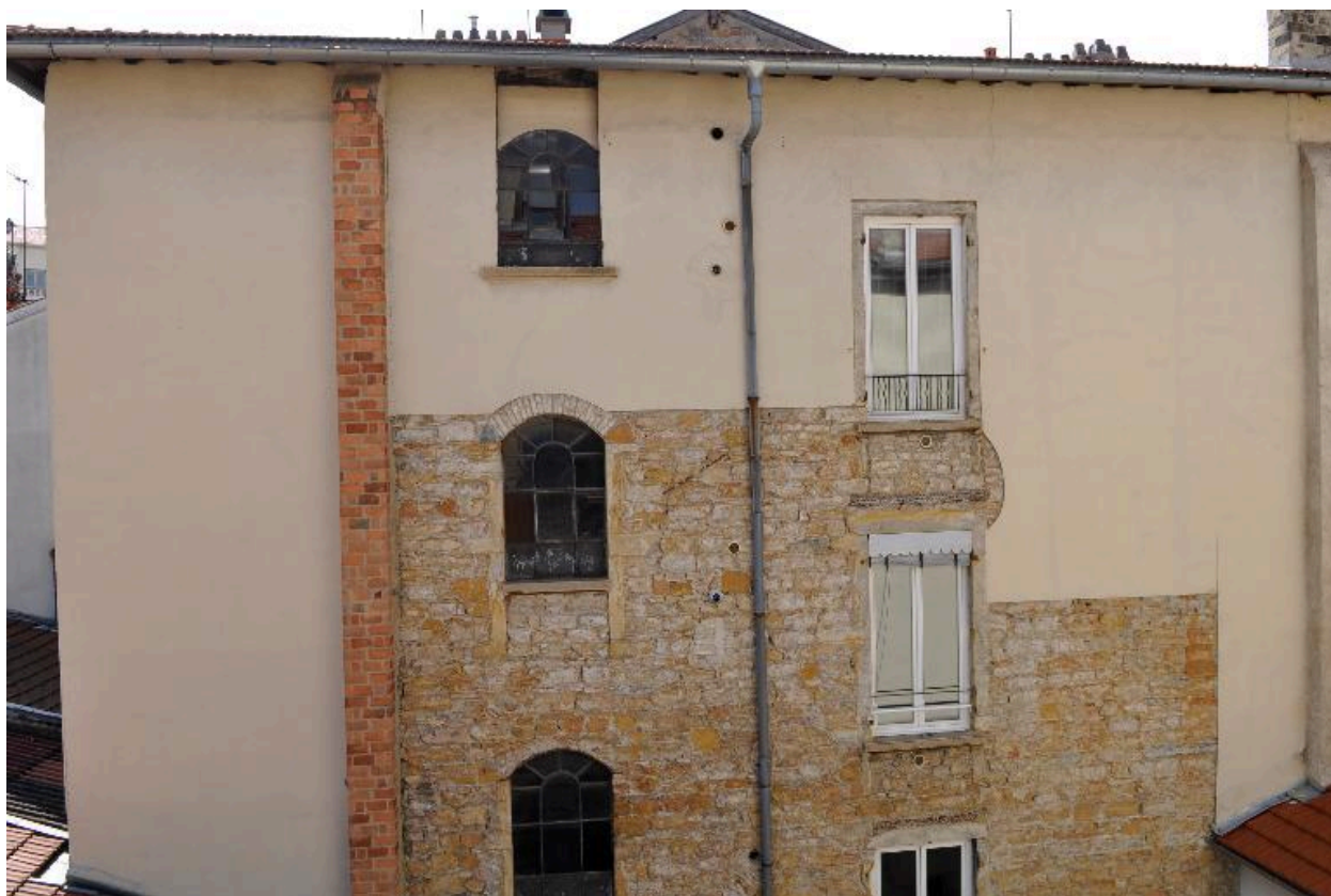
Elévation sur cour, vue partielle