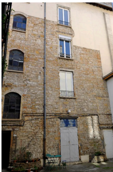
Elévation sur cour, moellons dorés apparents