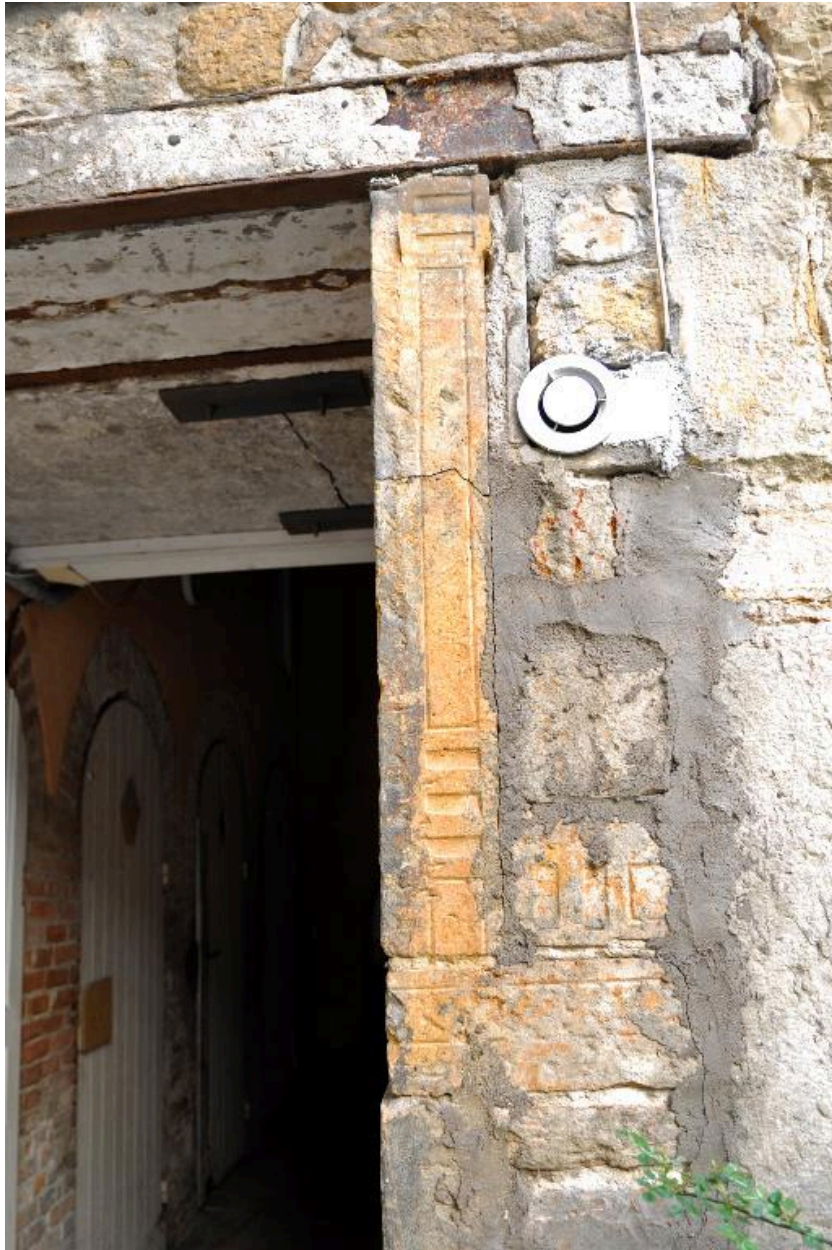
Détail du piédroit de la porte sur cour