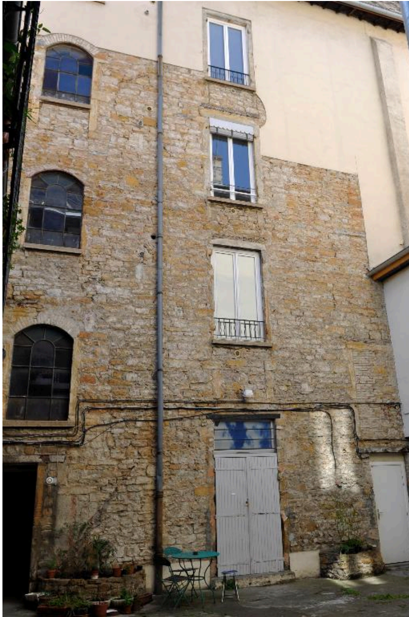
Elévation sur cour, moellons dorés apparents