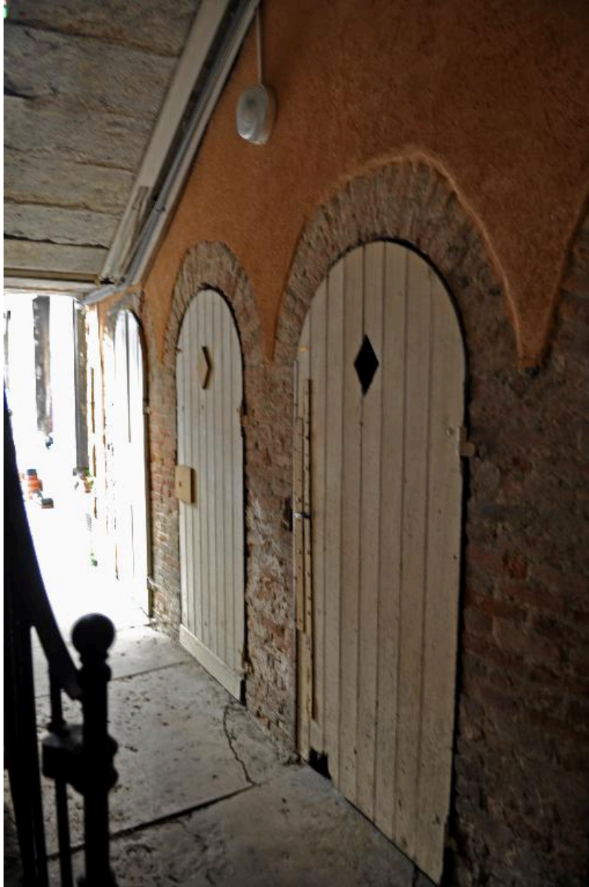
Vue intérieure, arcades en briques dans la cage d'escalier