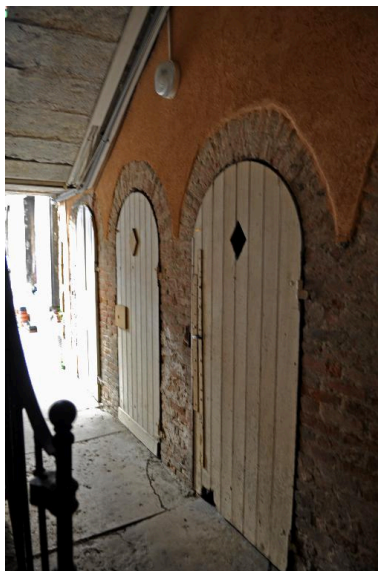
Vue intérieure, arcades en briques dans la cage d'escalier