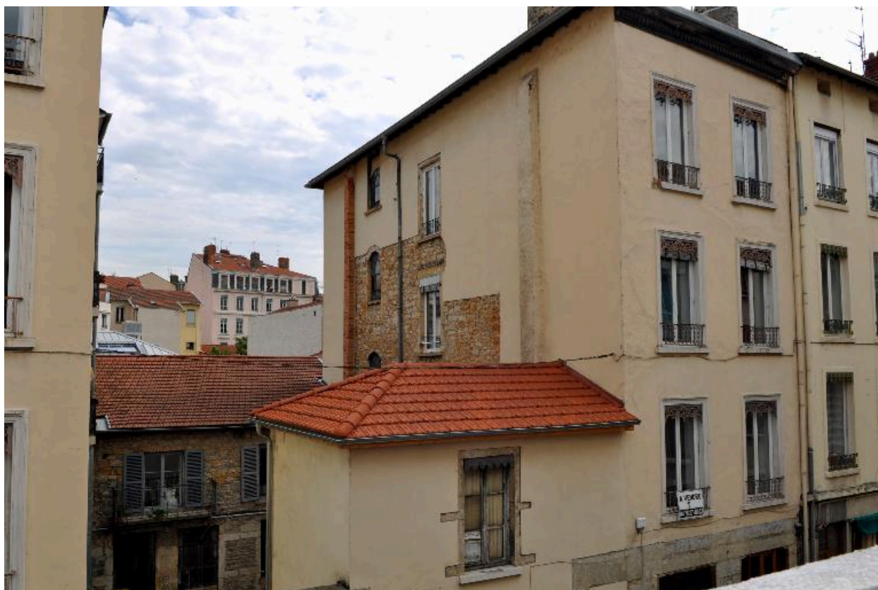
Vue de situation, depuis le sud-ouest