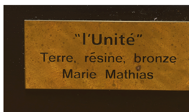
Cartel IVR84_20223800150NUCA