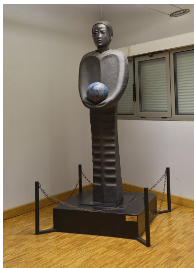
Vue d'ensemble, IVR84_20223800149NUCA