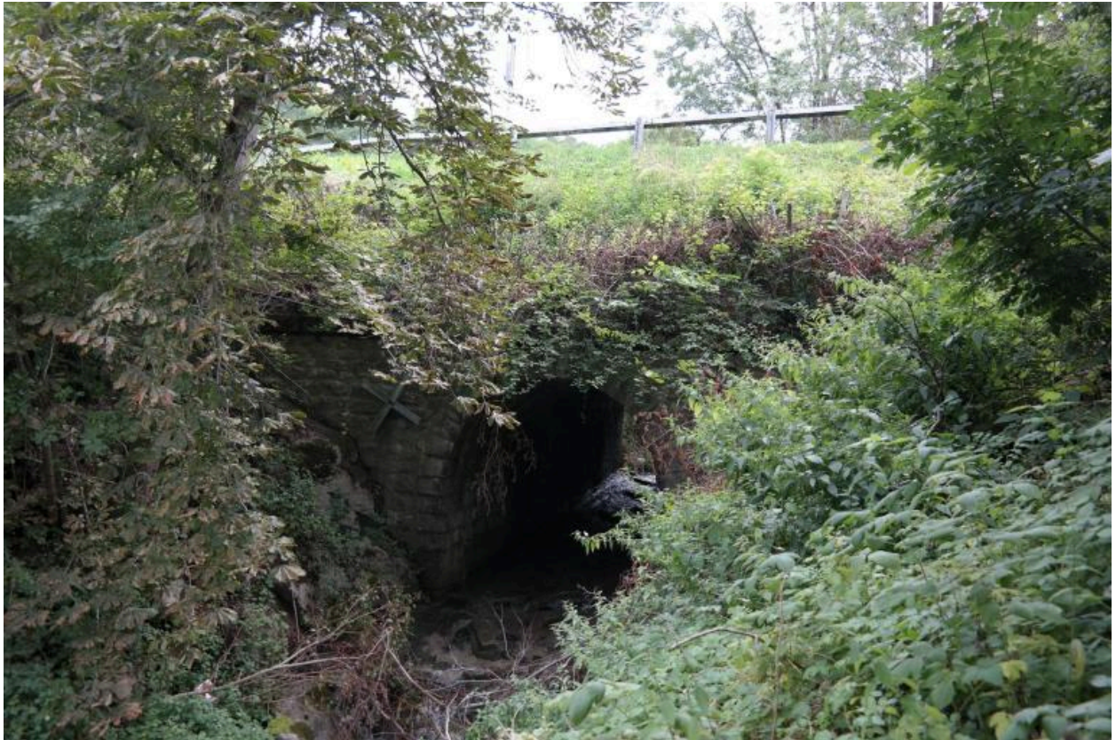
PONT du Chef-Lieu de Vacheresse, vue de la face aval