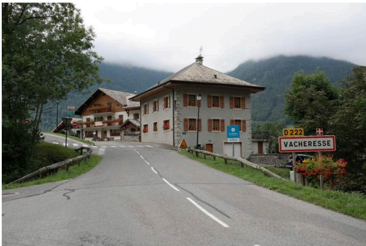
Pont du Chef-Lieu de Vacheresse et son environnement