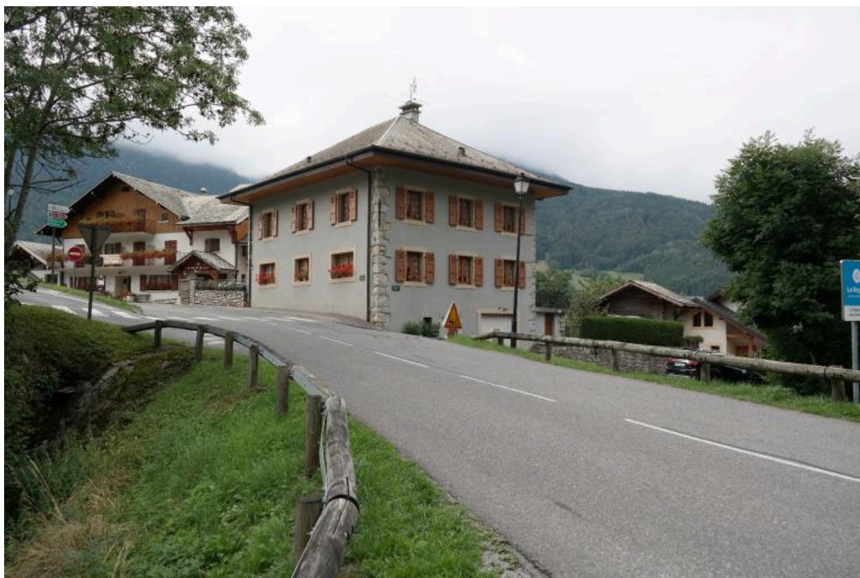
Vue générale du pont du Chef-Lieu