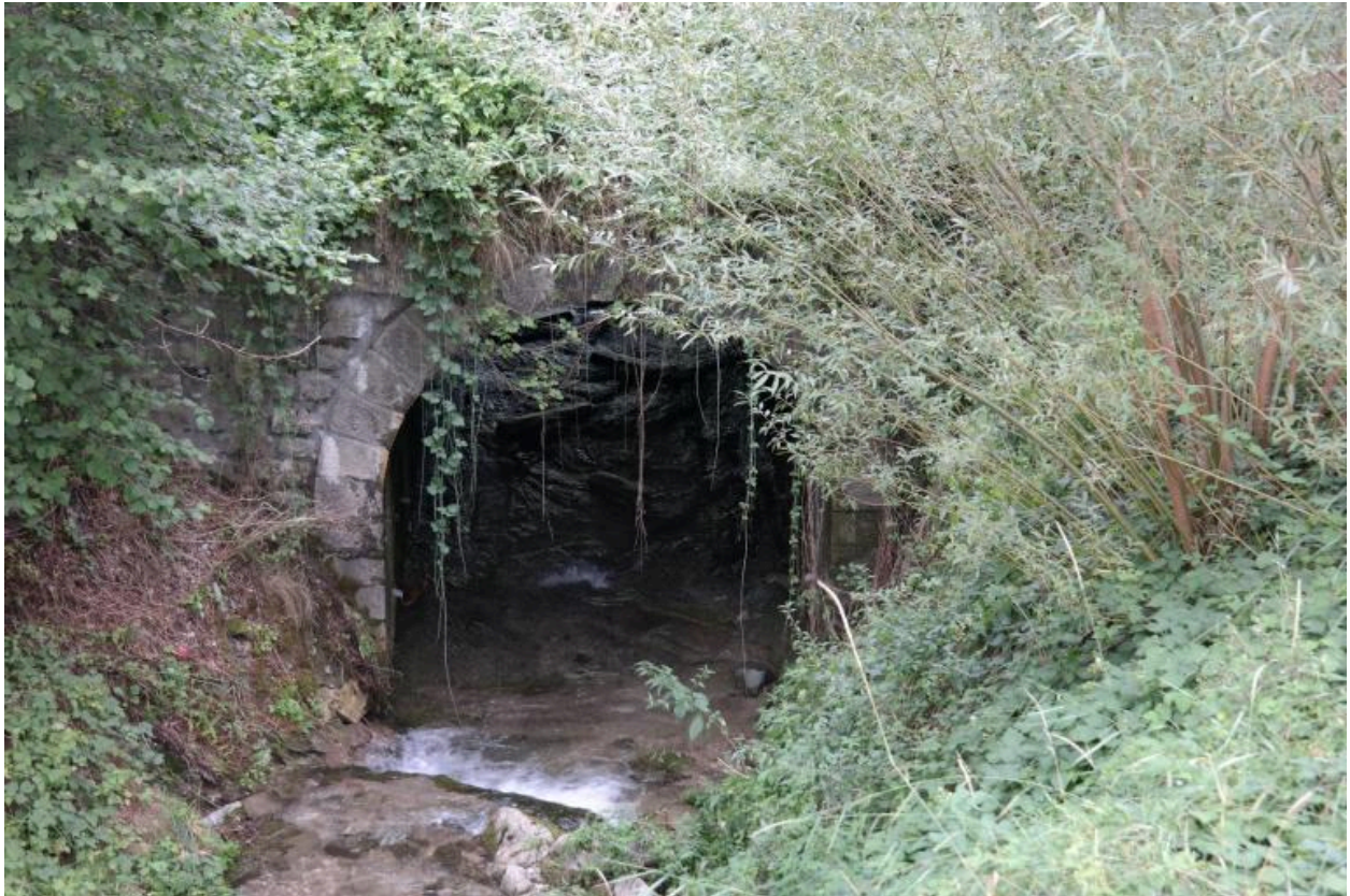
Pont du Chef-Lieu de Vacheresse, vue de la face amont