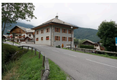
Vue générale du pont du Chef-Lieu IVR84_20197401215NUCA