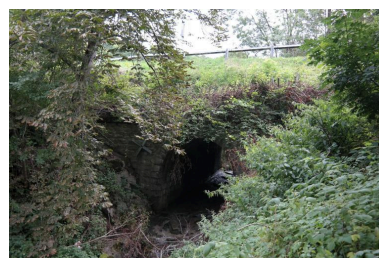
POnt du Chef-Lieu de Vacheresse, vue de la face aval IVR84_20207401226NUCA