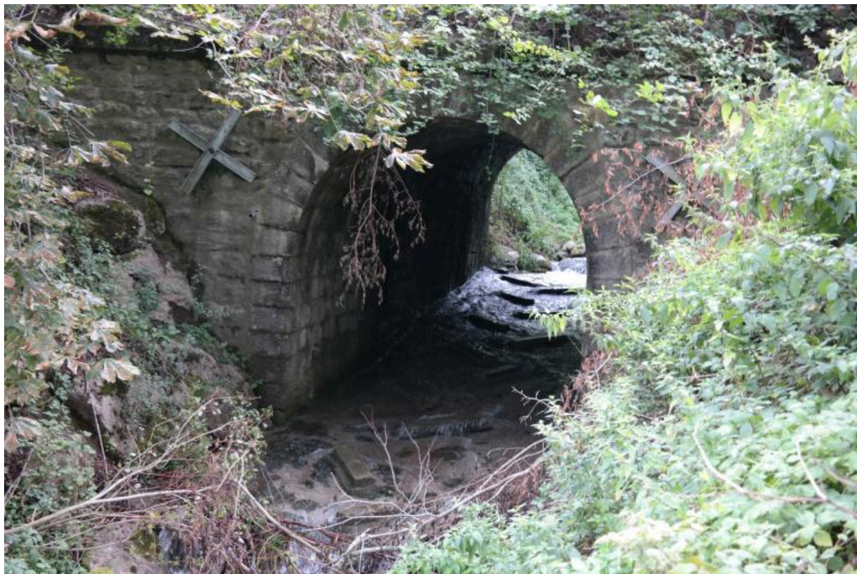
PONT du Chef-Lieu de Vacheresse, face aval détail de la voûte et du lit du court d'eau