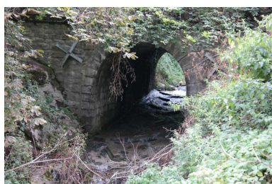
POnt du Chef-Lieu de Vacheresse, face aval détail de la voûte et du lit du court d'eau IVR84_20207401227NUCA