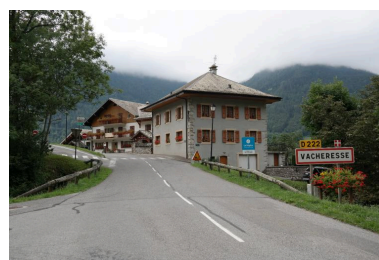
Pont du Chef-Lieu de Vacheresse et son environnement