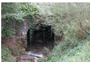
Pont du Chef-Lieu de Vacheresse, vue de la face amont IVR84_20207401228NUCA