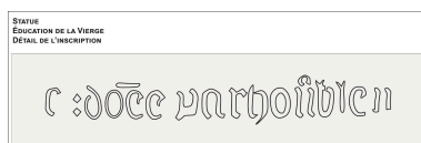
Relevé de l'inscription sur le socle du groupe sculpté. IVR84_20250300511NUDA