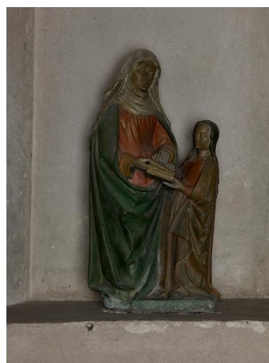
Vue générale, IVR84_20230300555NUC4A