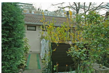
Partie de la façade ouest sur jardin vue depuis l'allée centrale IVR82_20066901301NUCA