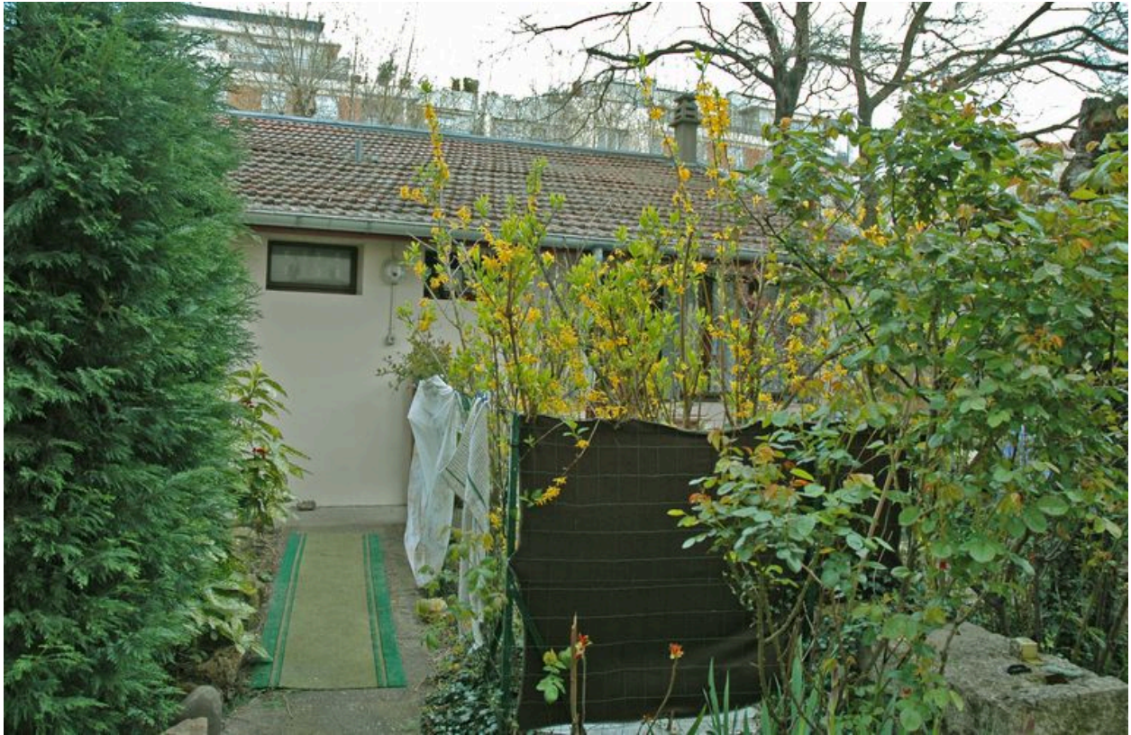
Partie de la façade ouest sur jardin vue depuis l'allée centrale