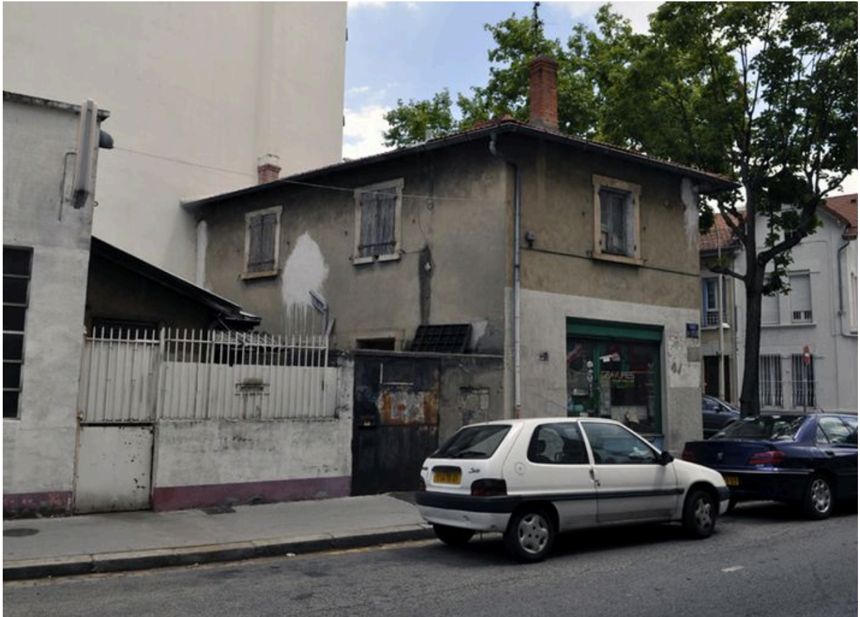
Vue depuis la rue de l'Eglise