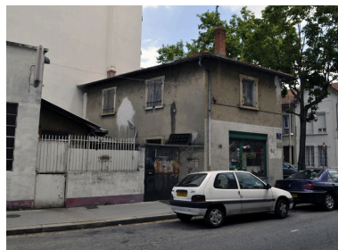
Vue depuis la rue de l'Eglise