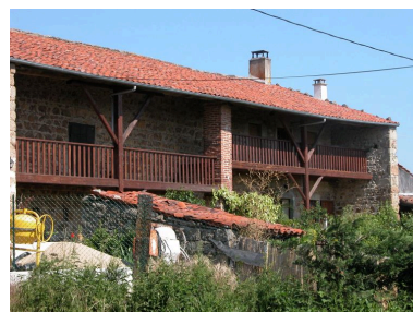
Vue rapprochée de la façade principale de la ferme à aître. IVR82_20124200574NUCA