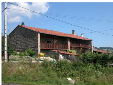
Vue générale IVR82_20124200573NUCA

Plan de situation, sur fond de plan cadastral, section AC, échelle originale 1:1250. Source : Direction générale des Finances Publiques - Cadastre ; mise à jour : 1986. IVR82_20124200572NUD