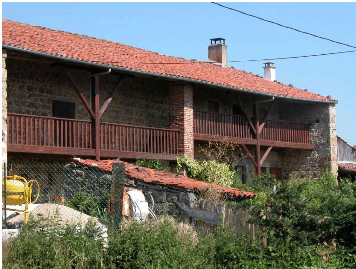
Vue rapprochée de la façade principale de la ferme à aître.