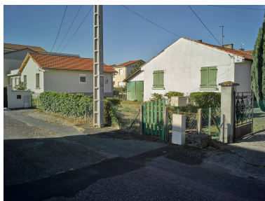
Anciennes maisons Michelin de type AA (début des années 1950), plus ou moins transformées, dans l'impasse Auguste-Comte.