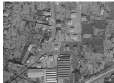
Vue aérienne de la cité, 19/05/1953.

Dess. Guytaine Beuparland-Dupuy IVR84_20216301257NUDA