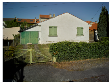
Ancienne maison Michelin de type AA (début des années 1950) dans l'impasse Auguste-Comte.