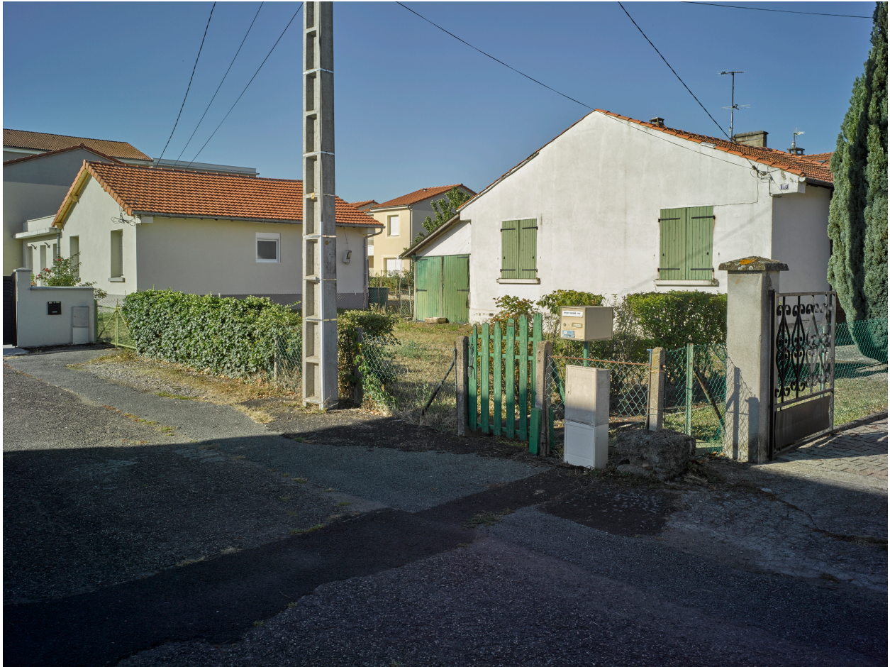
Anciennes maisons Michelin de type AA (début des années 1950), plus ou moins transformées, dans l'impasse Auguste-Comte.