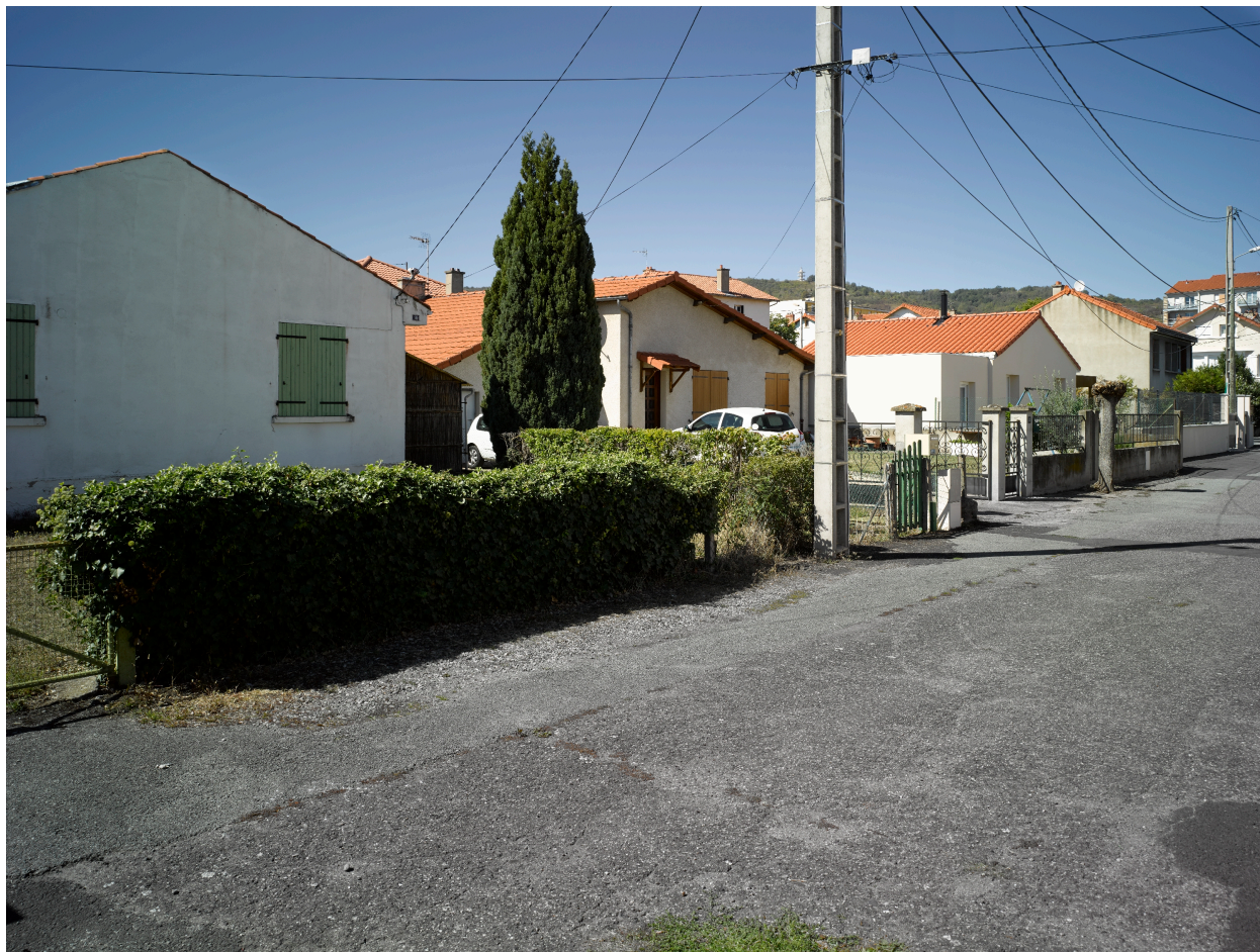
Anciennes maisons Michelin de type AA (début des années 1950), plus ou moins transformées, dans l'impasse Auguste-Comte.