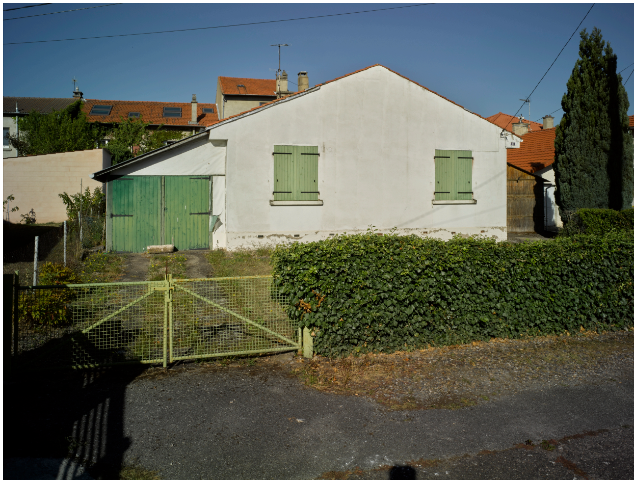
Ancienne maison Michelin de type AA (début des années 1950) dans l'impasse Auguste-Comte.