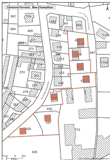
Plan des différents bâtiments d'origine de la cité.

Dess. Brigitte Ceroni, Autr. Service du cadastre IVR84_20196300290NUDA