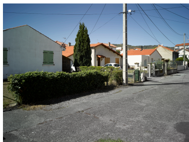
Anciennes maisons Michelin de type AA (début des années 1950), plus ou moins transformées, dans l'impasse Auguste-Comte.