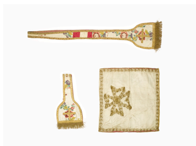
Vue de l'étole, du manipule et d'une face du voile de calice IVR84_20181500271NUC4A