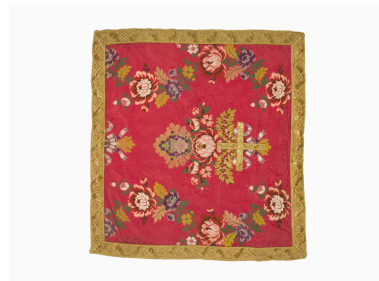
Vue d'une face du voile de calice IVR84_20181500272NUC4A