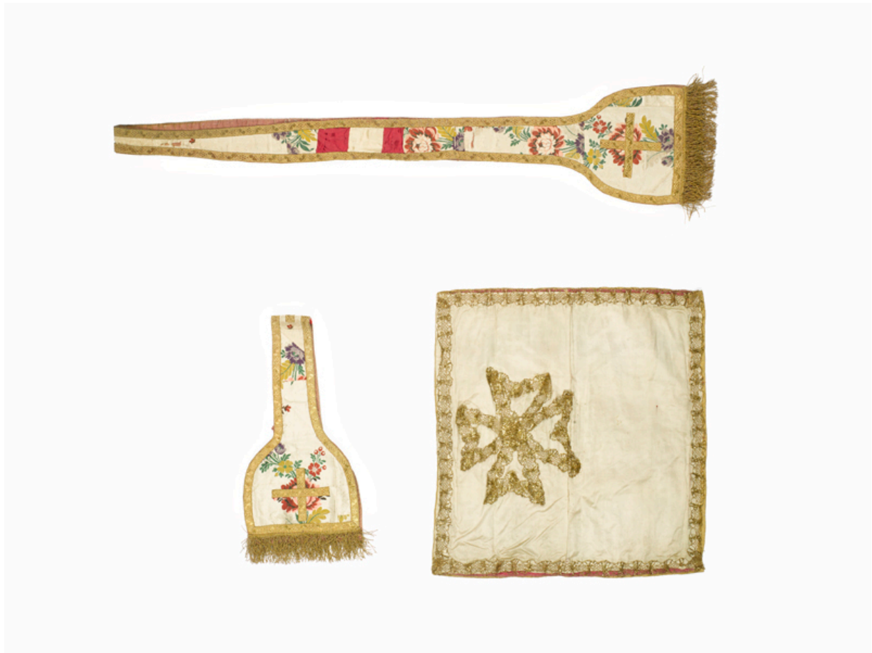
Vue de l'étole, du manipule et d'une face du voile de calice