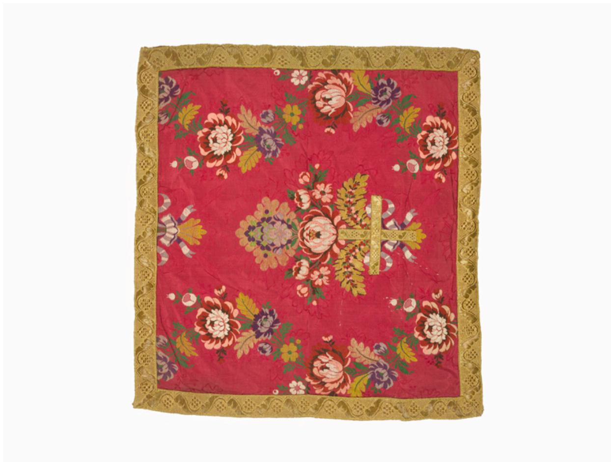
Vue d'une face du voile de calice