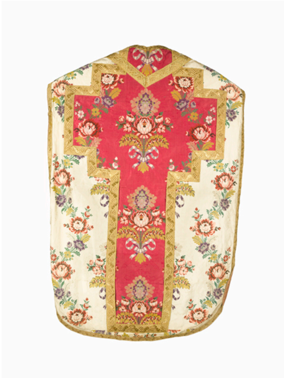
Vue du dos de la chasuble