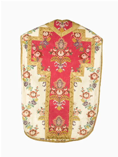
Vue du dos de la chasuble IVR84_20181500266NUC4A