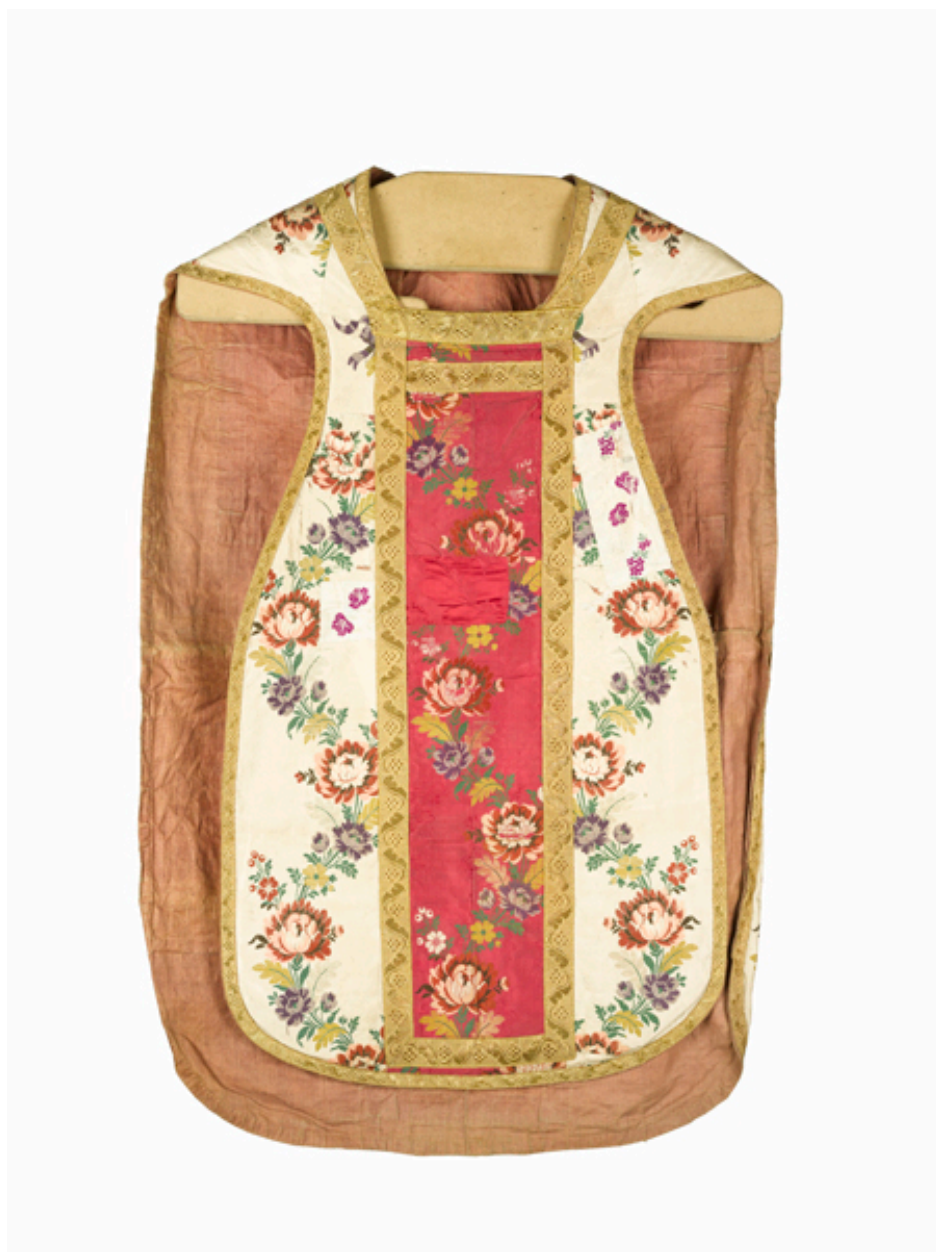
Vue du devant de la chasuble