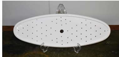
Vue du revers IVR84_20246300530NUCA