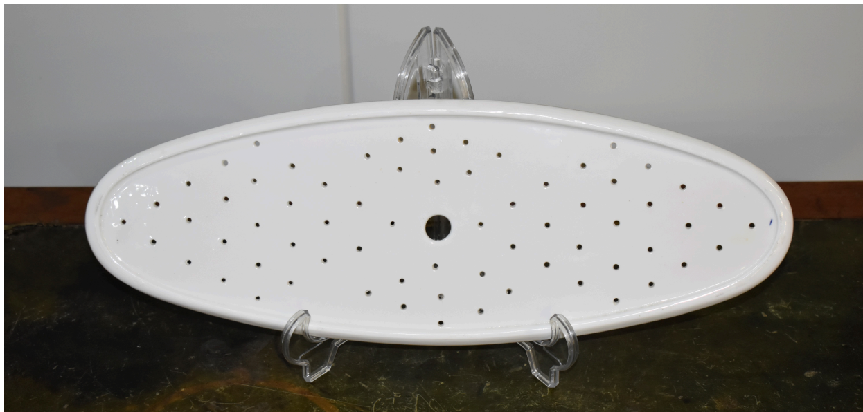
Vue du revers