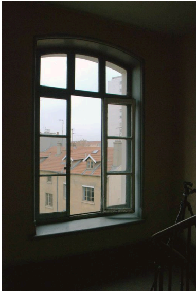
Une baie de la cage d'escalier IVR82_20086900743NUCA