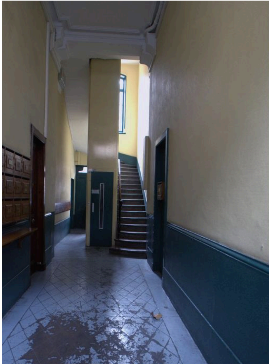
Le vestibule depuis l'entrée