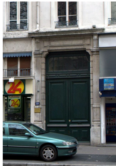
Détail du portail d'entrée IVR82_20086900740NUCA