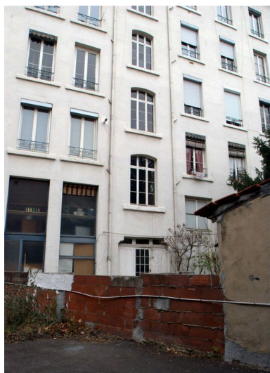
Elévation postérieure