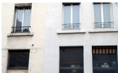
Détail des baies de l'élévation postérieure IVR82_20086900736NUCA