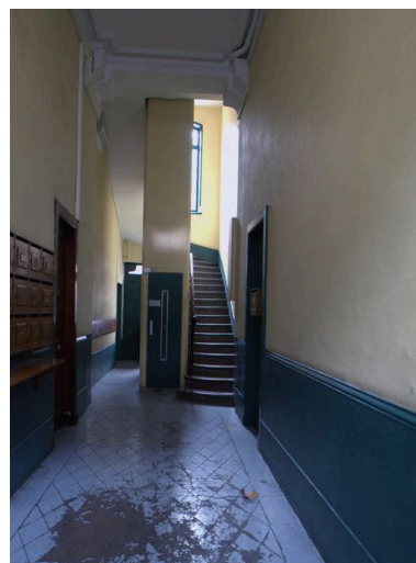
Le vestibule depuis l'entrée