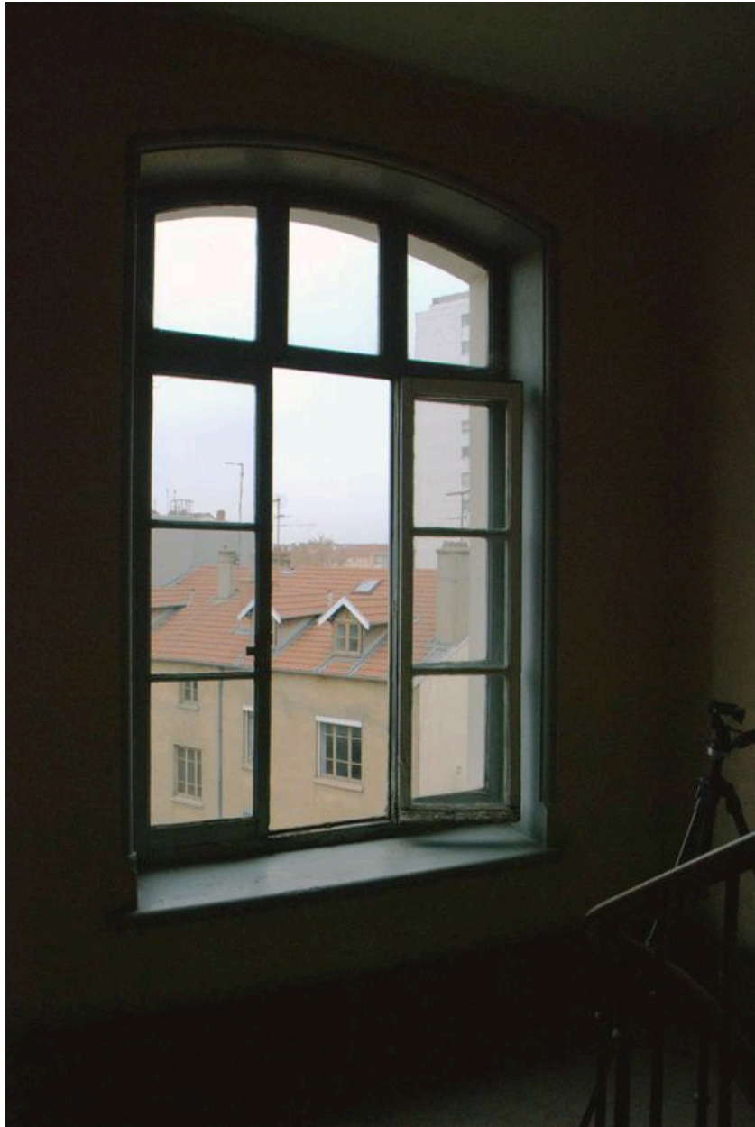
Une baie de la cage d'escalier