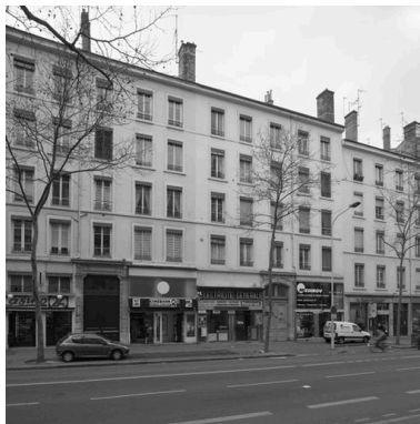
Elévation principale IVR82_20056900634NUC