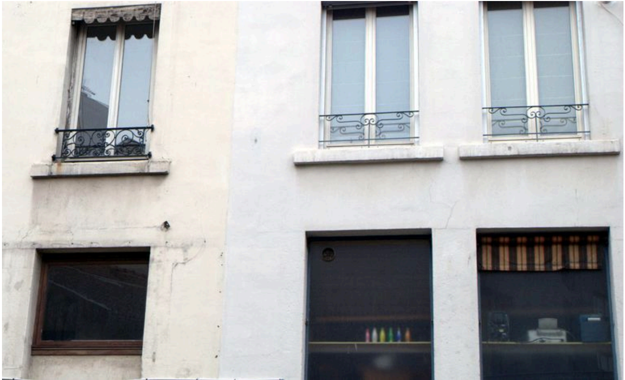
Détail des baies de l'élévation postérieure