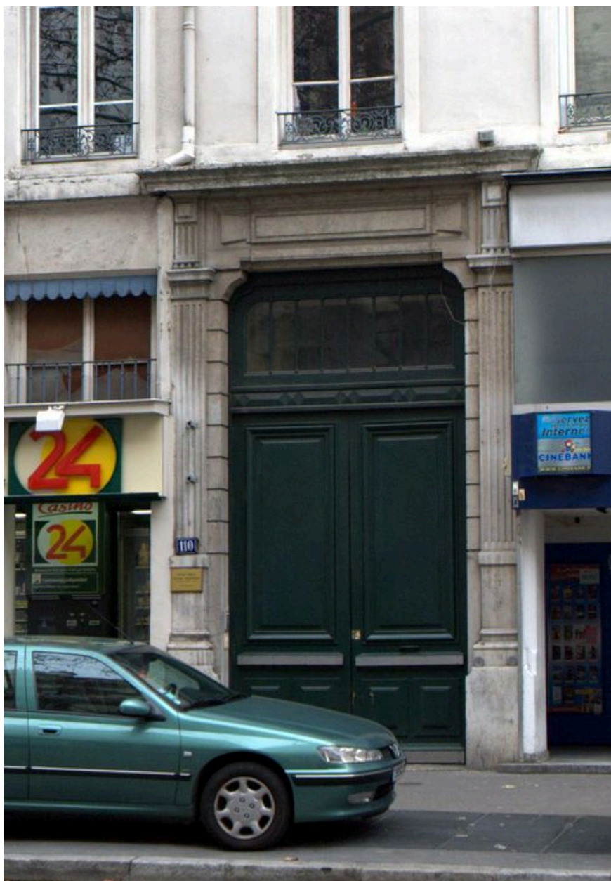
Détail du portail d'entrée