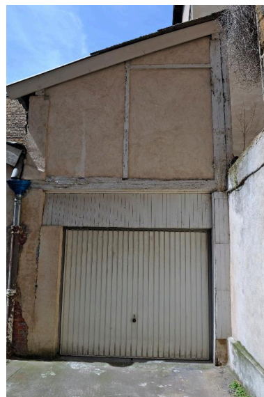
Vue de la cour, hangar en pan-de-bois