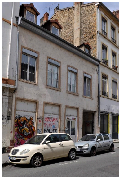
Vue générale, élévation sur rue IVR84_20176901489NUCA