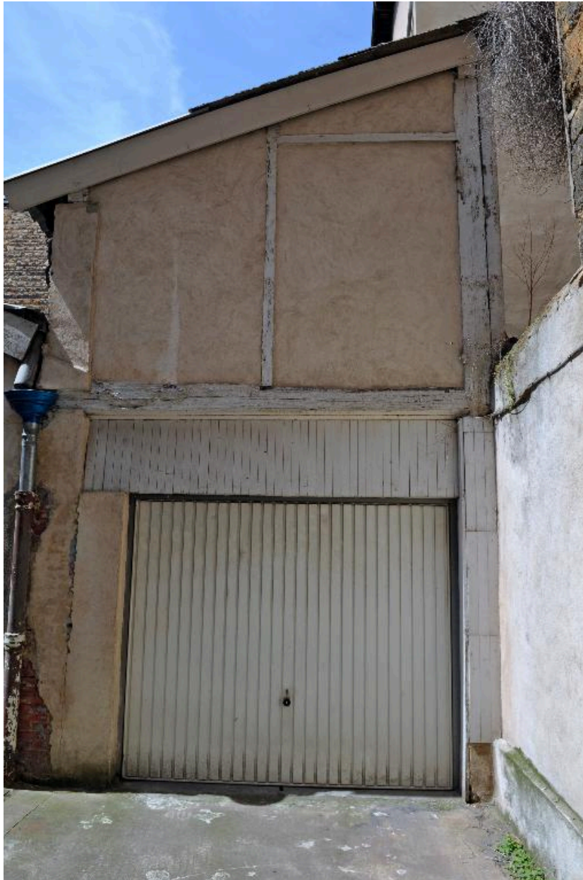
Vue de la cour, hangar en pan-de-bois