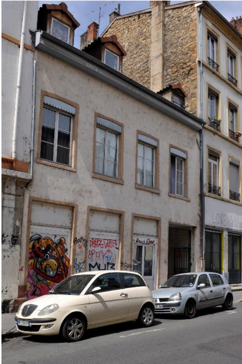
Vue générale, élévation sur rue