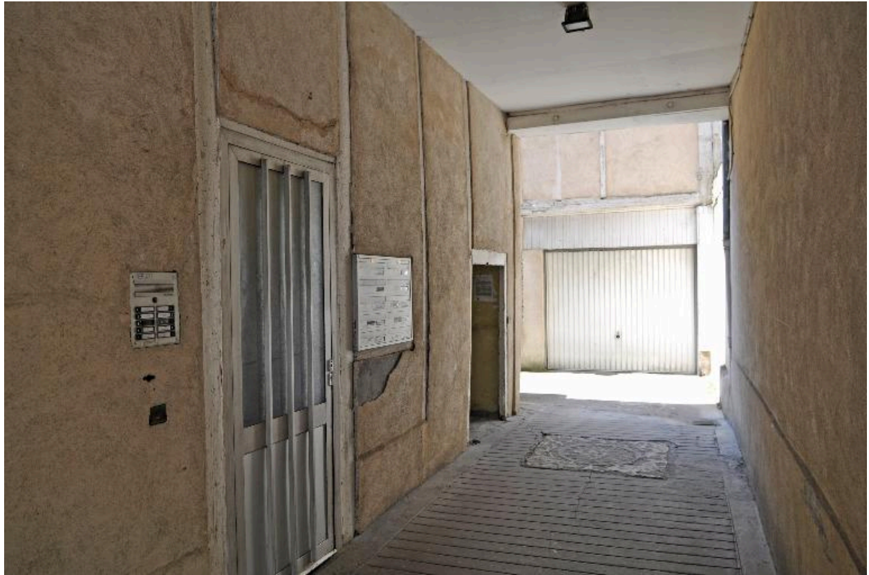
Vue du passage cocher, mur latéral en pan-de-bois