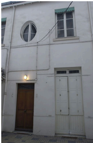
Façade du bâtiment sur cour