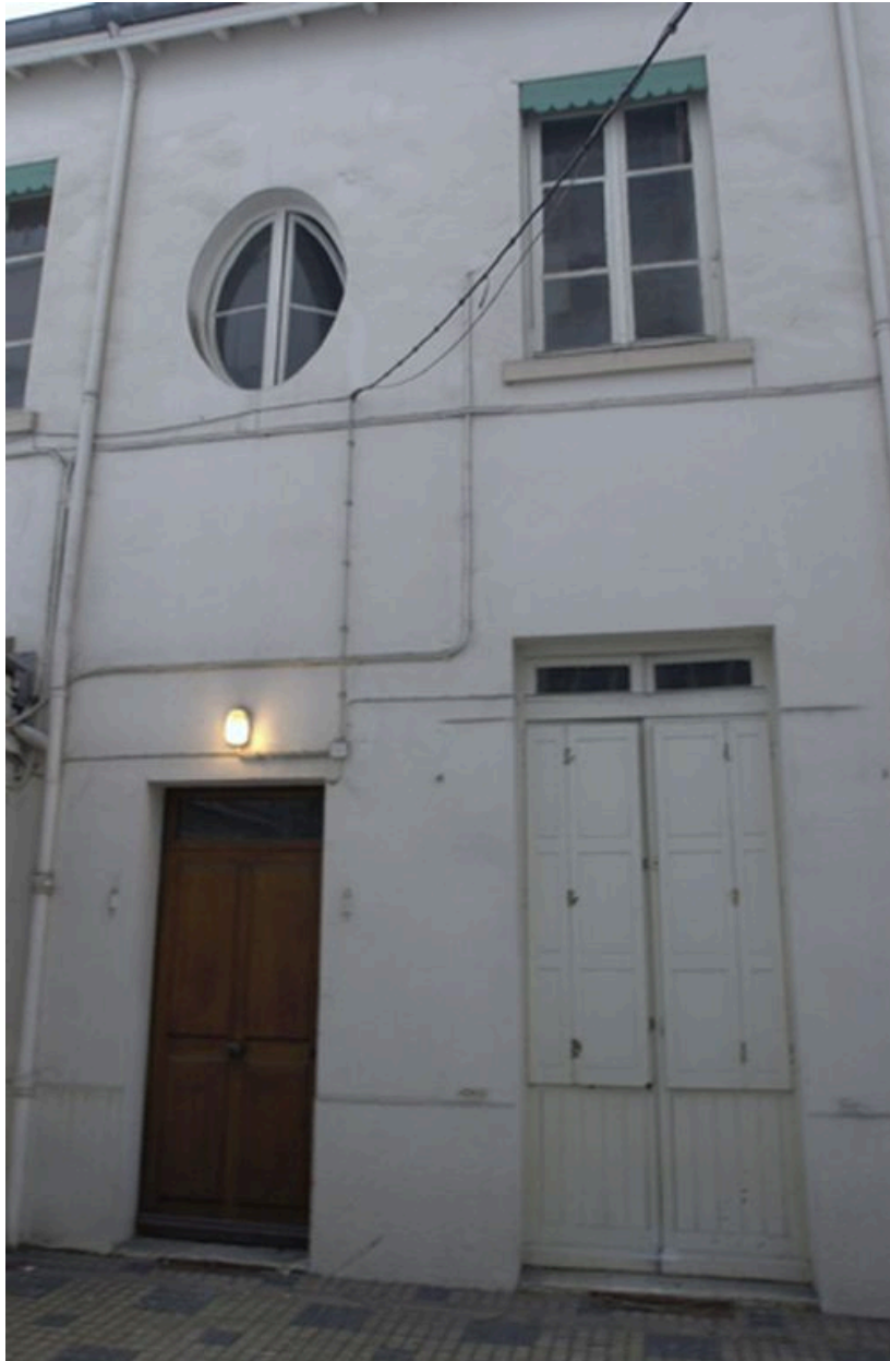
Façade du bâtiment sur cour