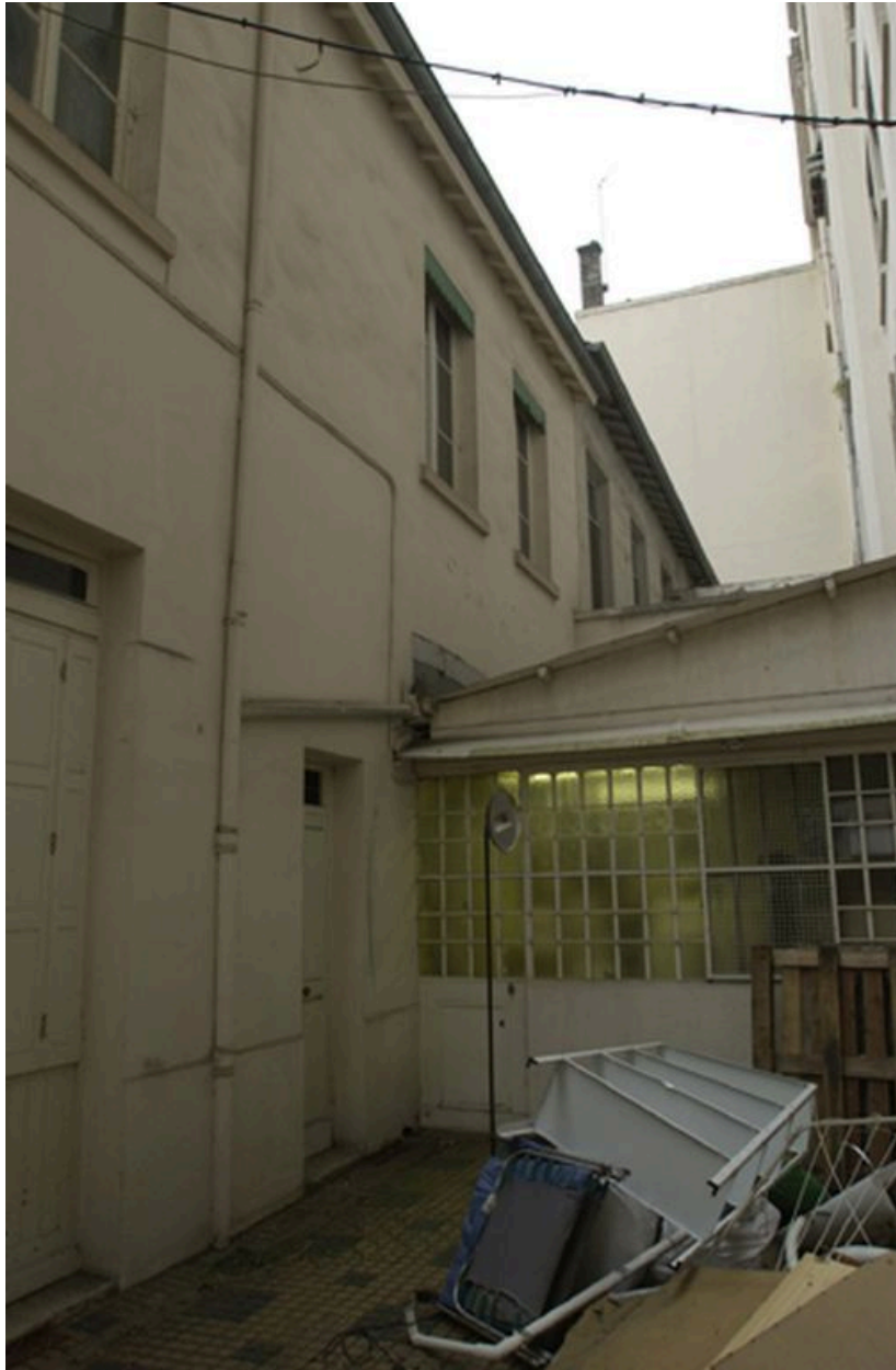
Vue de la cour et du bâtiment B vers le sud