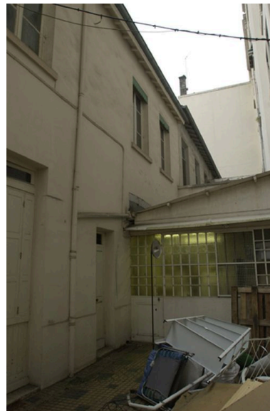
Vue de la cour et du bâtiment B vers le sud IVR82_20046904363NUCA