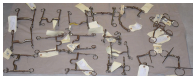
Vue générale IVR84_20226302540NUC4A