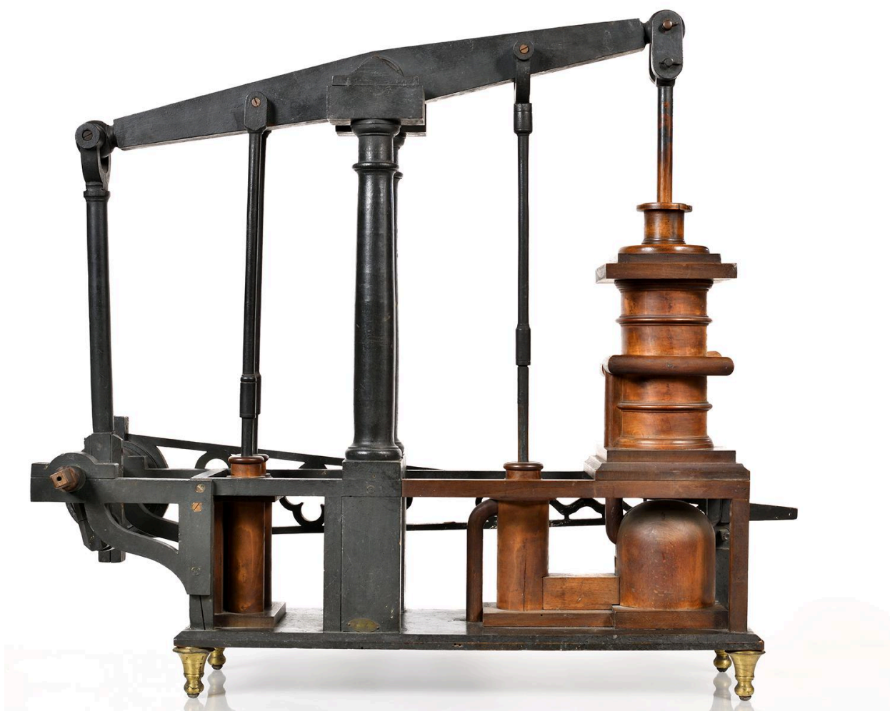
Machine à vapeur, vue 2