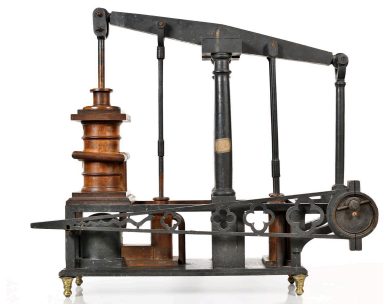
Machine à vapeur, vue 1 IVR84_20256901831NUCA