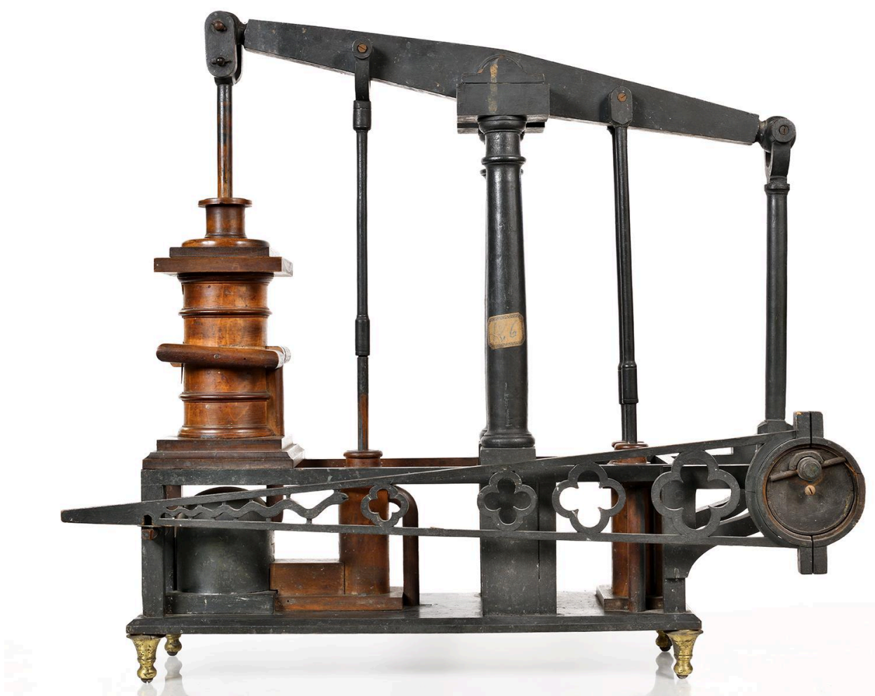
Machine à vapeur, vue 1