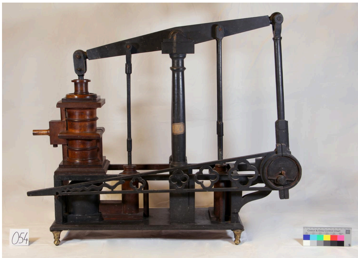
Machine à vapeur, vue de face