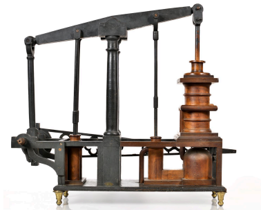
Machine à vapeur, vue 2 IVR84_20256901832NUCA