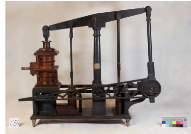
Machine à vapeur, vue de face IVR84_20256901073NUCA