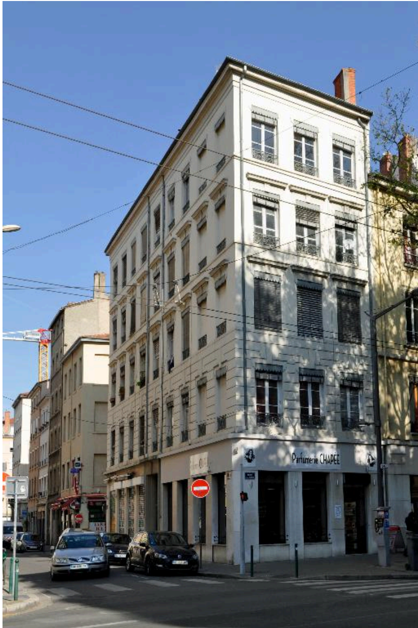
Vue d'ensemble, depuis le sud-est (avenue Jean-Jaurès)