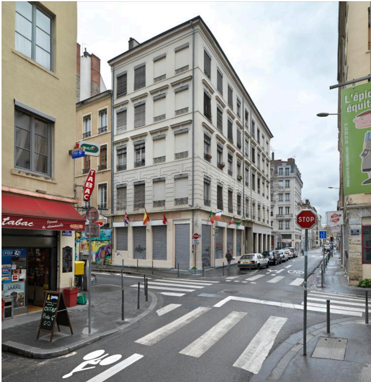
Vue d'ensemble, depuis le sud-ouest (rue Sébastien-Gryphe)