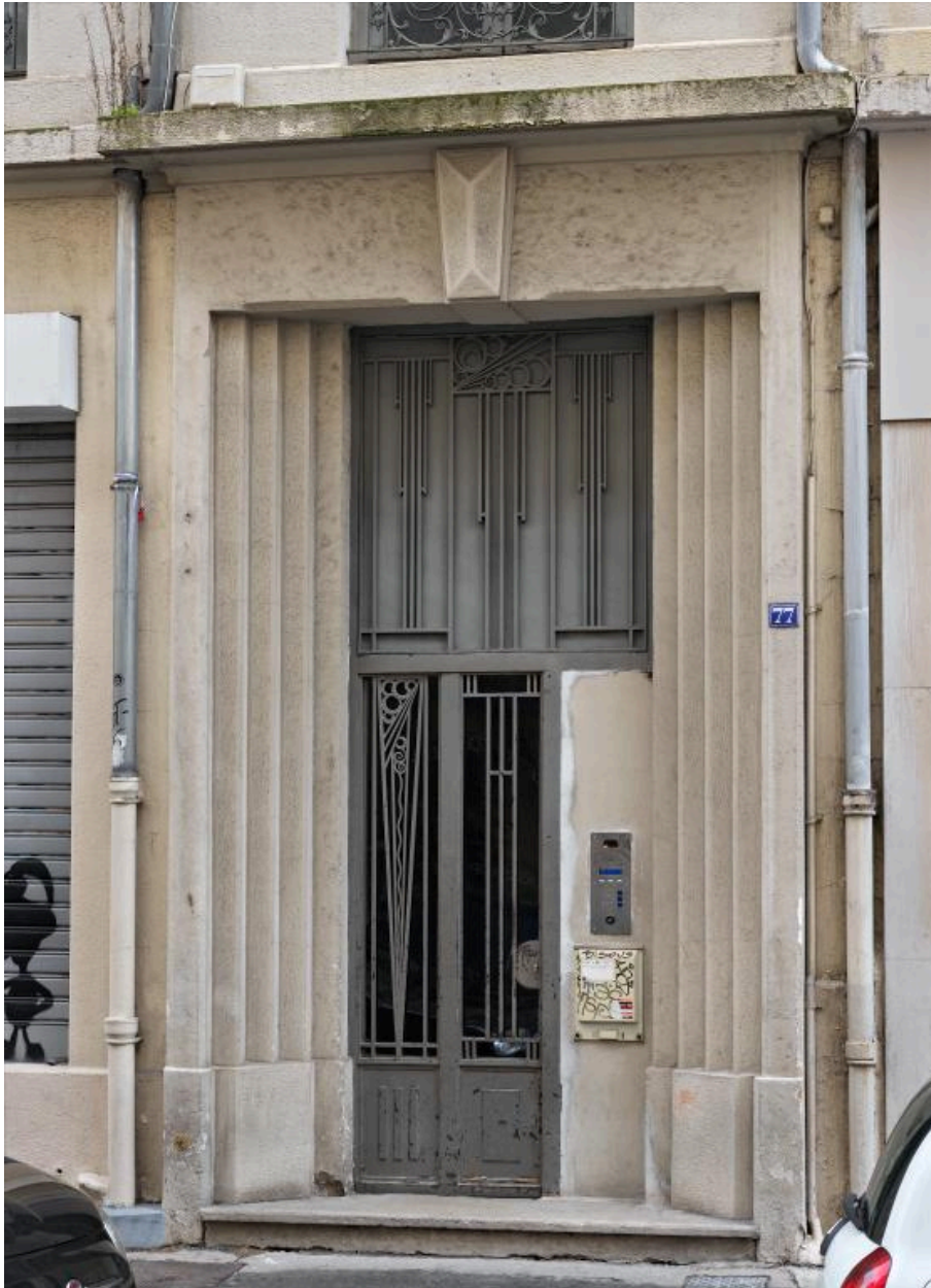
Vue rapprochée de la porte d'entrée, remaniée au milieu 20e siècle