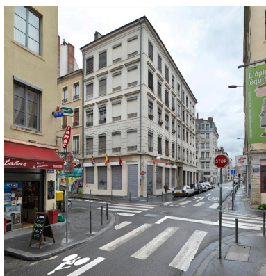
Vue d'ensemble, depuis le sud-ouest (rue Sébastien-Gryphe)