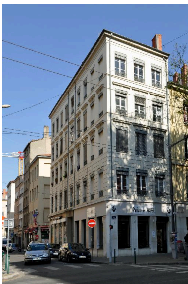
Vue d'ensemble, depuis le sud-est (avenue Jean-Jaurès) IVR84_20176901309NUCA