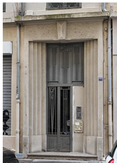
Vue rapprochée de la porte d'entrée, remaniée au milieu 20e siècle IVR84_20196900240NUCAQ