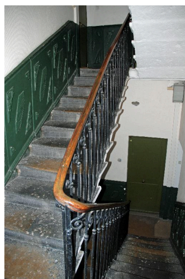
Vue intérieure : la cage d'escalier