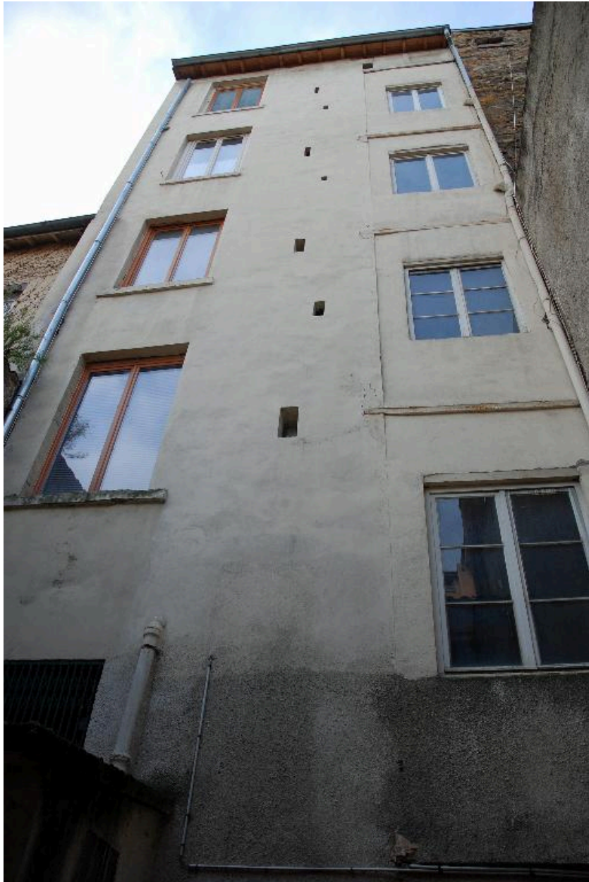
Vue partielle de l'élévation sur cour