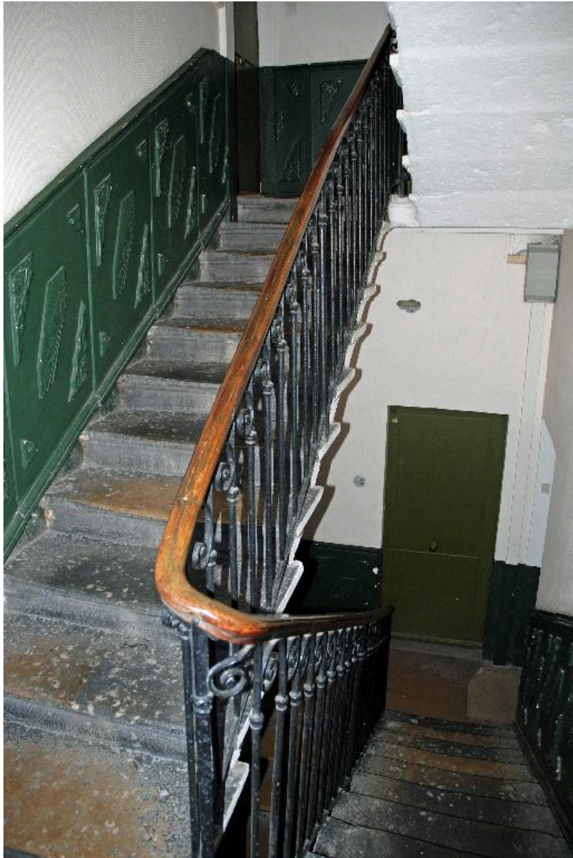
Vue intérieure : la cage d'escalier