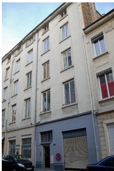
Vue générale de l'élévation sur rue IVR82_20146902972NUCA