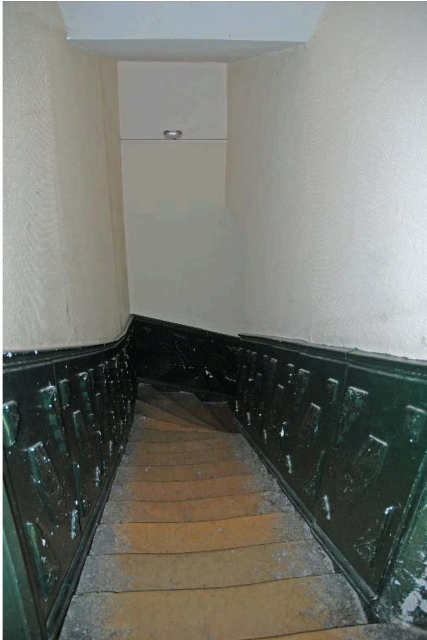
Vue intérieure : la première volée de l'escalier