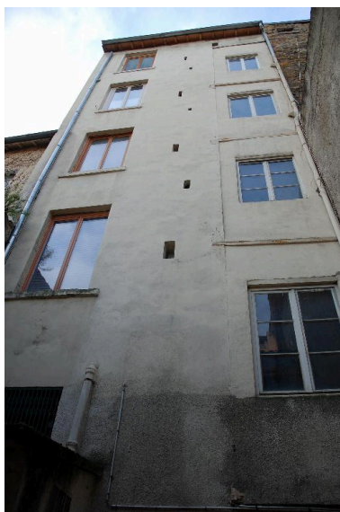
Vue partielle de l'élévation sur cour IVR82_20146902973NUCA