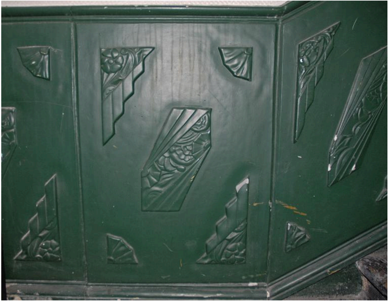
Vue intérieure : le décor de la cage d'escalier, détail d'un panneau moulé