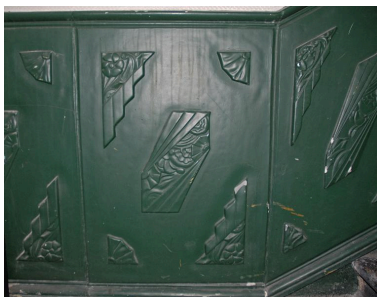
Vue intérieure : le décor de la cage d'escalier, détail d'un panneau moulé IVR82_20146902975NUCA