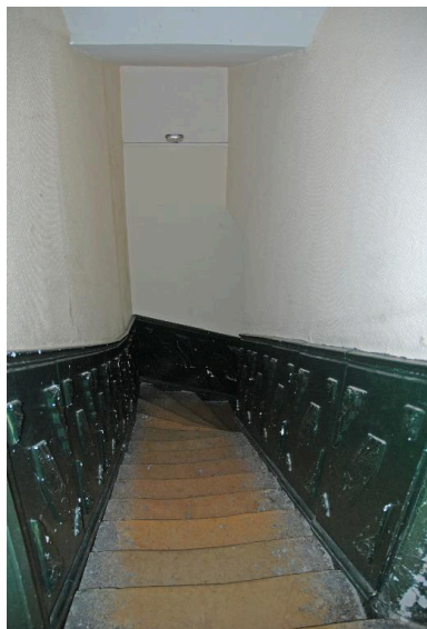
Vue intérieure : la première volée de l'escalier