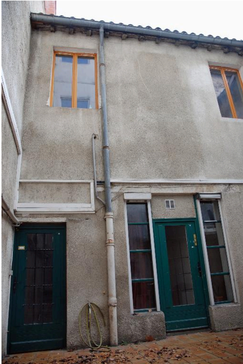
Bâtiment sur cour, vue partielle