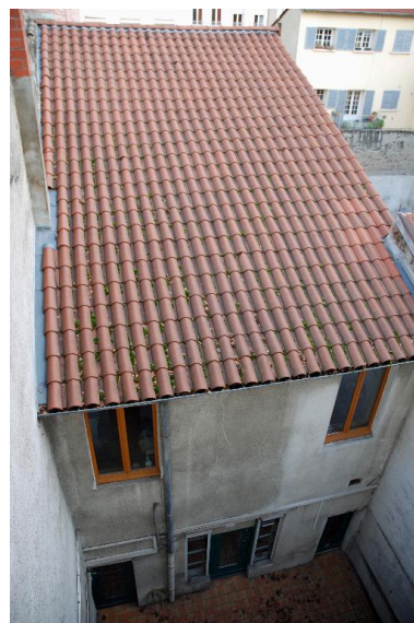
Bâtiment sur cour, vue plongeante IVR82_20146902978NUCA