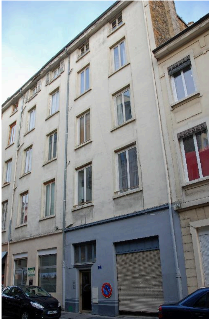
Vue générale de l'élévation sur rue