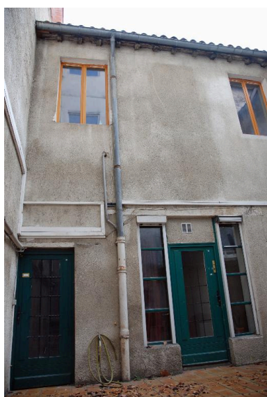
Bâtiment sur cour, vue partielle IVR82_20146902979NUCA