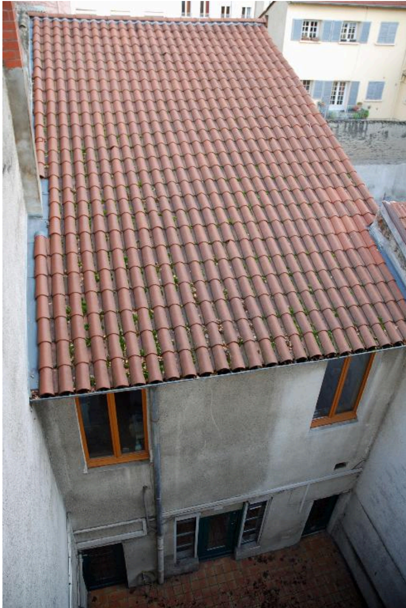
Bâtiment sur cour, vue plongeante