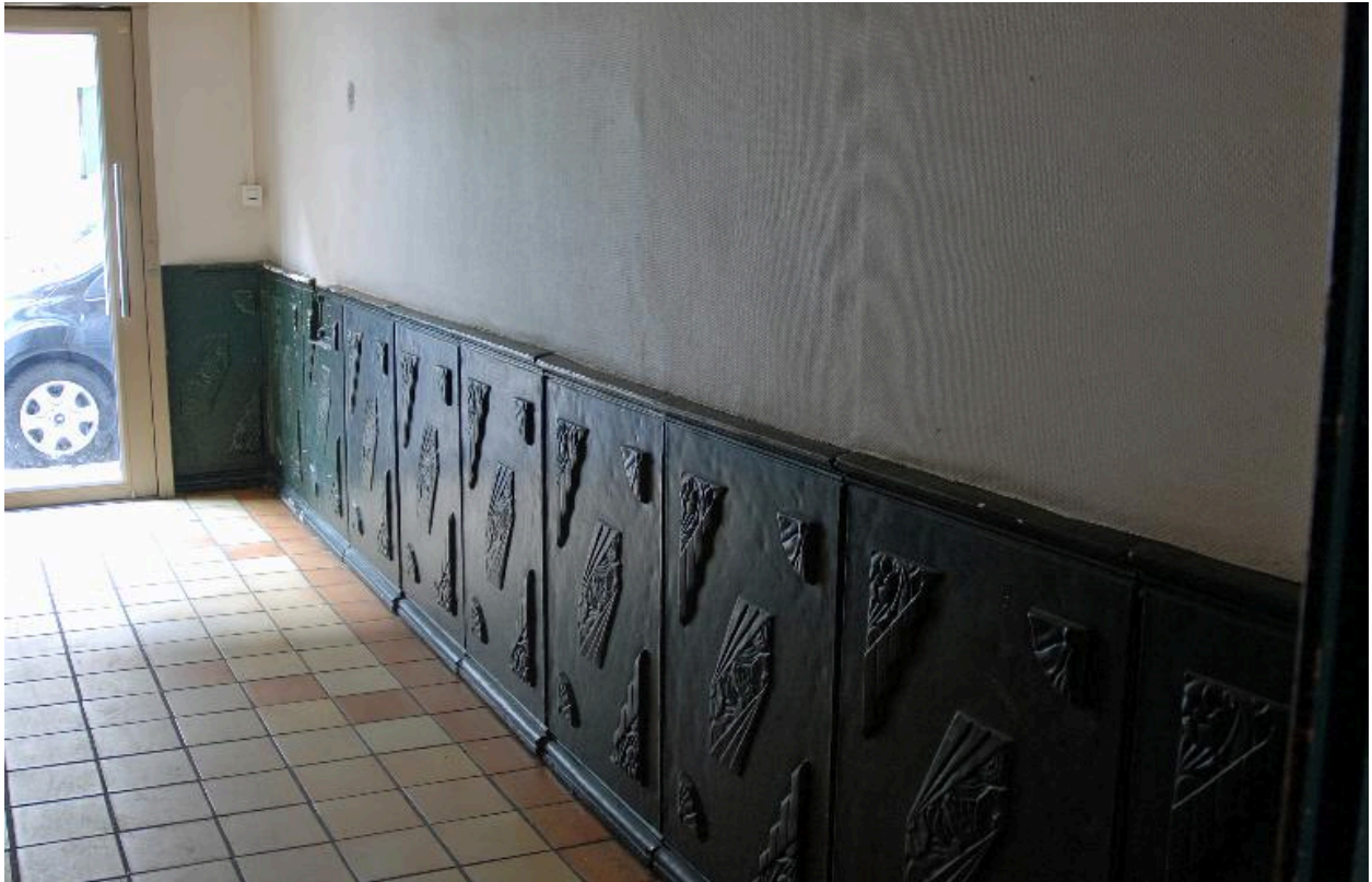
Vue intérieure : l'allée