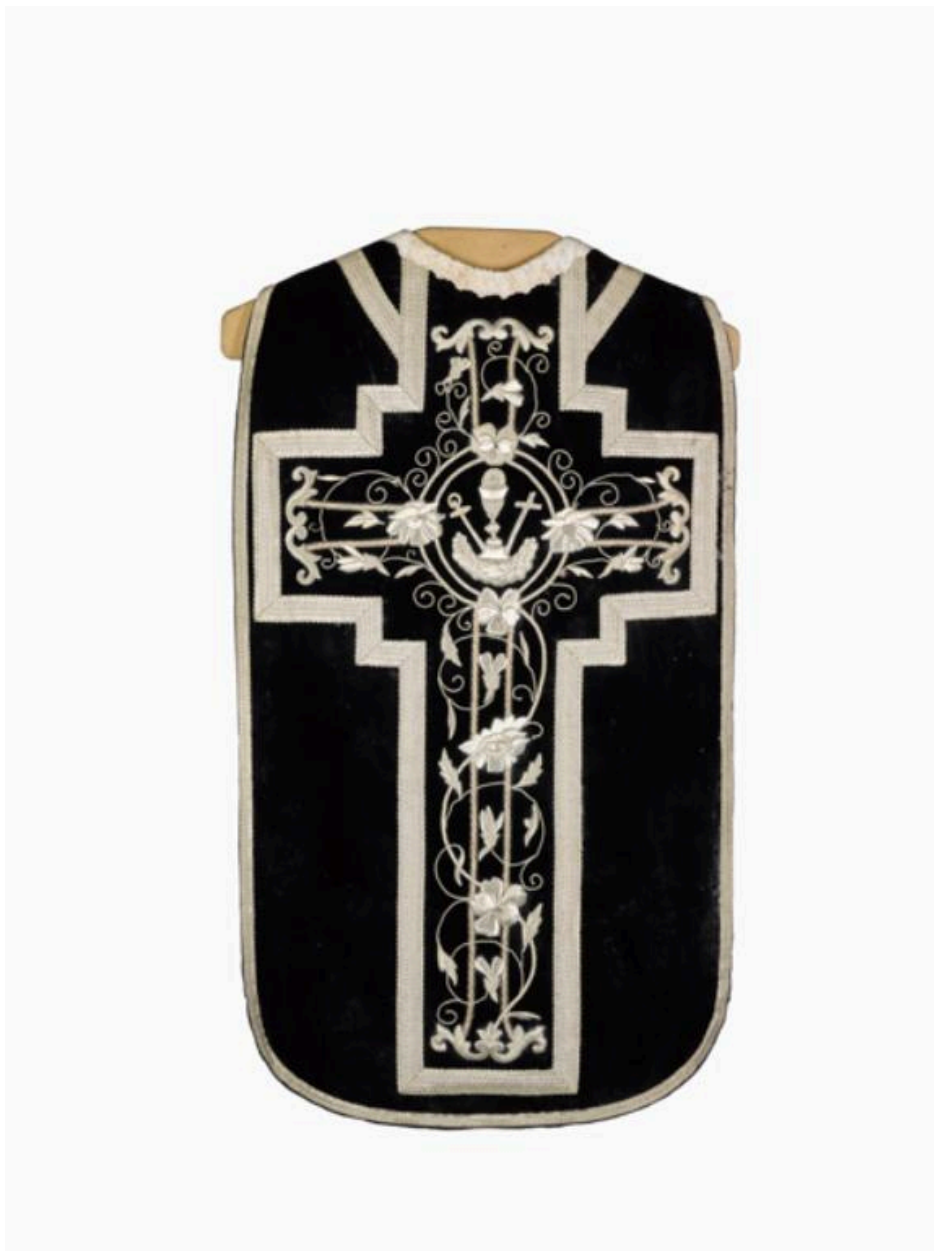
Vue générale du dos de la chasuble