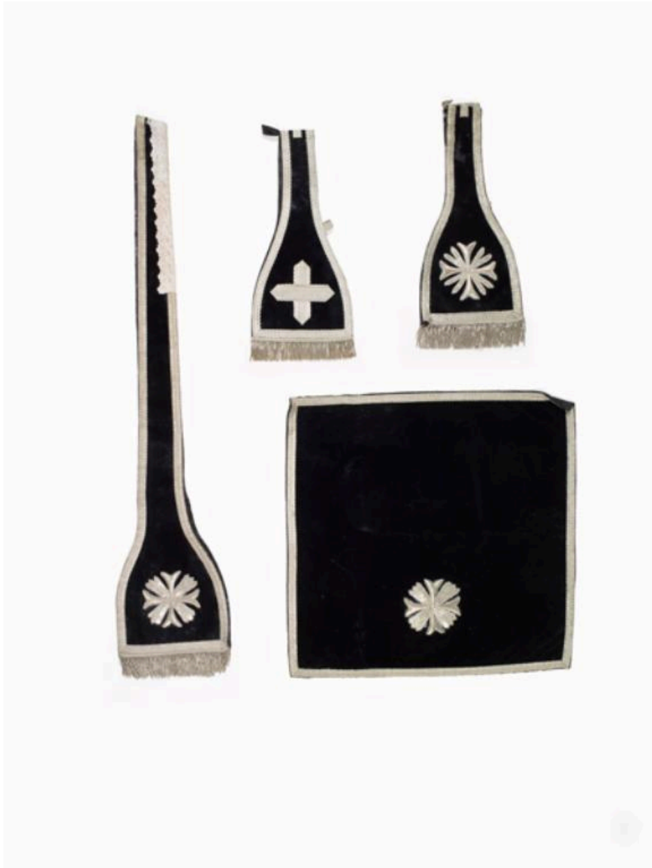
Vue générale de l'étole, du manipule (à droite, le manipule de gauche appartient à un autre ornement, non étudié), du voile de calice.