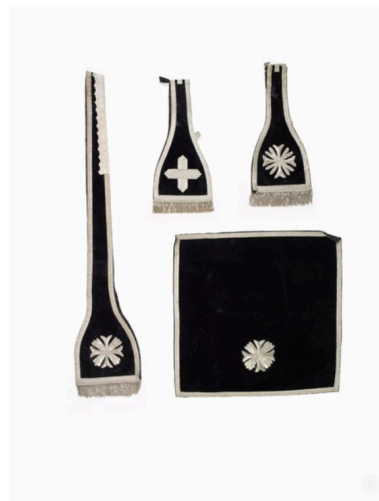
Vue générale de l'étole, du manipule (à droite, le manipule de gauche appartient à un autre ornement, non étudié), du voile de calice.