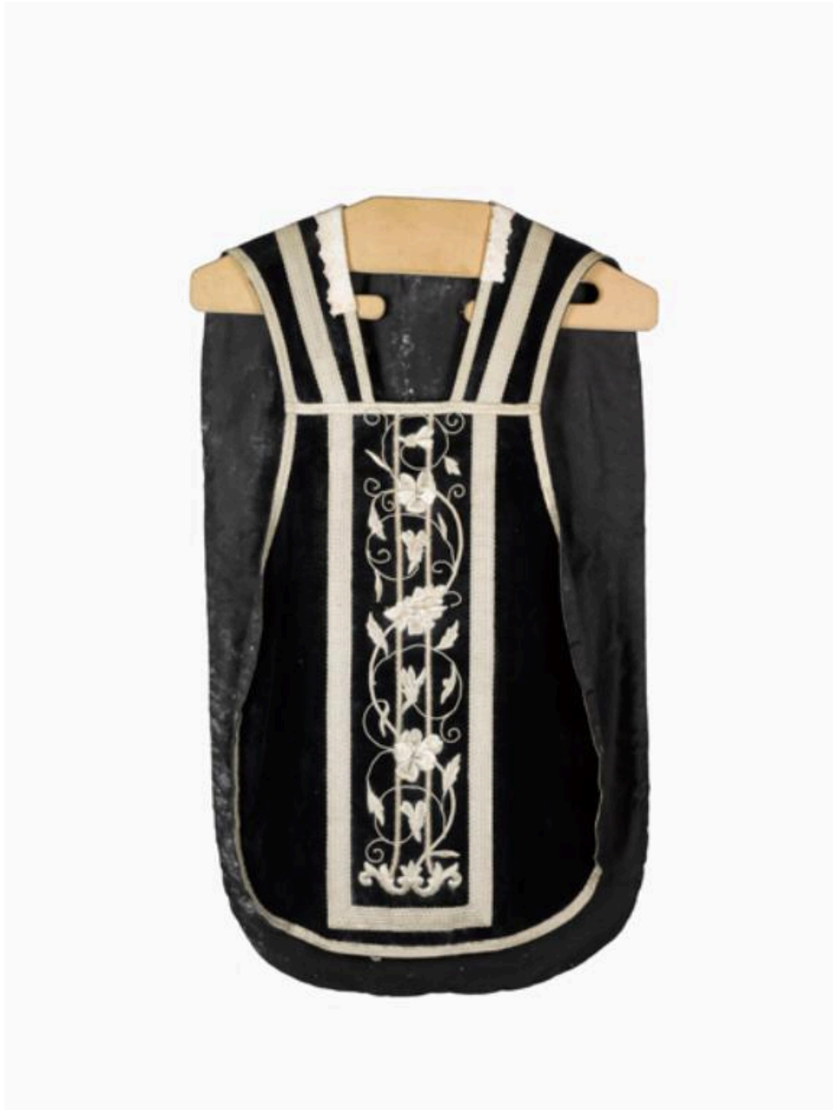
Vue du devant de la chasuble