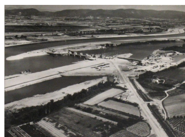
[Barrage de Loriol] 1 fotogr. nég. n. et b. 13 x 18 cm (AD Drôme. Fonds Cellard, 95 Fi 1218) IVR82_20102600037NUCAB