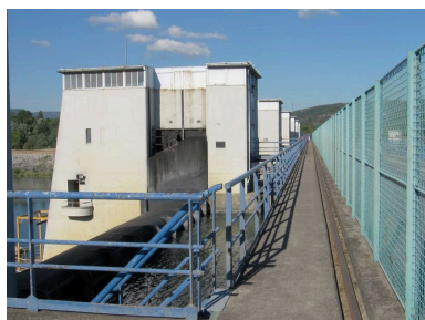
Passerelle (depuis la rive gauche)