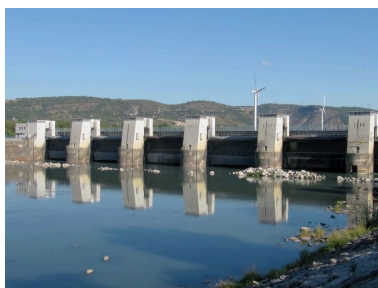
Vue générale, face aval (depuis la rive gauche) IVR82_20102600091NUCA