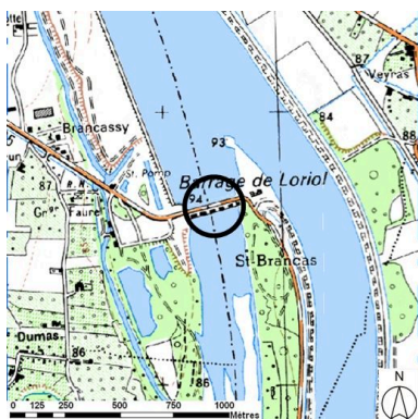
Plan de situation (sur fond de SCAN25(R) Licence n°2008-CISE27-1010) IVR82_20102600249NUD