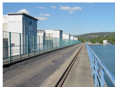
Barrage et chaussée du pont routier, face aval (depuis la rive gauche) IVR82_20102600090NUCA