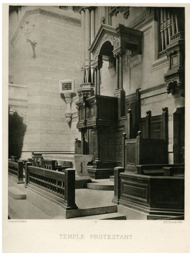
Vue du sanctuaire avec l'autel, en 1898.