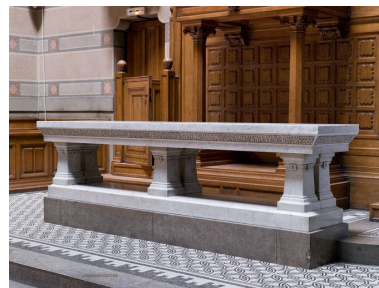
Vue générale IVR82_20106902412NUCA