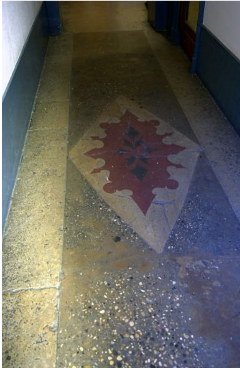
Sol de l'allée