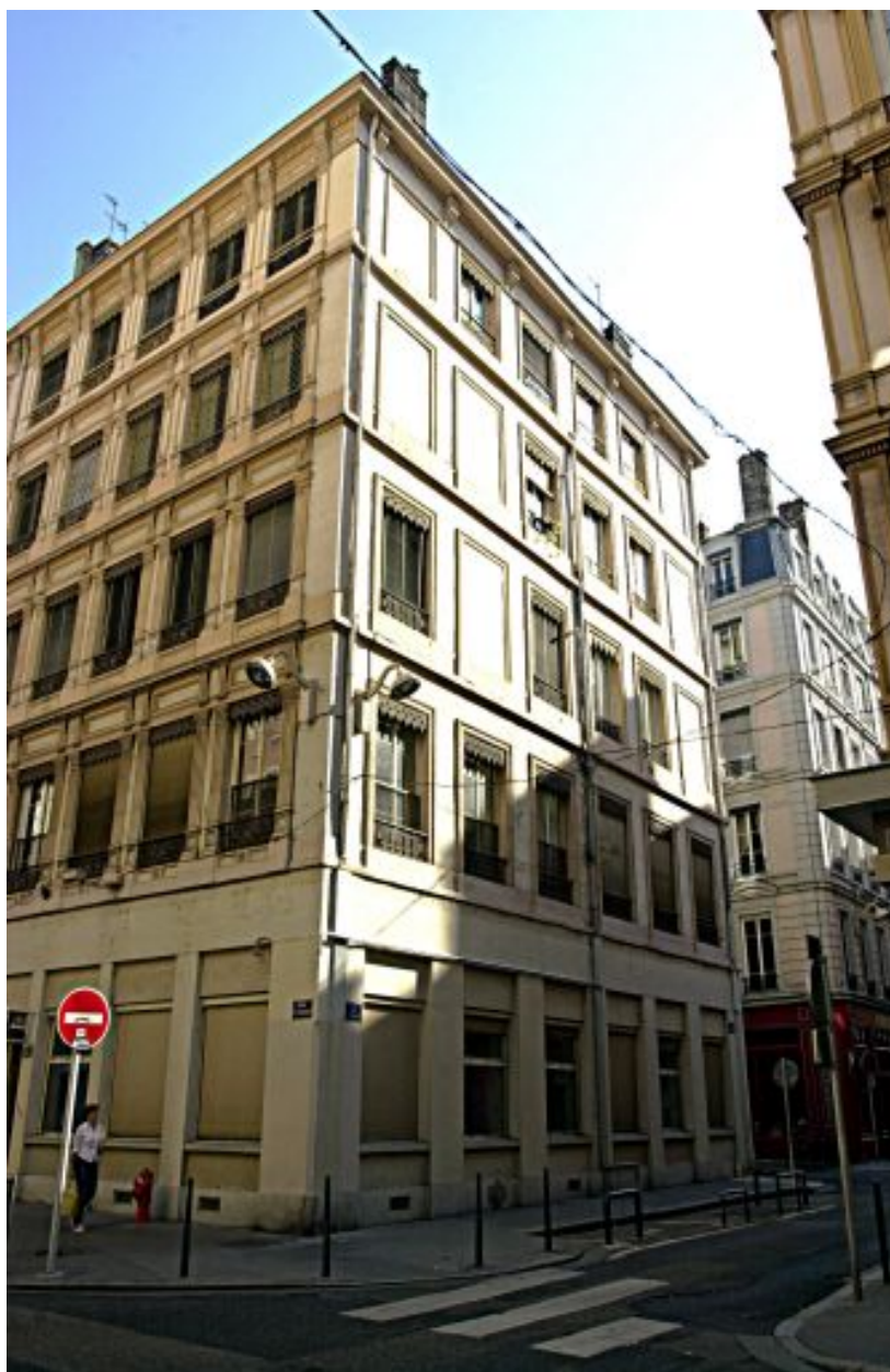
Façade sur la rue Longue