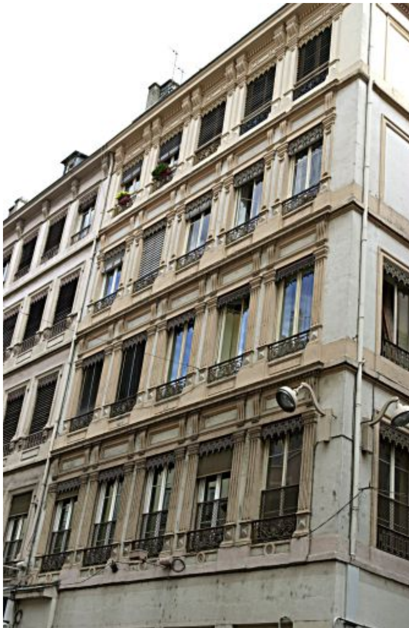
Façade principale, élévation des étages carrés