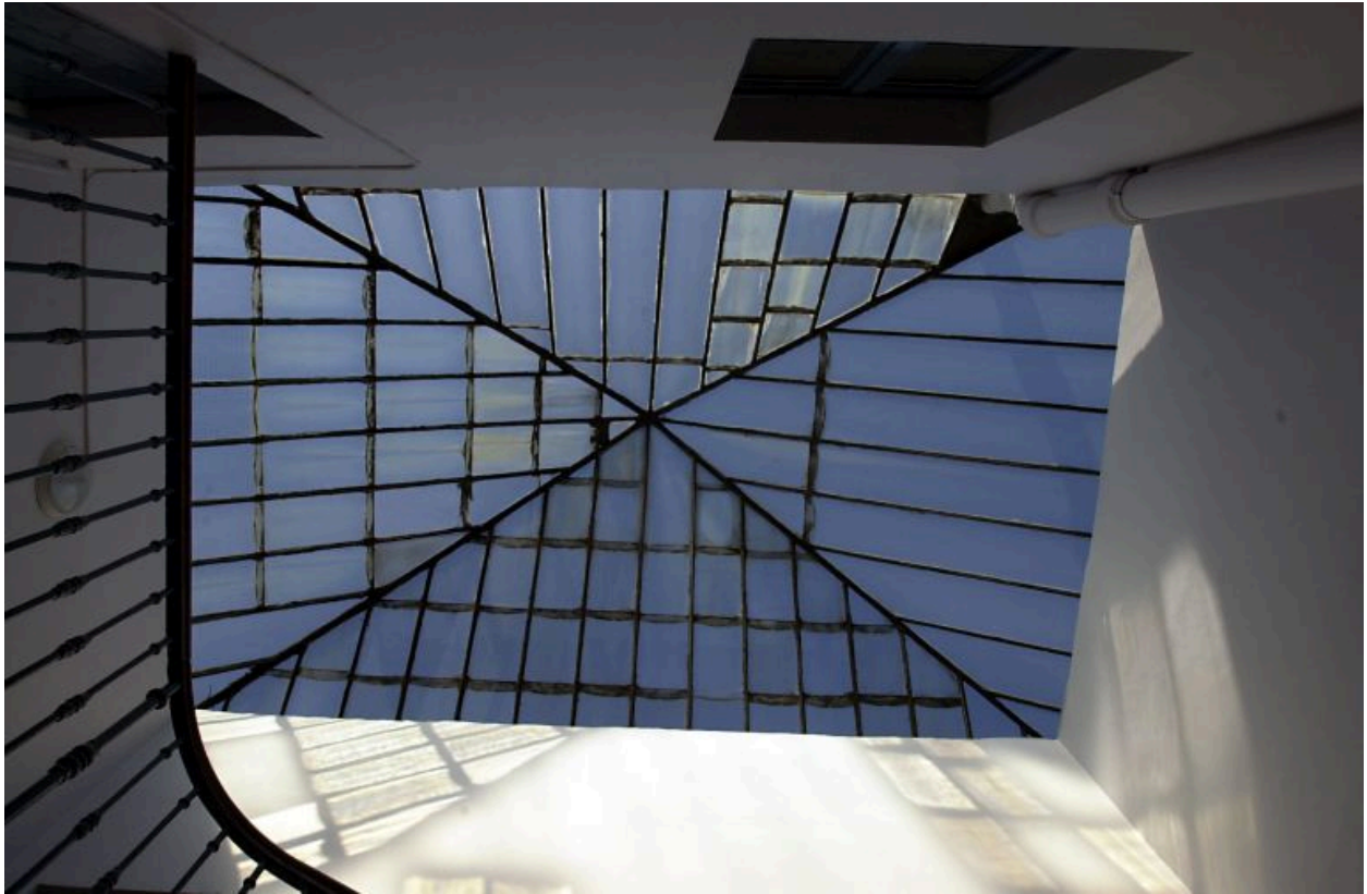
Esalier, verrière couonnant la cage