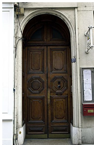
Façade principale, porte IVR82_20046900150NUCA