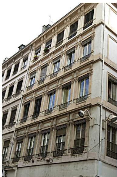
Façade principale, élévation des étages carrés IVR82_20046900151NUCA