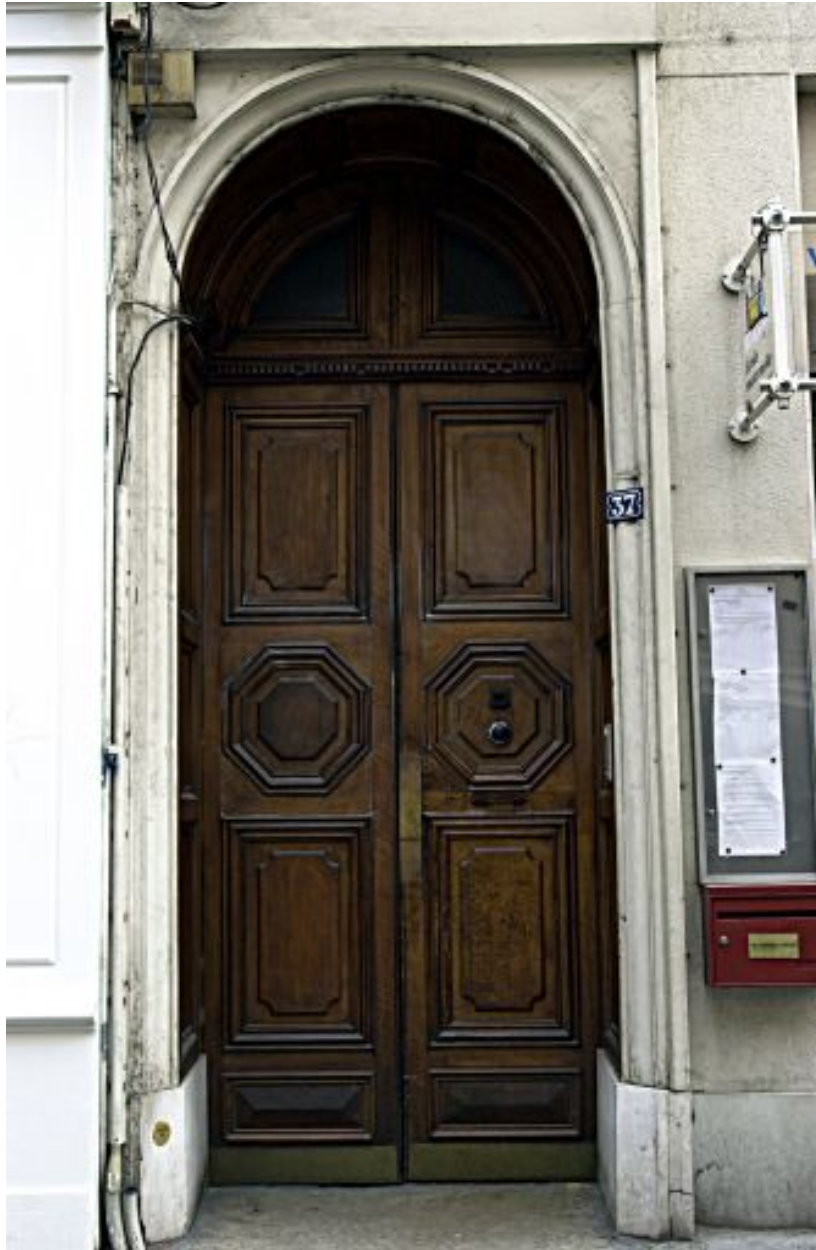
Façade principale, porte