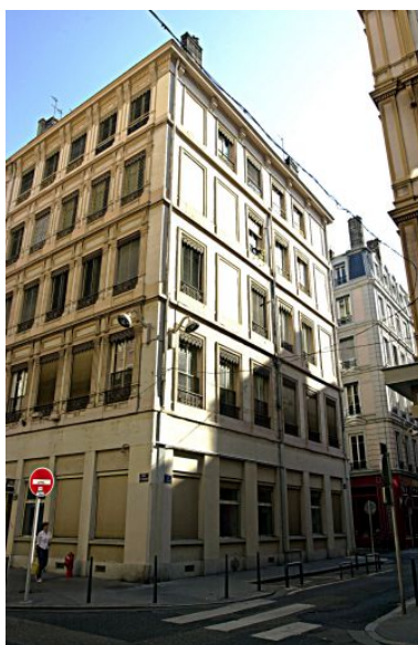
Façade sur la rue Longue