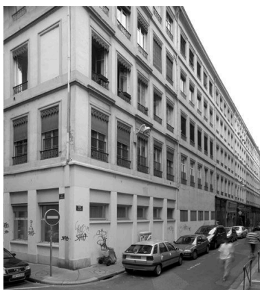
Façade sur la rue Pléney