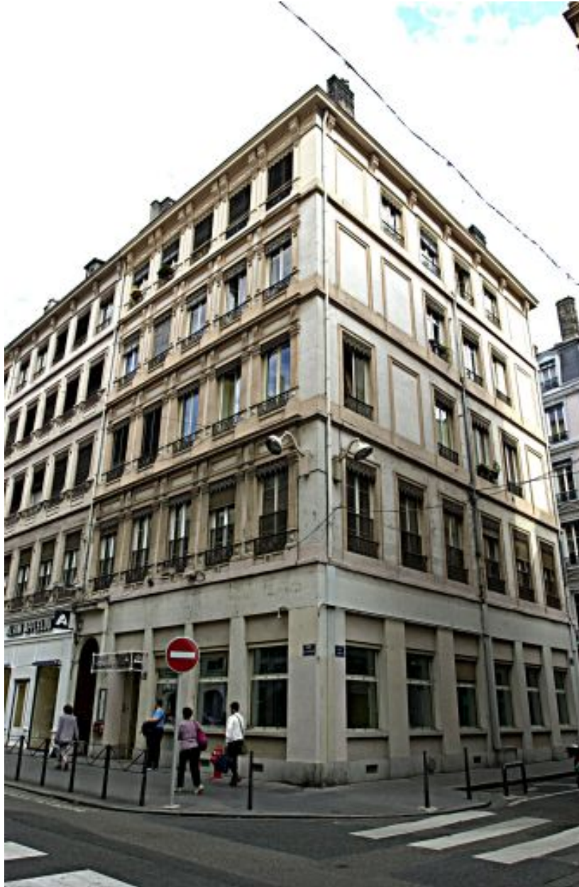
Vue générale des façades sur les rues Paul-Chenavard et Longue