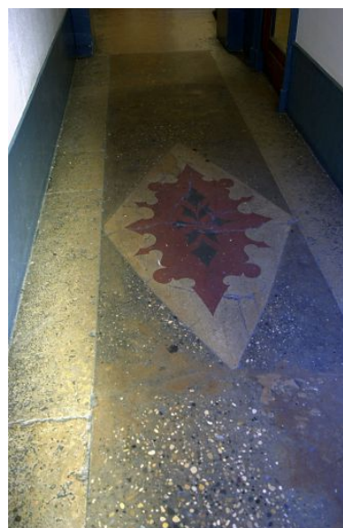
Sol de l'allée