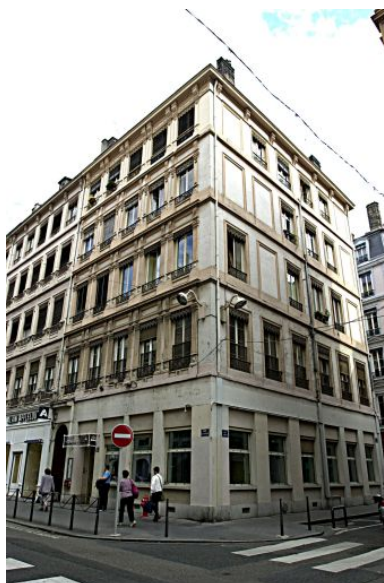
Vue générale des façades sur les rues Paul-Chenavard et Longue