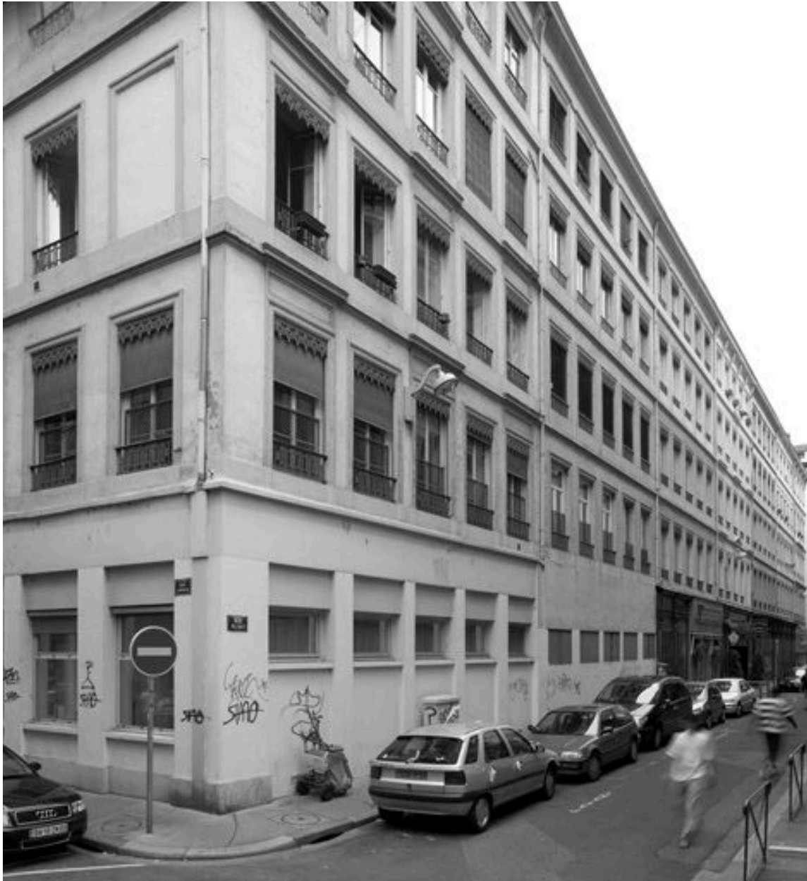
Façade sur la rue Pléney