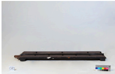
Section d'une maquette de rail IVR84_20256901112NUCA