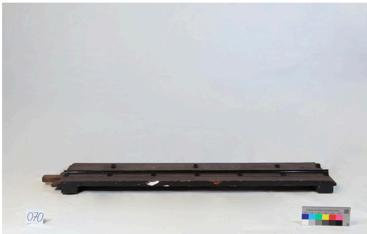
Section d'une maquette de rail