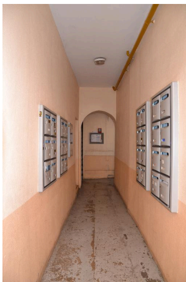
Entrée IVR82_20156900226NUCA