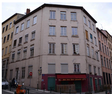
Vue d'ensemble IVR82_20156900087NUCA