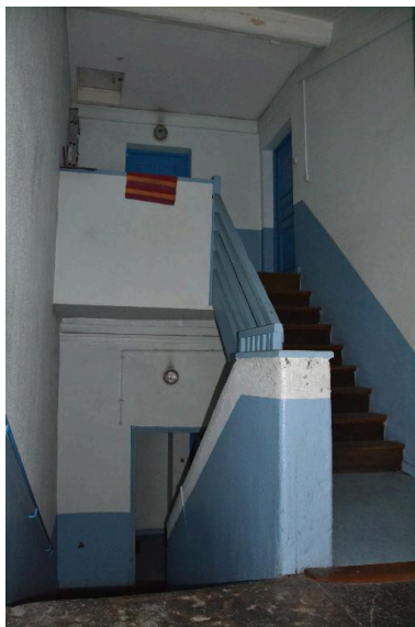
Escalier dernier niveau IVR82_20156900230NUCA