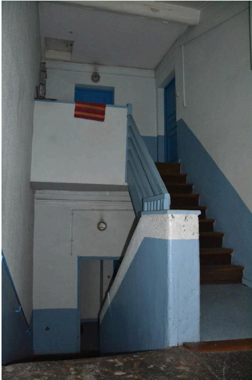
Escalier dernier niveau