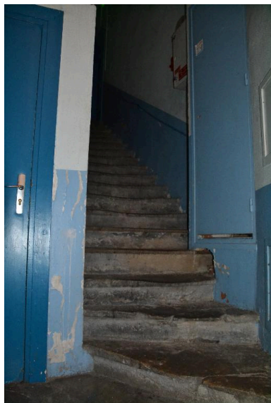
Départ escalier IVR82_20156900229NUCA