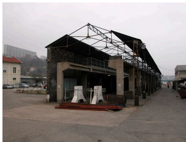
Vue générale depuis le sud est IVR82_20046902188NUCA