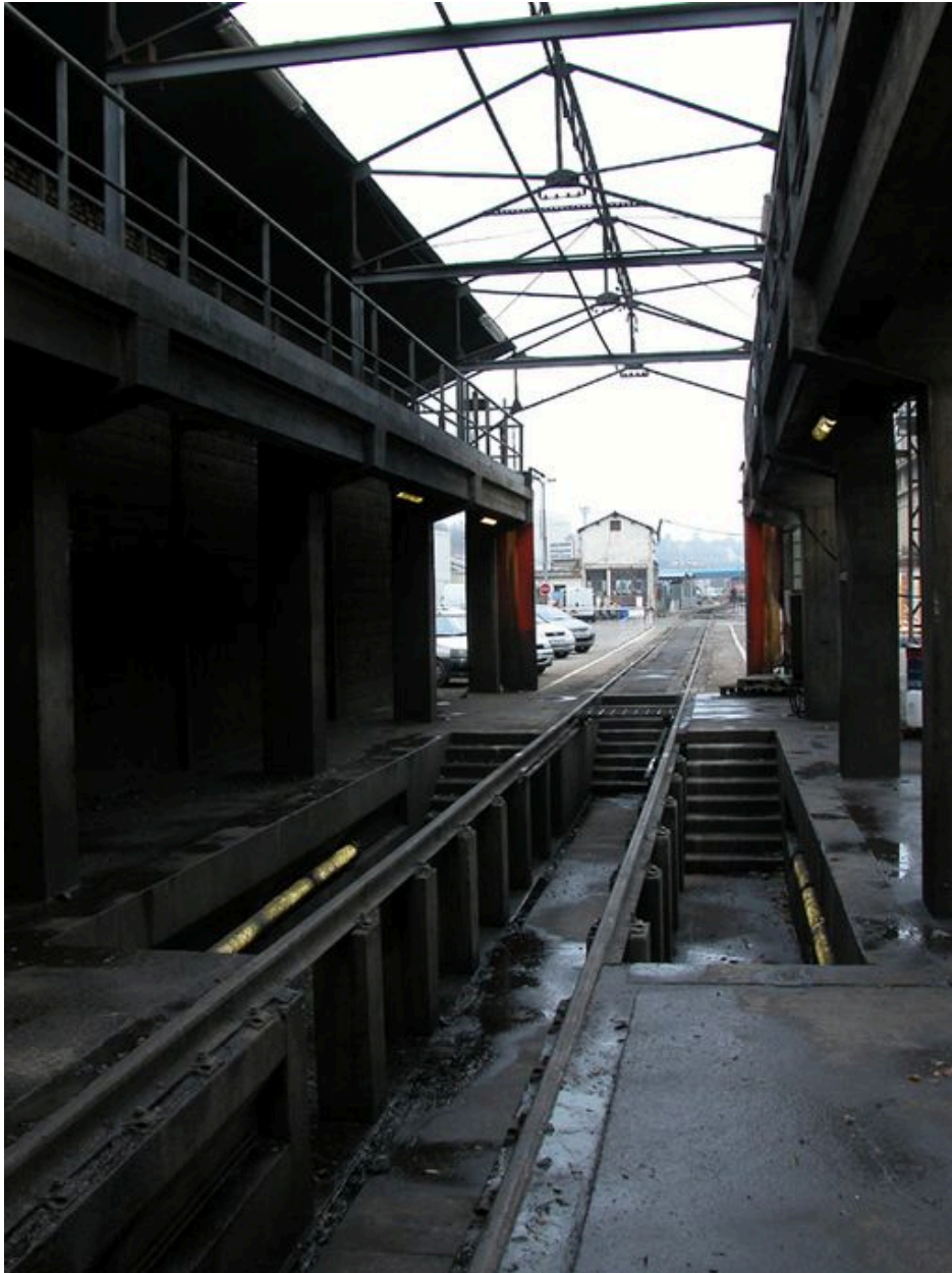
Vue intérieure depuis le sud