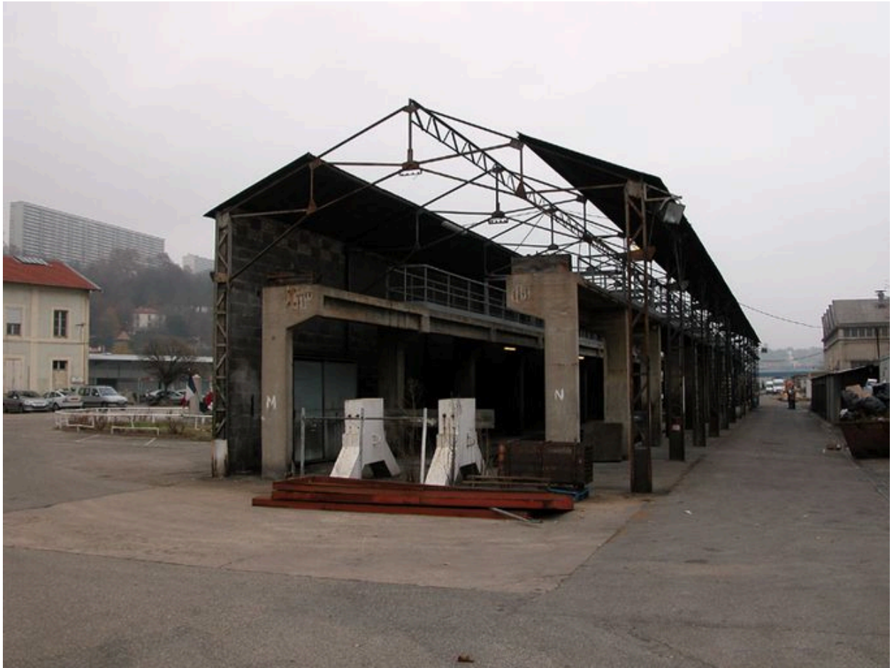
Vue générale depuis le sud est