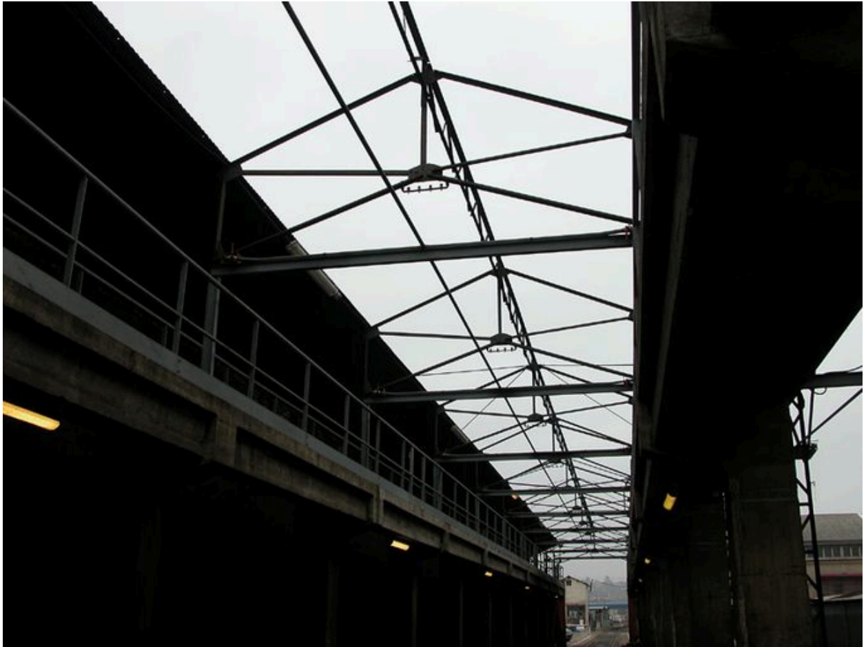
Détail de la charpente et des galeries de circulation