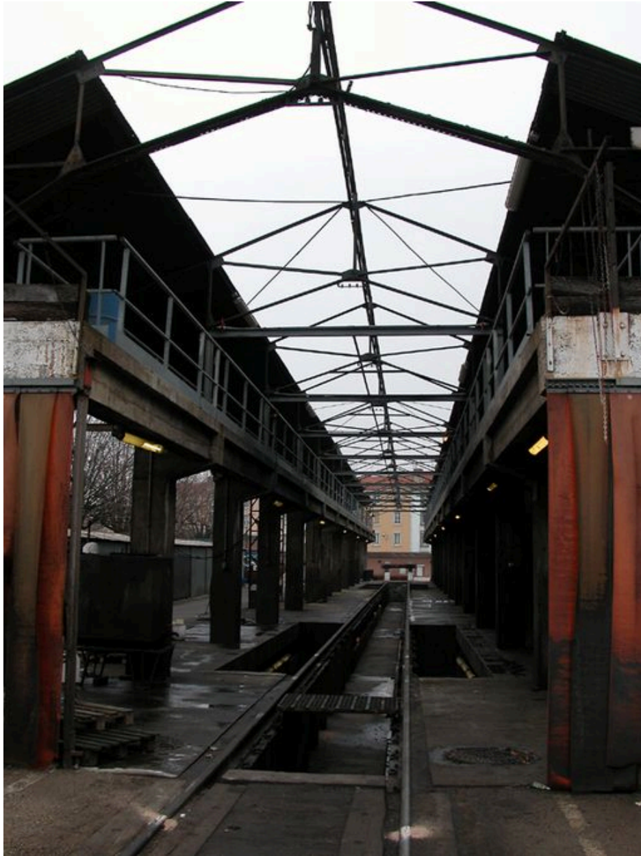
Vue intérieure depuis le nord