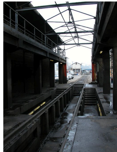
Vue intérieure depuis le sud IVR82_20046902189NUCA