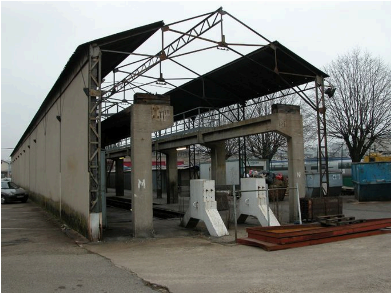
Vue générale depuis le sud ouest