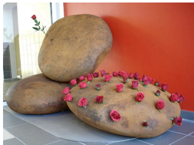
Une partie de l'œuvre installée, en 2013