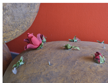
Détail de l'oeuvre en 2022 IVR84_20222600003NUCA