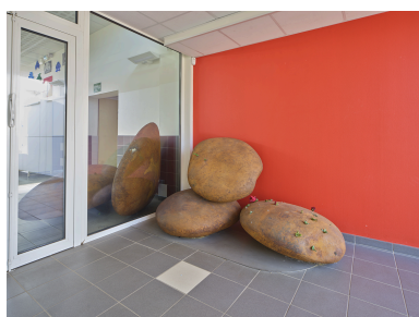
Vue d'ensemble en 2022 IVR84_20222600001NUCA