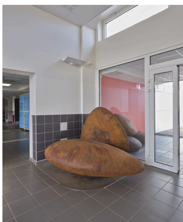
Autre vue d'ensemble en 2022 IVR84_20222600002NUCA