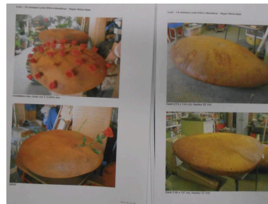
Oeuvre en cours d'installation, 2013 IVR84_20202600028NUCAB