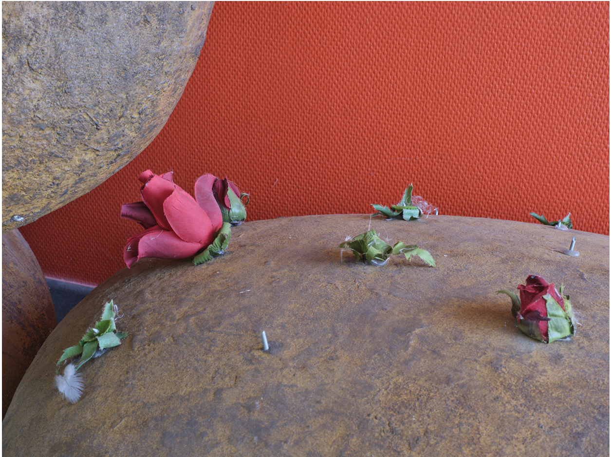
Détail de l'oeuvre en 2022