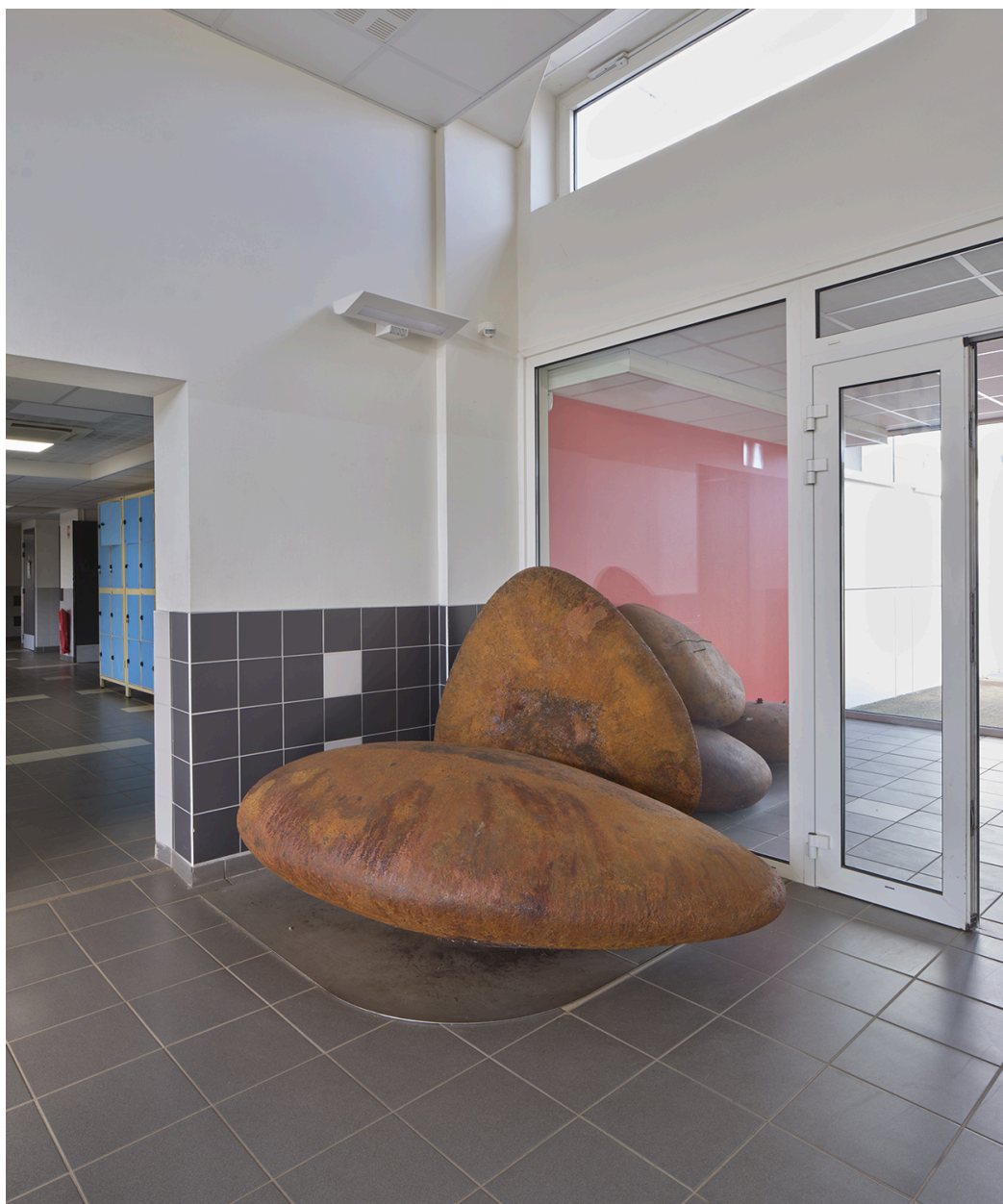
Autre vue d'ensemble en 2022