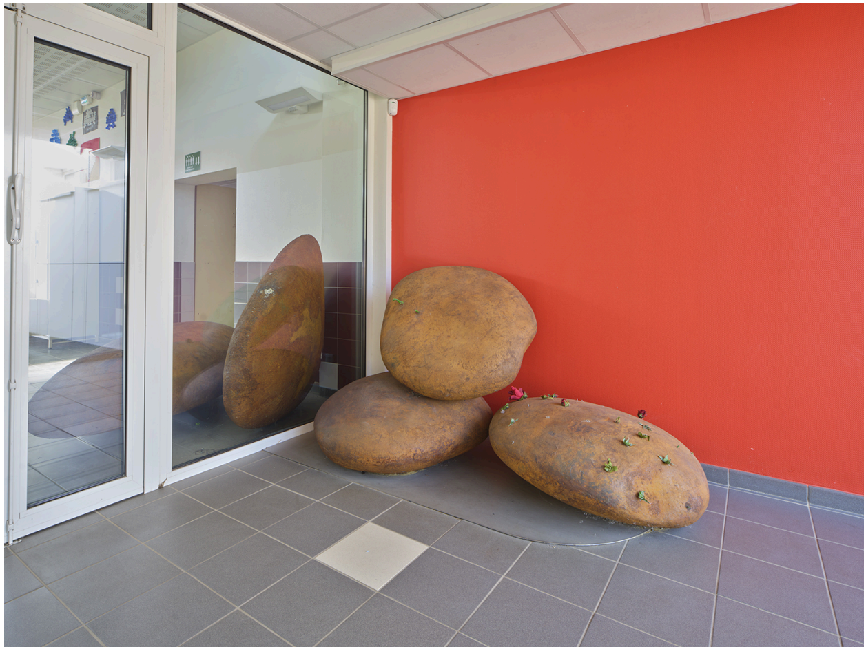
Vue d'ensemble en 2022