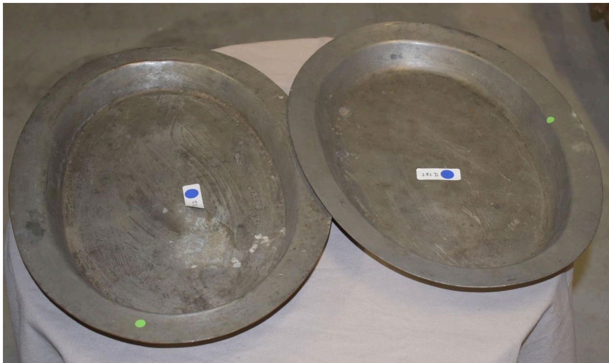
Vue de l'ensemble