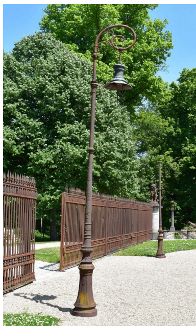
Vue générale IVR84_20226300812NUCA