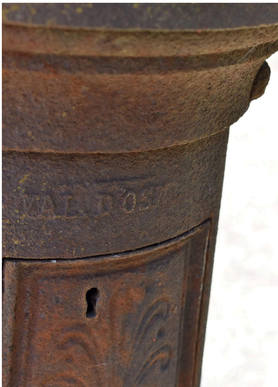
Détail inscription fondeur