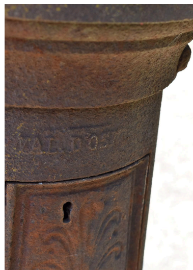
Détail inscription fondeur IVR84_20226300814NUCA