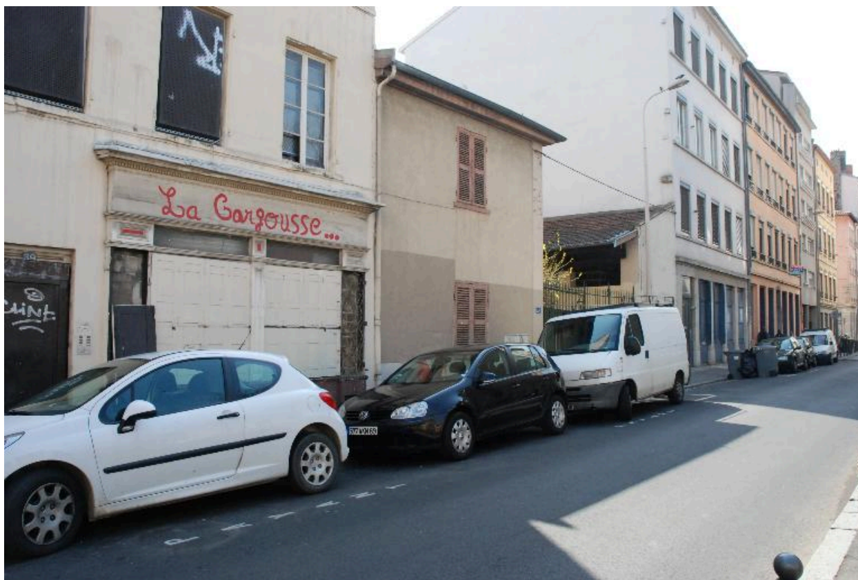
Bâtiments démolis (état 2012)