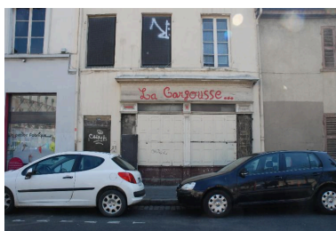
Local de la coopérative d'habitants "La Gargousse" (état 2012) IVR82_20136900105NUCA