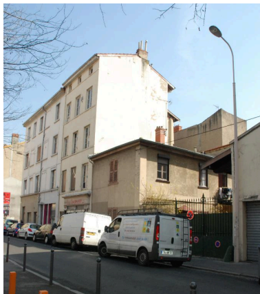
Immeuble et maison démolis (vue prise en 2012)