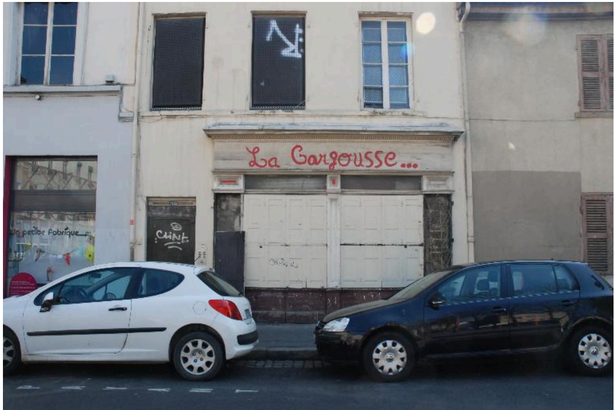
Local de la coopérative d'habitants "La Gargousse" (état 2012)