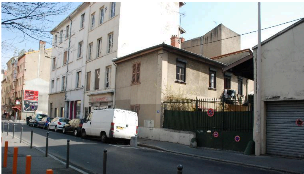
Maison démolie, au 41 rue Sébastien-Gryphe (vue prise en 2012)