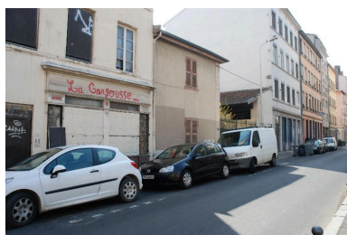
Bâtiments démolis (état 2012) IVR82_20136900106NUCA