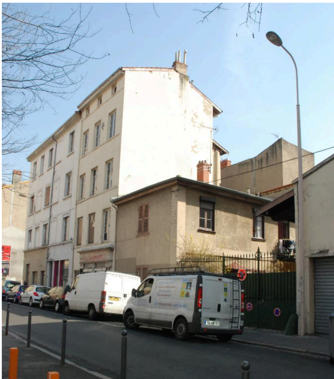
Immeuble et maison démolis (vue prise en 2012)