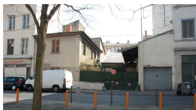
Maison démolie au 41 rue Sébastien- Gryphe (vue prise en 2012)