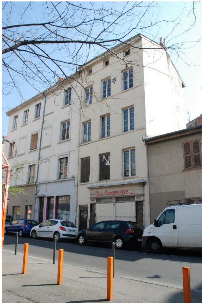
Immeuble démoli, au 39 rue Sébastien-Gryphe (vue prise en 2012)