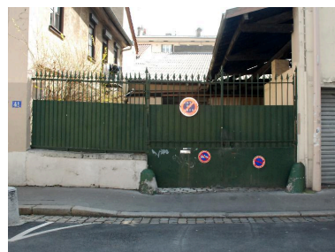
41 rue Sébastien- Gryphe, portail (état 2012) IVR82_20136900108NUCA