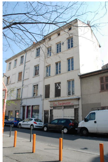
Immeuble démolit, au 39 rue Sébastien-Gryphe (vue prise en 2012) IVR82_20136900102NUCA