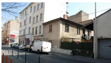
Maison démolie, au 41 rue Sébastien-Gryphe (vue prise en 2012) IVR82_20136900103NUCA