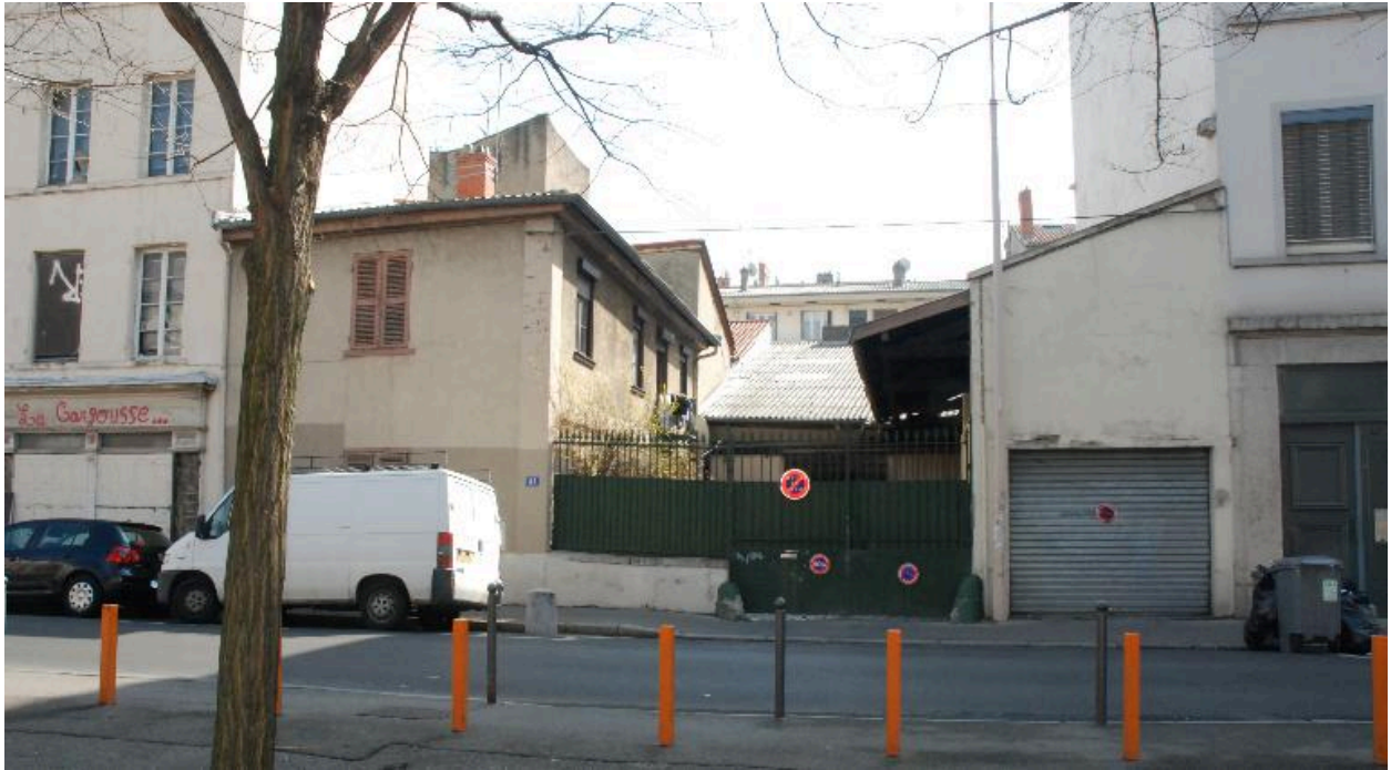
Maison démolie au 41 rue Sébastien-Gryphe (vue prise en 2012)