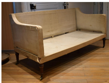
Vue générale IVR84_20226301107NUC4A