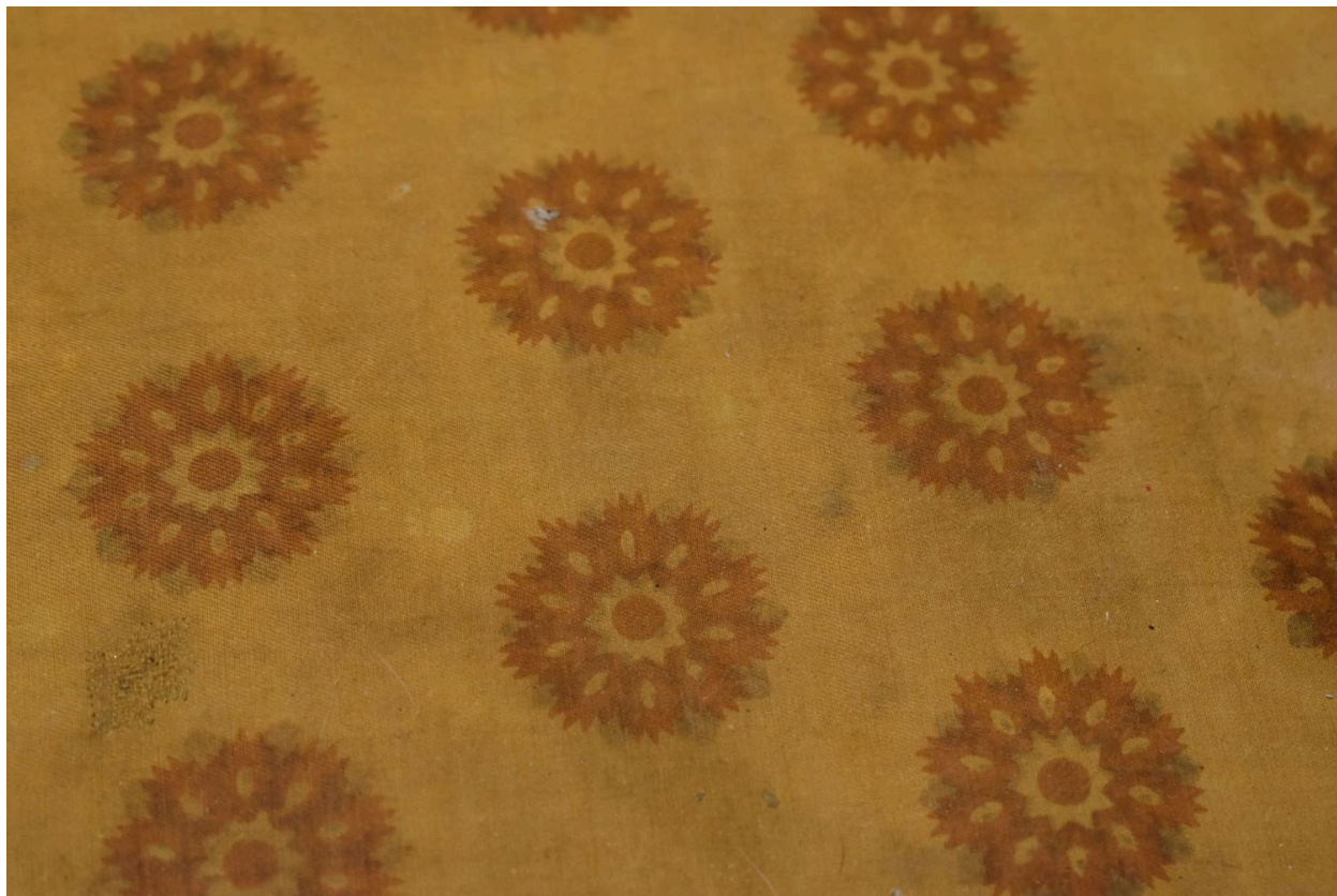
Détail du tissu d'assise