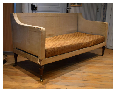
Vue générale, avec le coussin d'assise IVR84_20226301111NUC4A