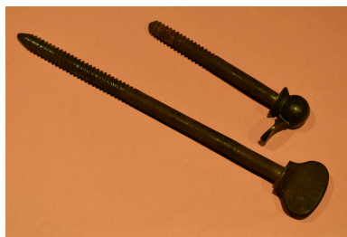
Vue de détail des éléments de visserie IVR84_20226301123NUC4A