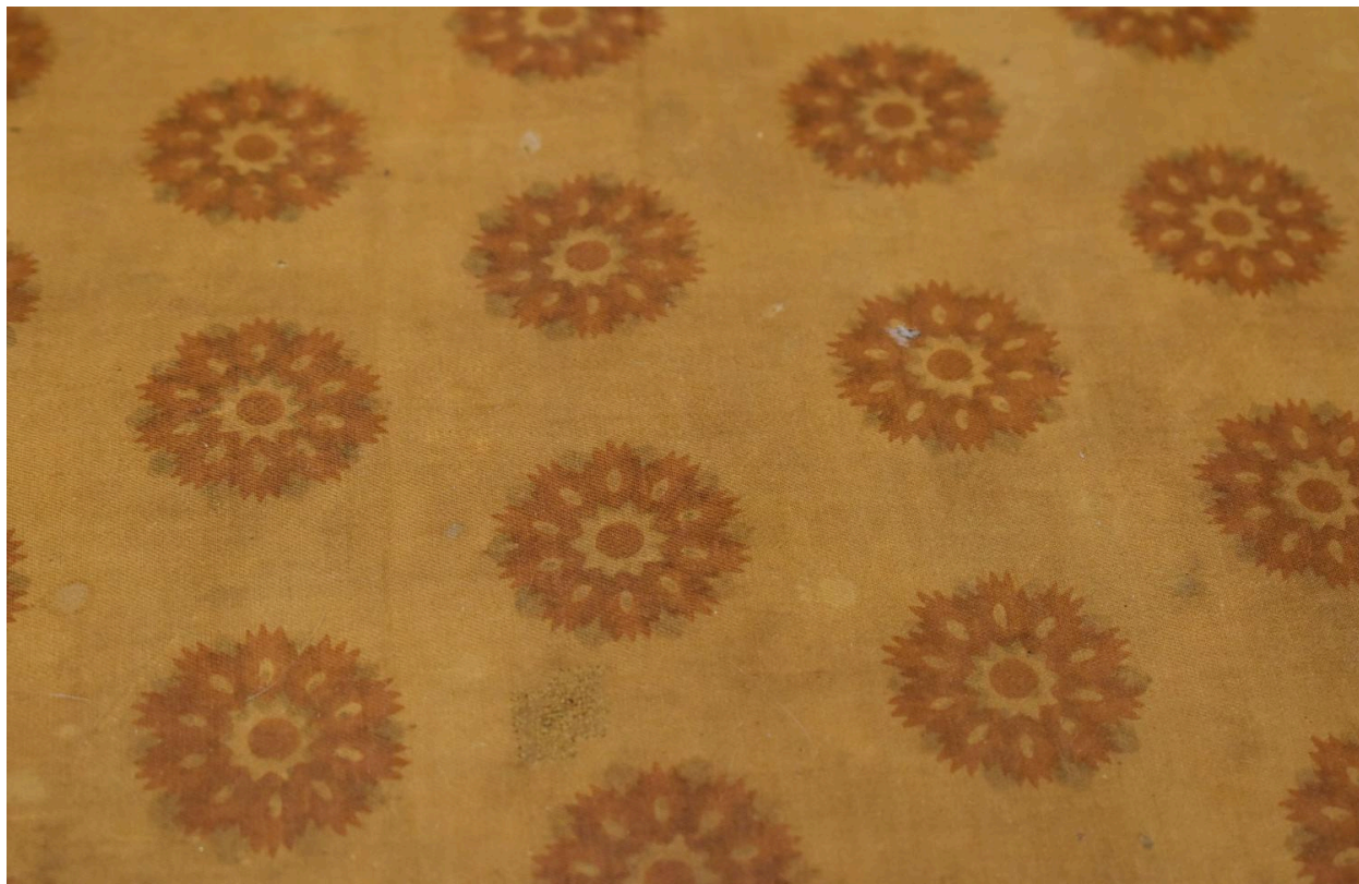
Détail du tissu de l'assise