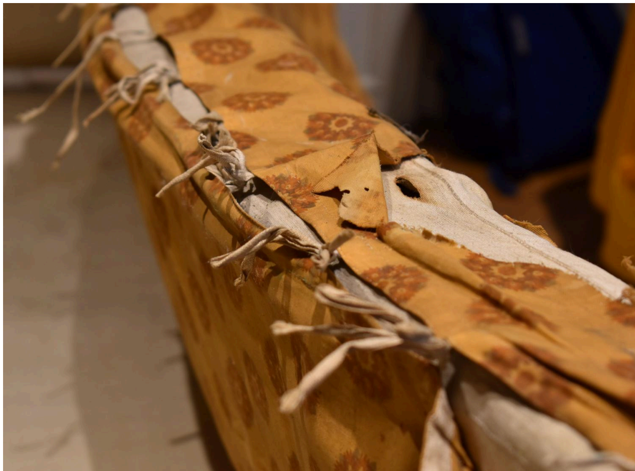
Vue de détail de l'accroche du tissu d'assise