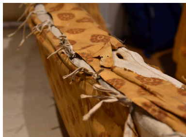
Vue de détail de l'accroche du tissu d'assise IVR84_20226301116NUC4A