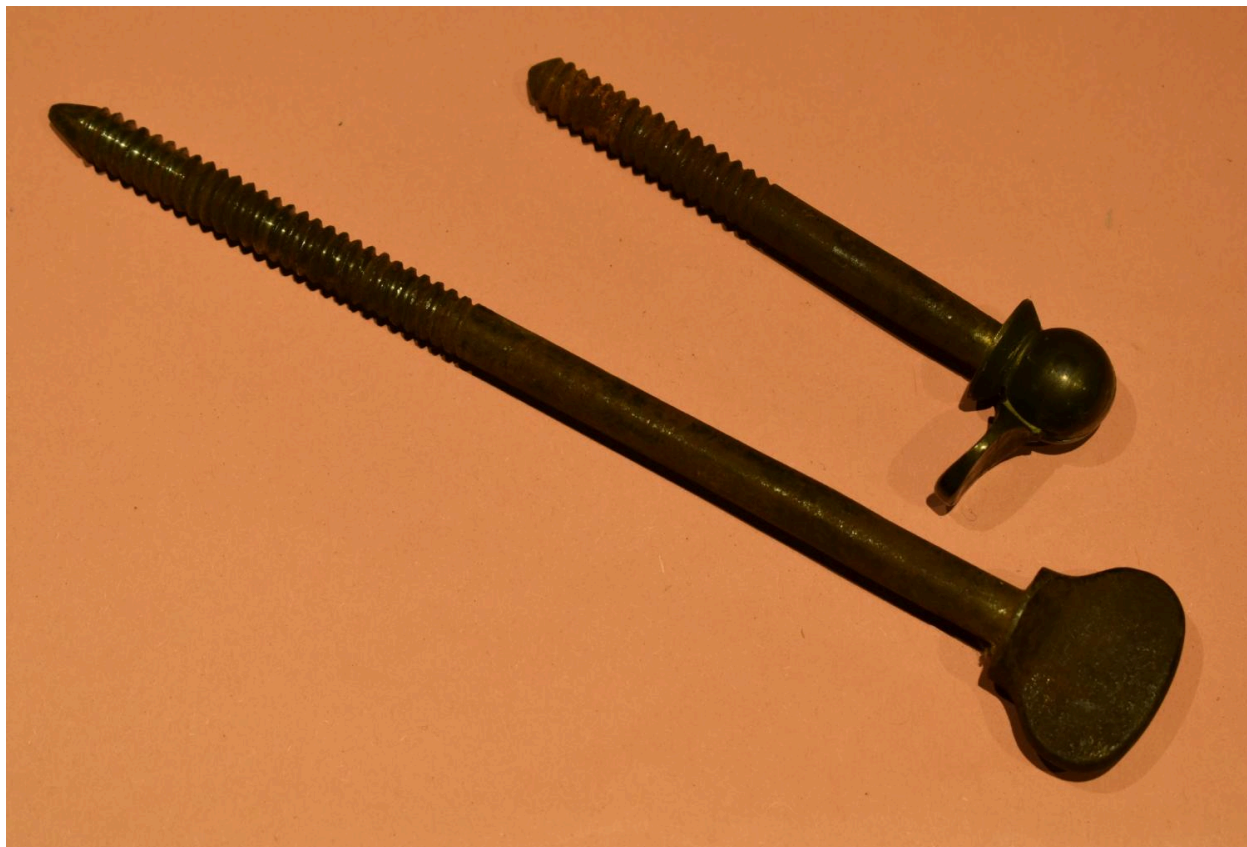
Vue de détail des éléments de visserie