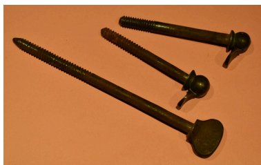
Détail des éléments de visserie IVR84_20226301124NUC4A