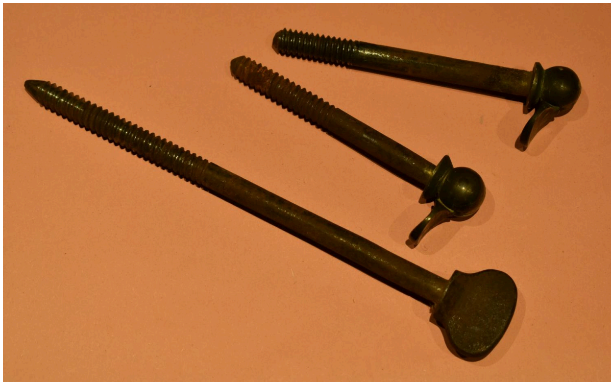
Détail des éléments de visserie