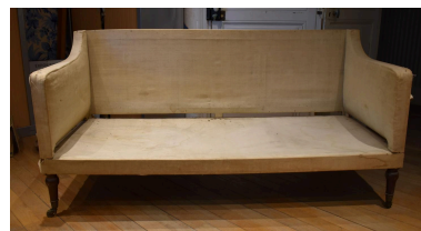
Vue générale IVR84_20226301108NUC4A