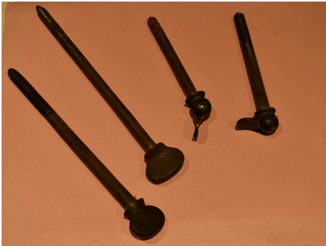
Vue générale des éléments de visserie