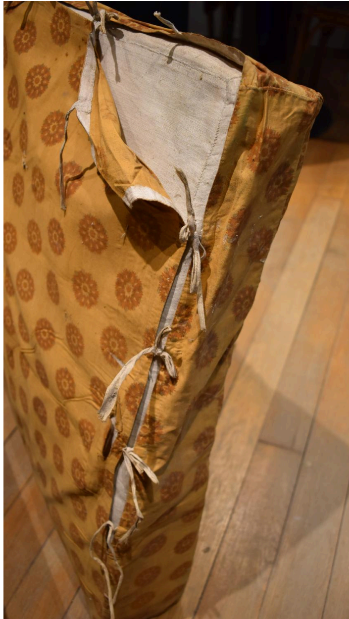
Vue de détail de l'accroche du tissu d'assise