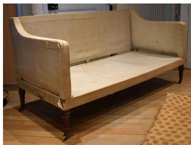
Vue générale IVR84_20226301106NUC4A