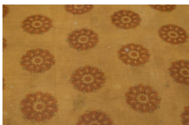
Détail du tissu de l'assise IVR84_20226301113NUC4A