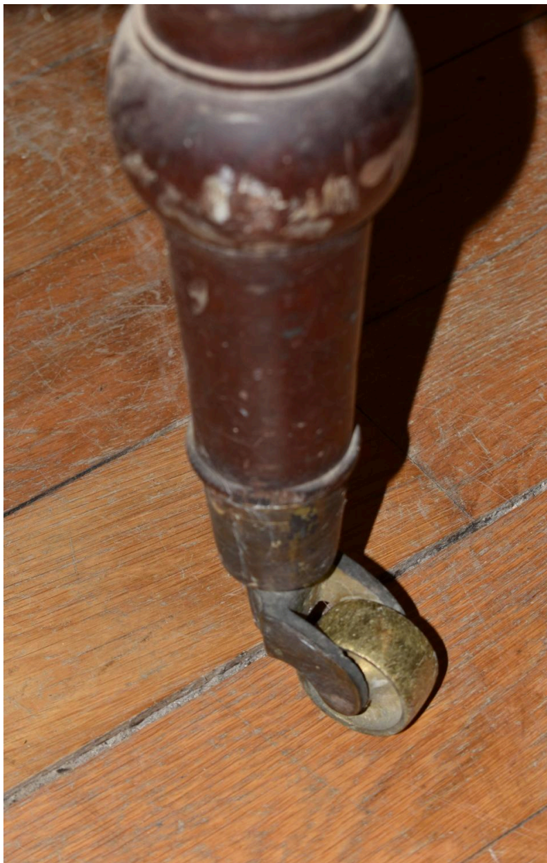
Vue générale d'un pied et de sa roulette