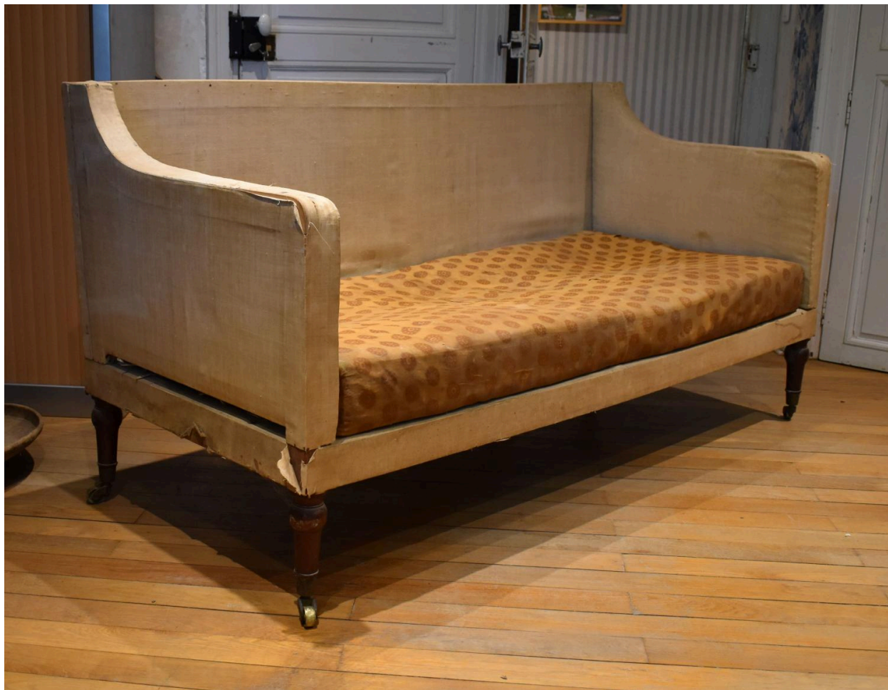
Vue générale, avec le coussin d'assise