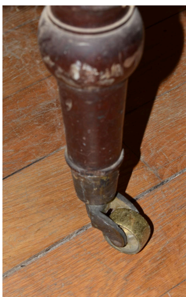
Vue générale d'un pied et de sa roulette