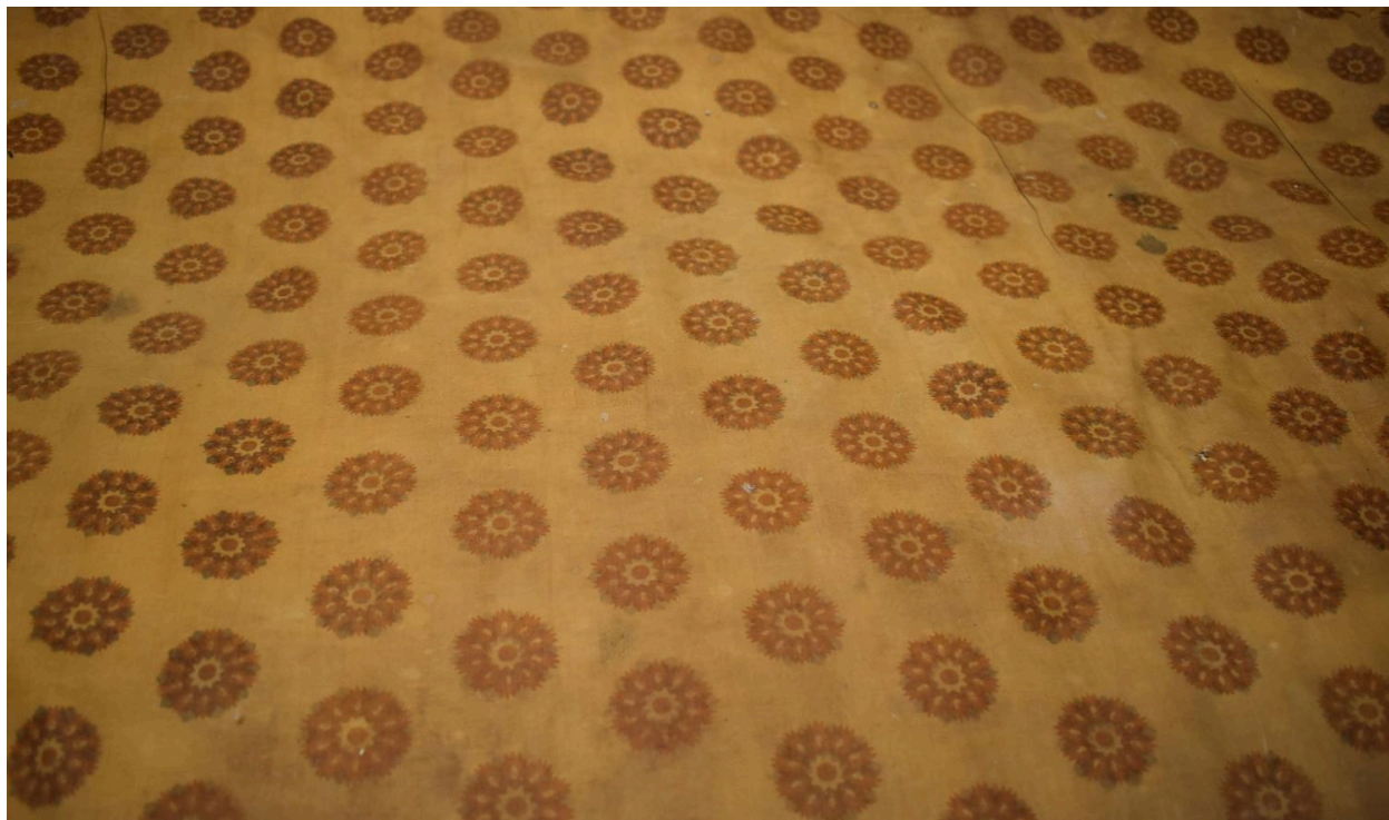
Détail du tissu de l'assise