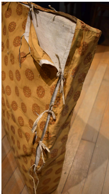
Vue de détail de l'accroche du tissu d'assise IVR84_20226301118NUC4A