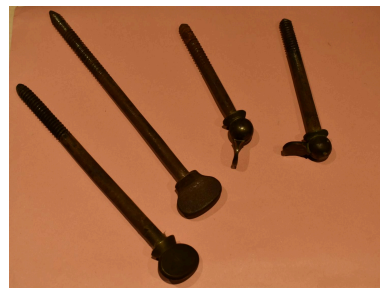
Vue générale des éléments de visserie IVR84_20226301120NUC4A