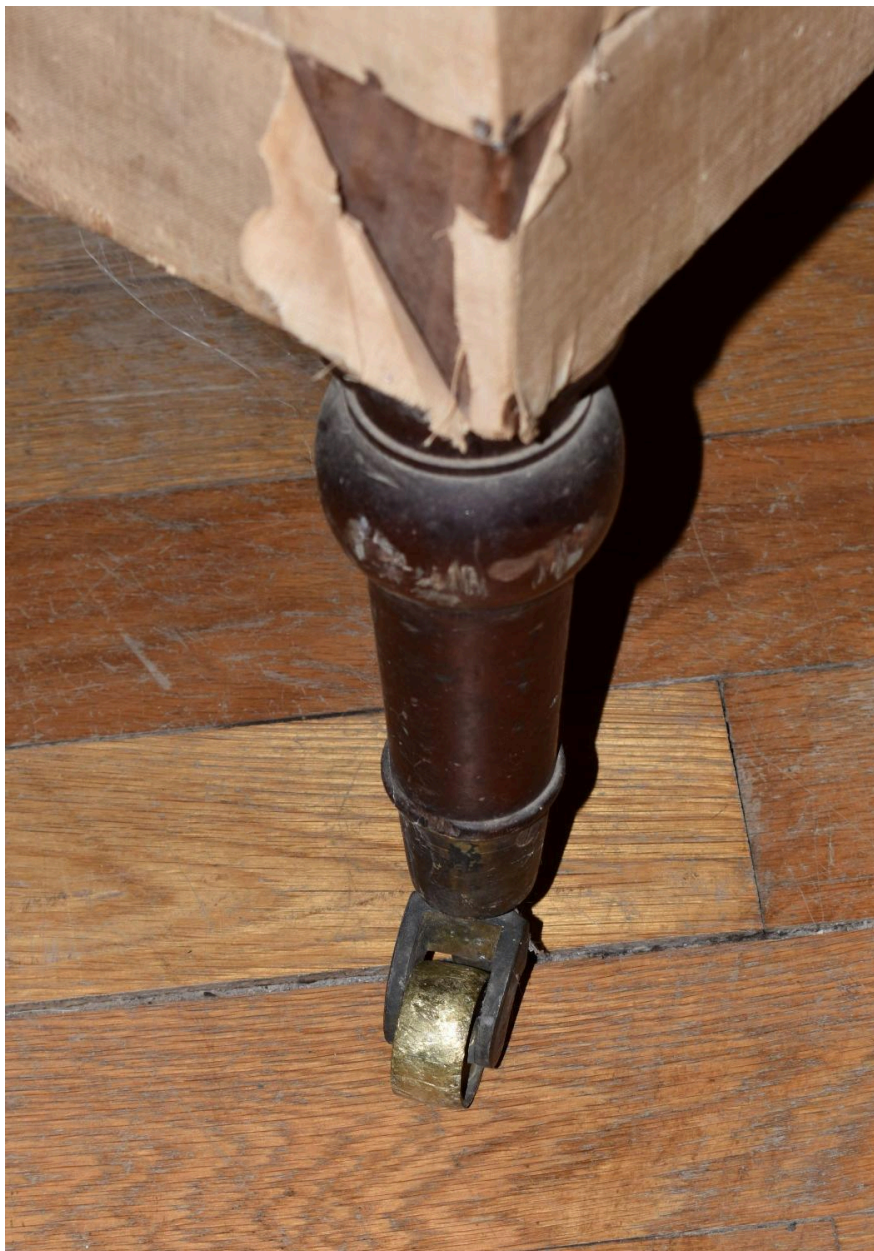
Détail du pied et de la roulette