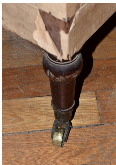
Détail du pied et de la roulette IVR84_20226301109NUC4A