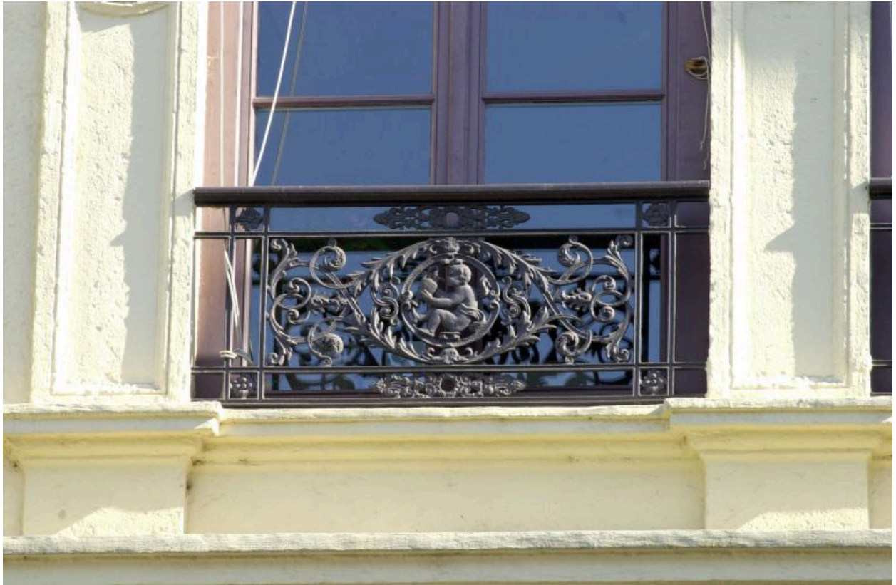
Façade principale place d'Albon, 3e niveau, détail de l'appui de la fenêtre de gauche