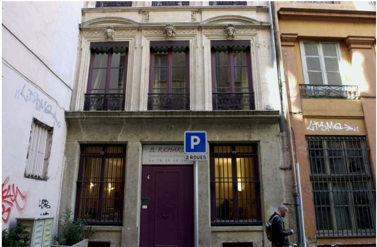
Façade rue Longue, rez-de-chaussée et 1er étage