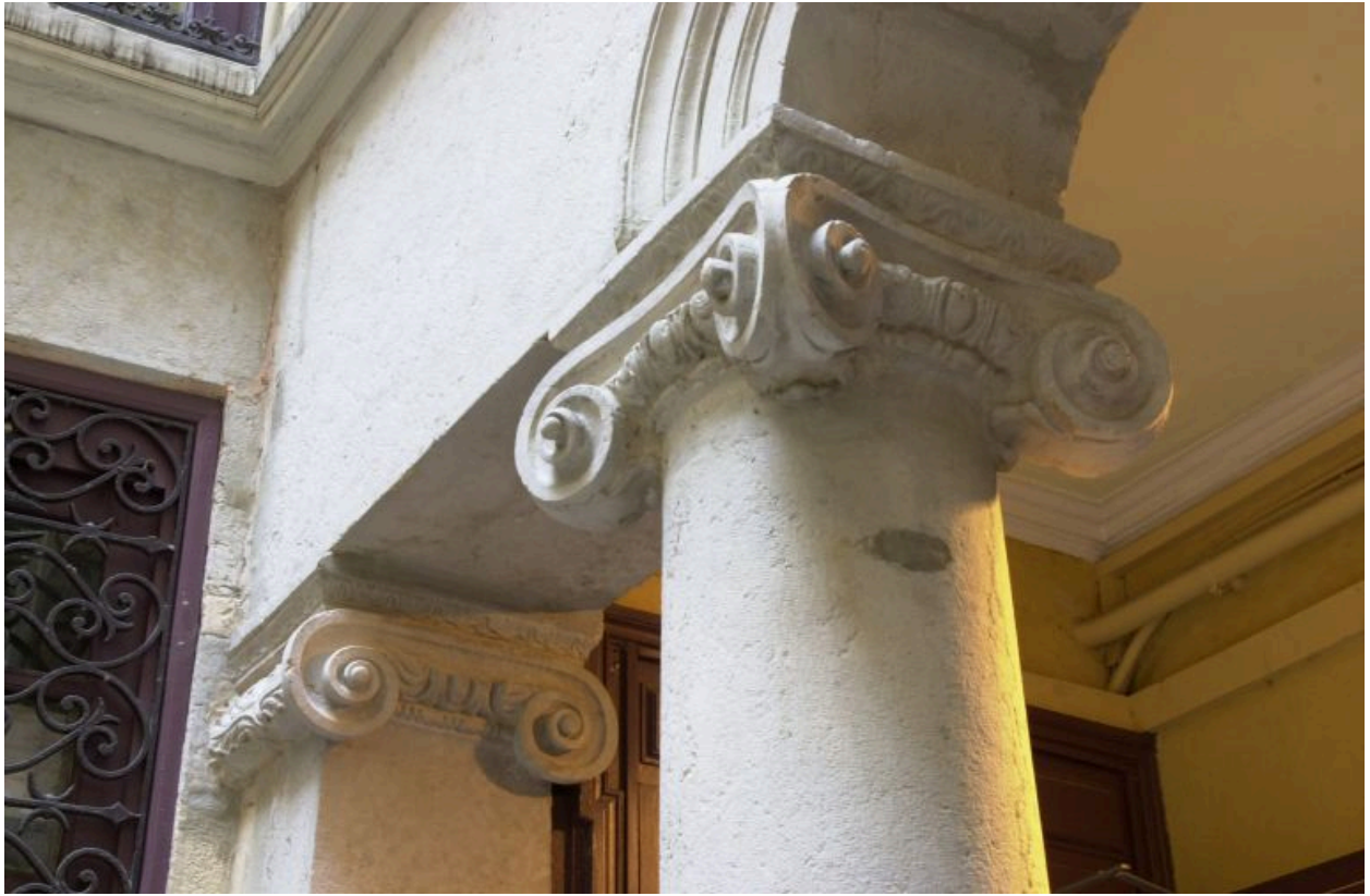
Corps de l'escalier, détail des chapiteaux du rez-de-chaussée