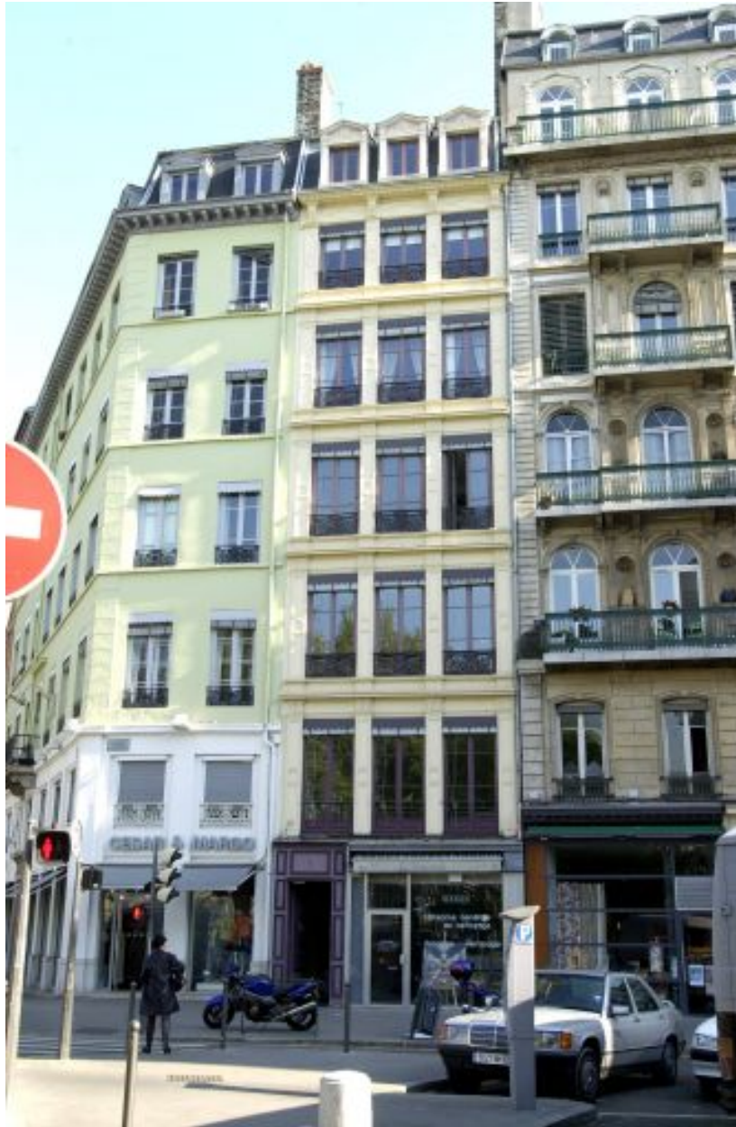
Façade principale sur la place d'Albon