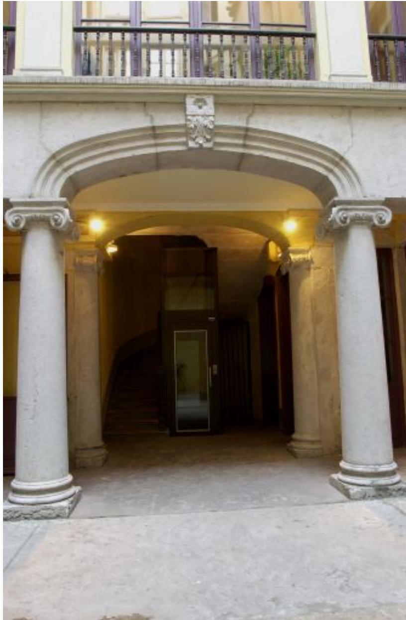
Corps de l'escalier, partie centrale du rez-de-chaussée