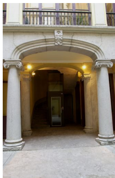
Corps de l'escalier, partie centrale du rez-de-chaussée