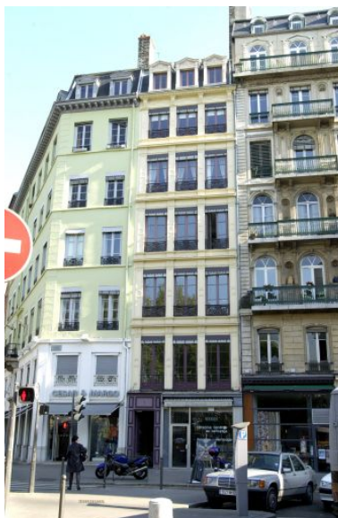
Façade principale sur la place d'Albon IVR82_20046900408NUCA