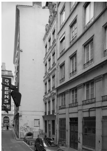
Façade sur la rue Longue, vue générale IVR82_20056900411NUC