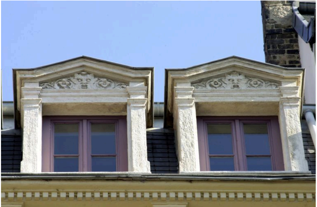
Façade principale place d'Albon, détail de 2 lucarnes