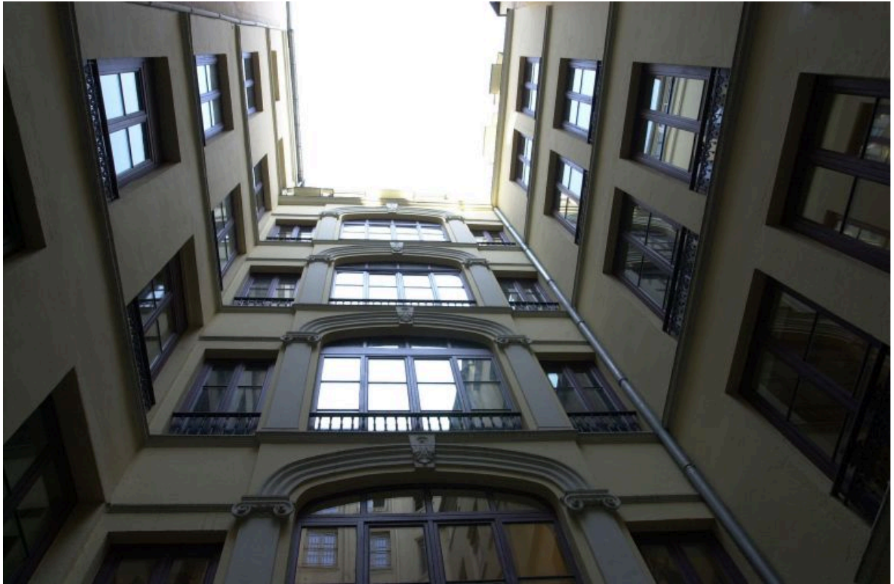
Vue générale des élévations sur cour