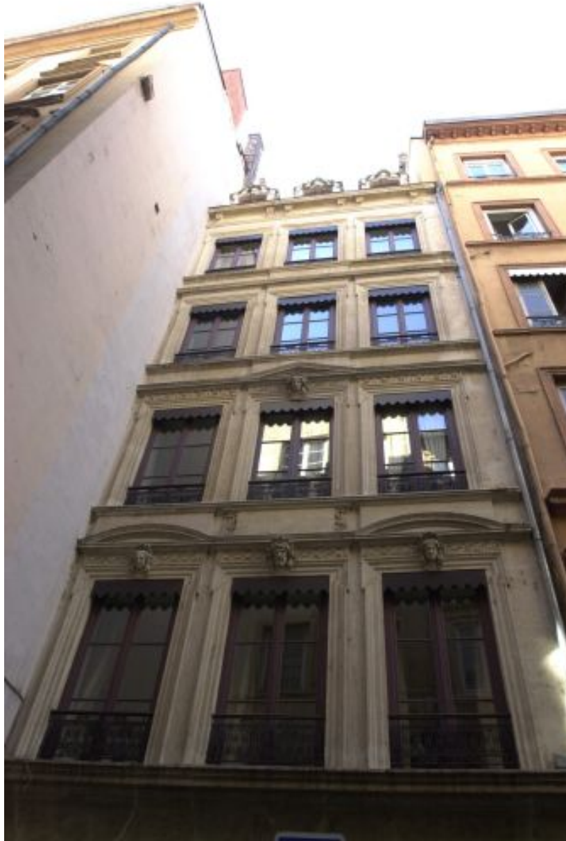
Façade rue Longue, vue générale par-dessous