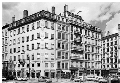
Vue générale des façades de l'îlot sur la place d'Albon