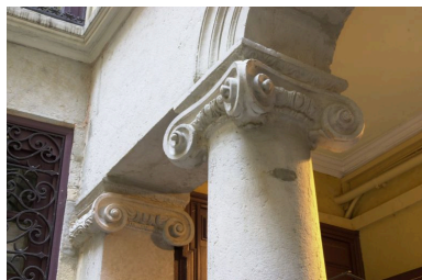
Corps de l'escalier, détail des chapiteaux du rez-de-chaussée IVR82_20046900418NUCA