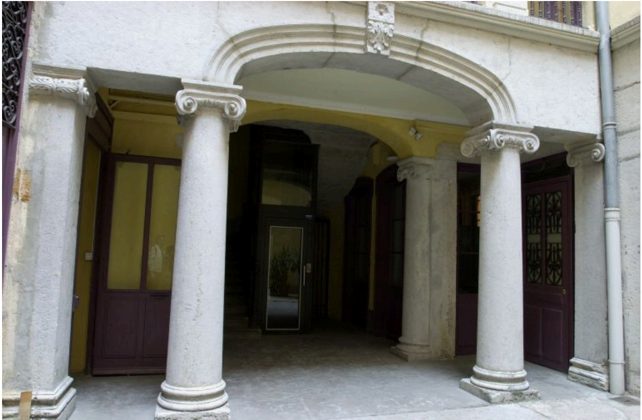
Corps de l'escalier, rez-de-chaussée