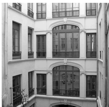
Elévations sur cour, niveaux 2 et 3 IVR82_20056901570NUC