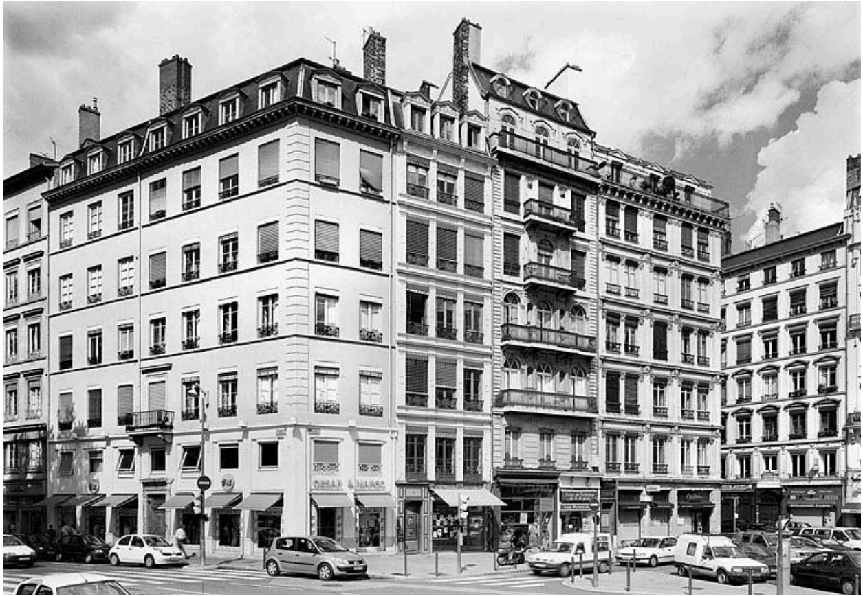
Vue générale des façades de l'îlot sur la place d'Albon