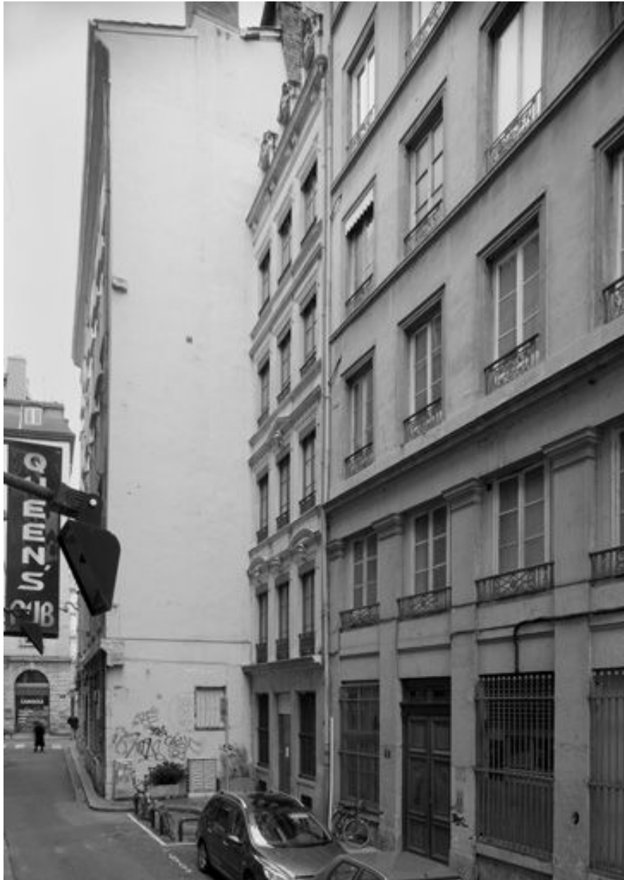
Façade sur la rue Longue, vue générale