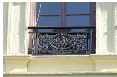
Façade principale place d'Albon, 3e niveau, détail de l'appui de la fenêtre de gauche IVR82_20046900409NUCA