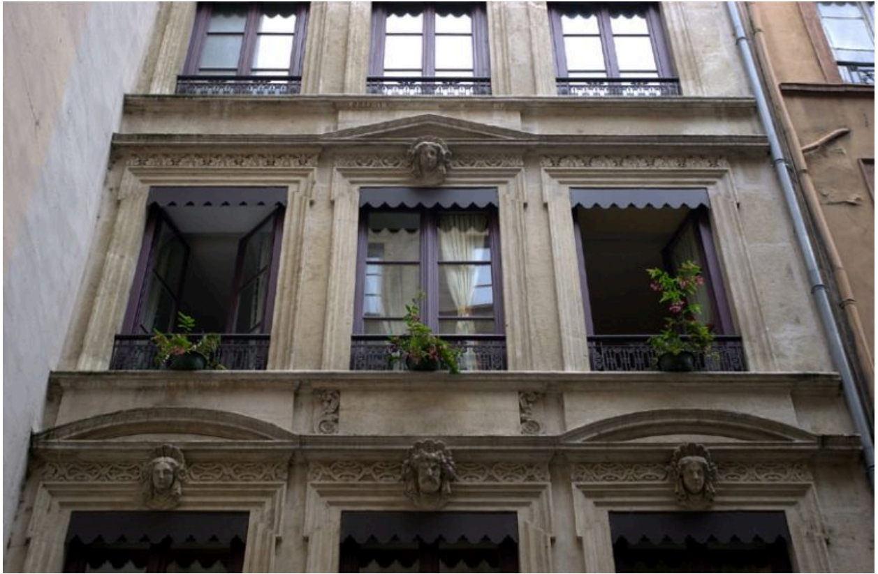
Façade rue Longue, détail des fenêtres des 1er et 2e étages