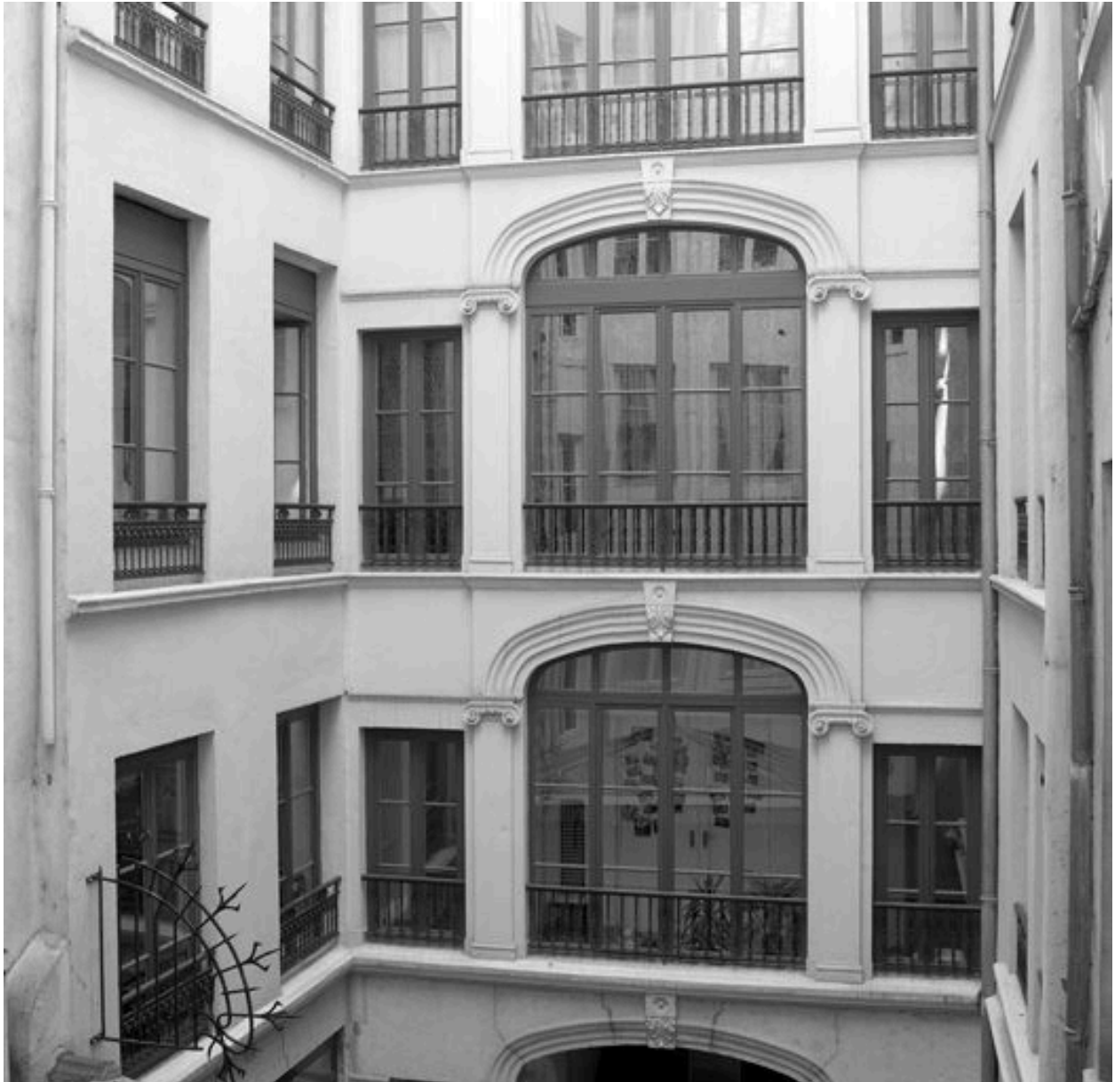
Elévations sur cour, niveaux 2 et 3