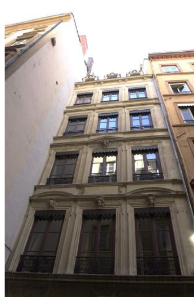
Façade rue Longue, vue générale par-dessous IVR82_20046900412NUCA