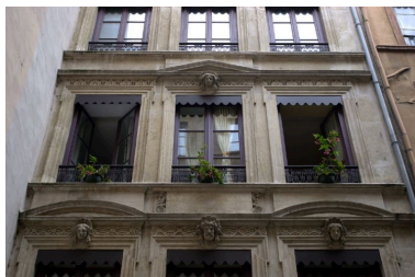
Façade rue Longue, détail des fenêtres des 1er et 2e étages IVR82_20046900414NUCA