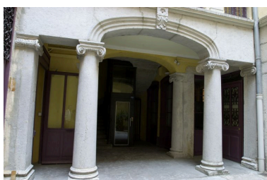
Corps de l'escalier, rez-de-chaussée IVR82_20046900416NUCA