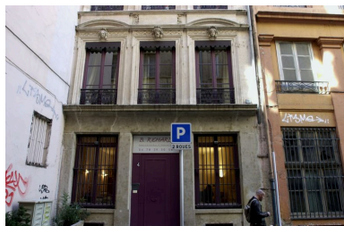
Façade rue Longue, rez- de-chaussée et 1er étage