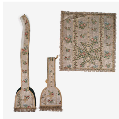
Vue générale de l'étole, du manipule et du voile de calice