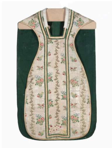
Vue générale du devant de la chasuble