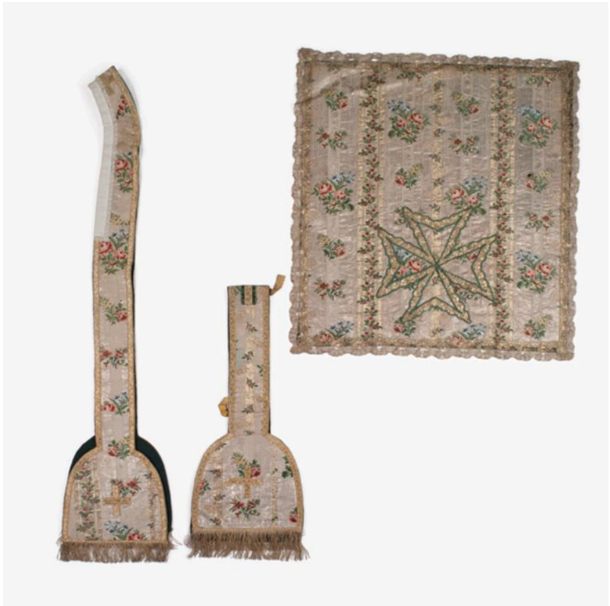
Vue générale de l'étole, du manipule et du voile de calice