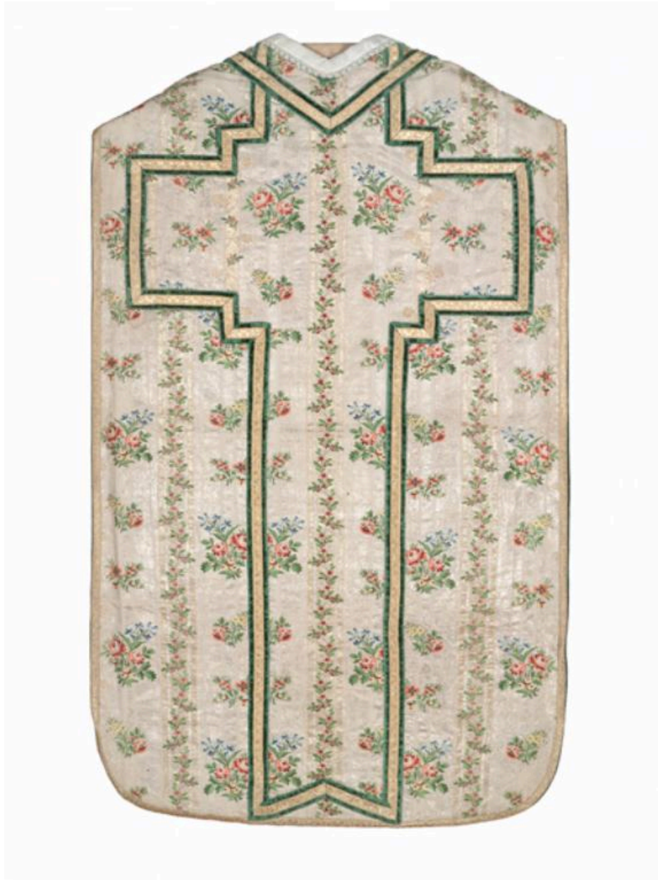
Vue générale du dos de la chasuble