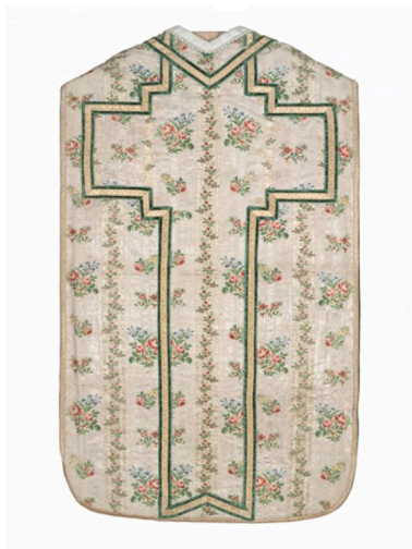
Vue générale du dos de la chasuble