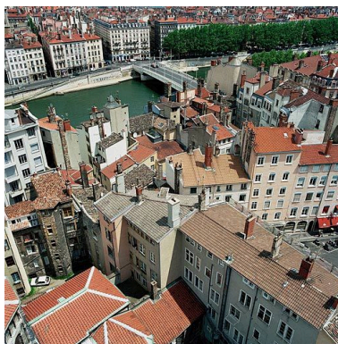
Anciens immeubles canoniaux vus depuis le clocher de l'église IVR82_20046901195XE