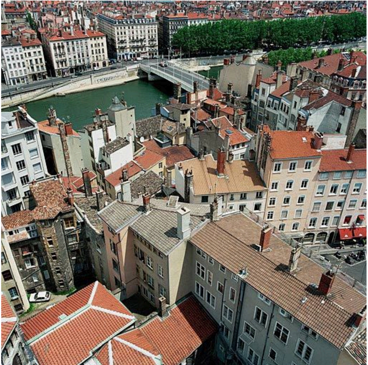
Anciens immeubles canoniaux vus depuis le clocher de l'église