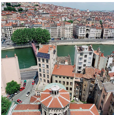
Anciens immeubles canoniaux vus depuis le clocher de l'église