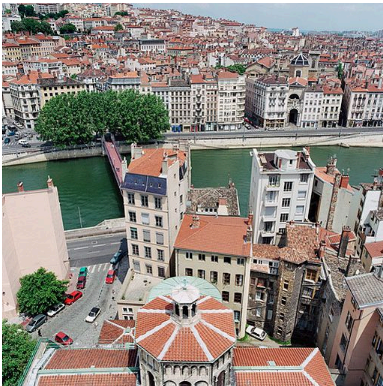
Anciens immeubles canoniaux vus depuis le clocher de l'église