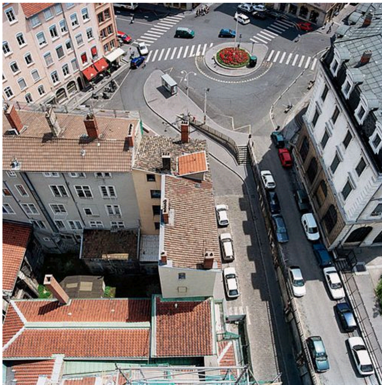
Anciens immeubles canoniaux vus depuis le clocher de l'église