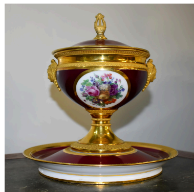
Sucrier IVR84_20256300904NUCA