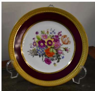
Assiette IVR84_20256300901NUCA