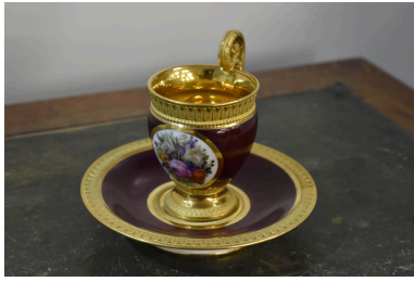
Tasse et soucoupe IVR84_20256300910NUCA