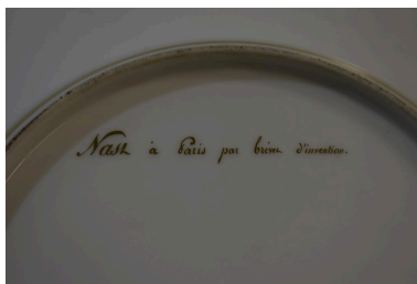
Détail des inscriptions au dos des pièces IVR84_20256300903NUCA