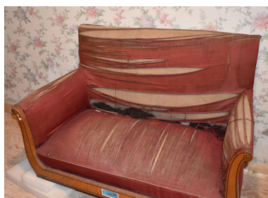
Vue générale du canapé n°1 IVR84_20216301496NUC4A