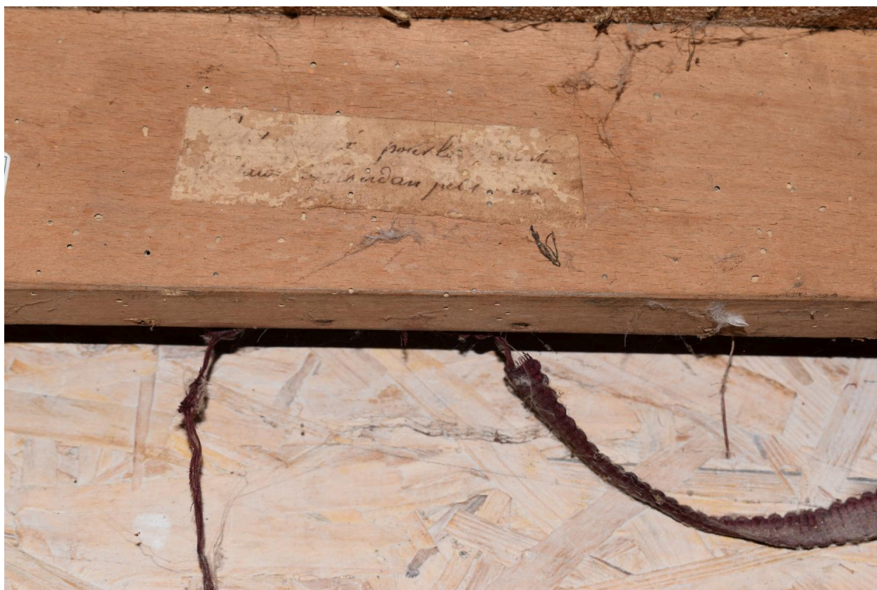
Etiquette du canapé n°1