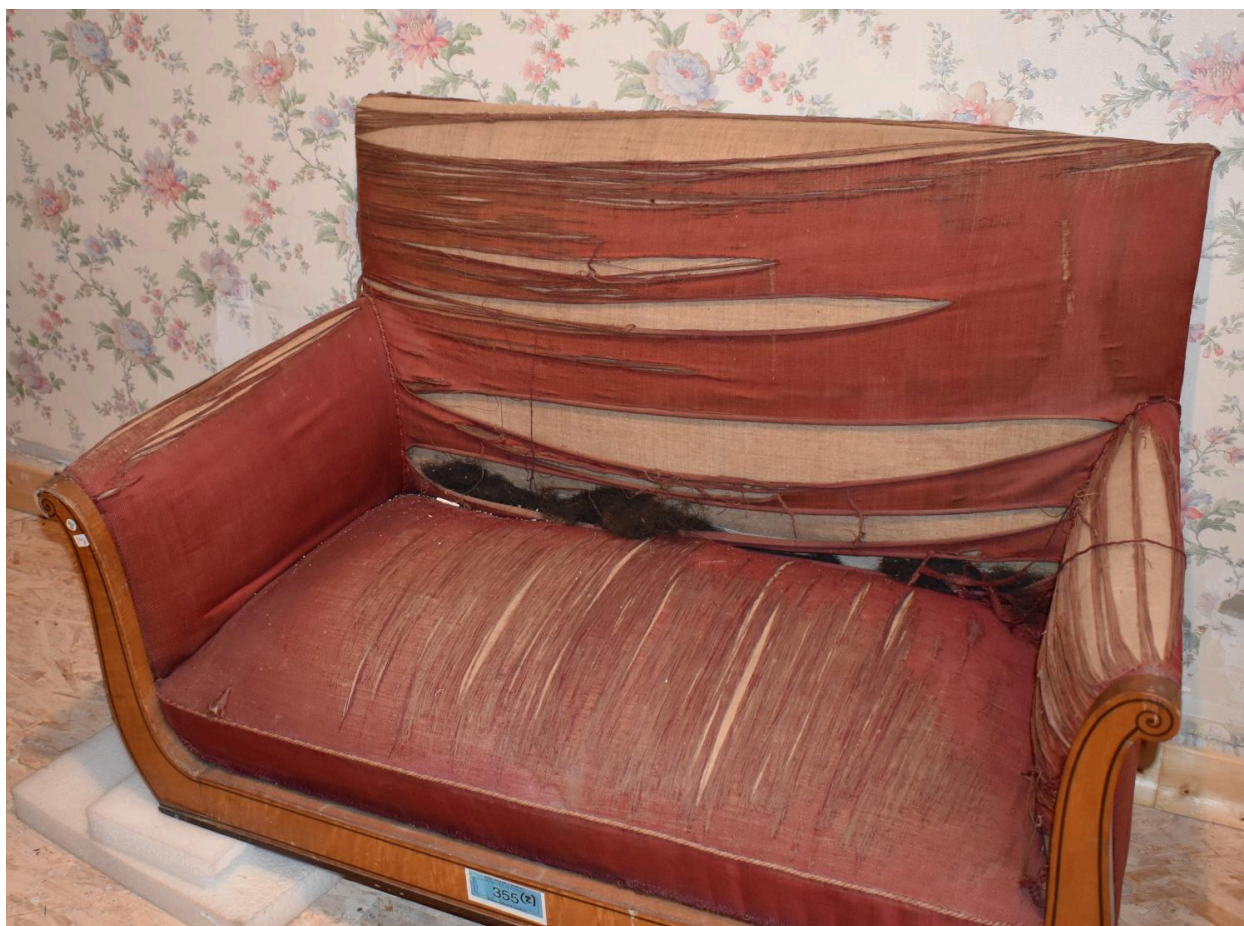
Vue générale du canapé n°1