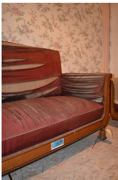
Vue générale du canapé n°1 IVR84_20216301497NUC4A