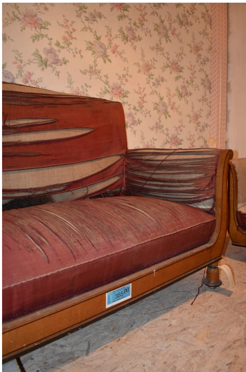
Vue générale du canapé n°1