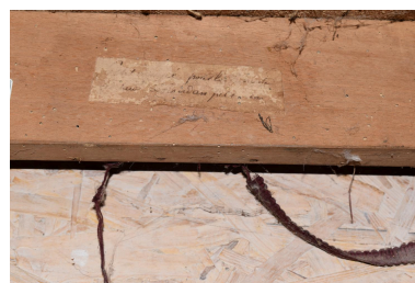
Etiquette du canapé n°1 IVR84_20216301566NUC4A