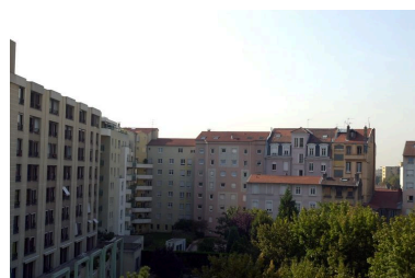
Elévation postérieure IVR82_20096901395NUCA