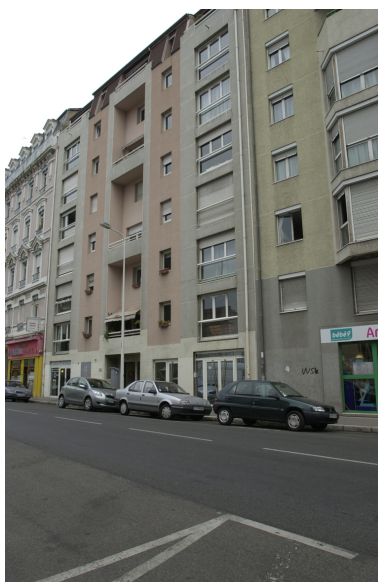
Elévation antérieure IVR82_20136900987NUCA