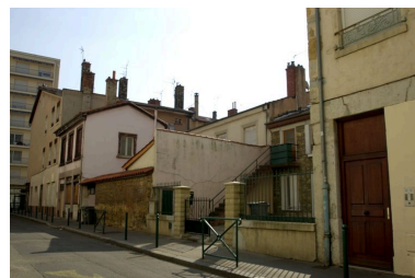
Vue d'ensemble depuis le sud-ouest IVR82_20096901106NUCA