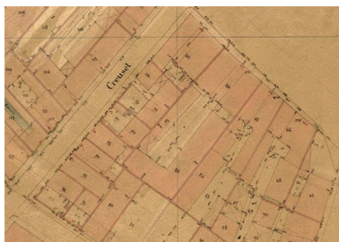
Plan de Lyon. 1886. 1:500. Extrait