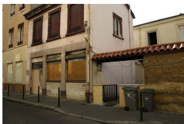
Vue générale IVR82_20096901107NUCA