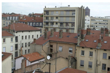
Vue de toiture IVR82_20096901134NUCA