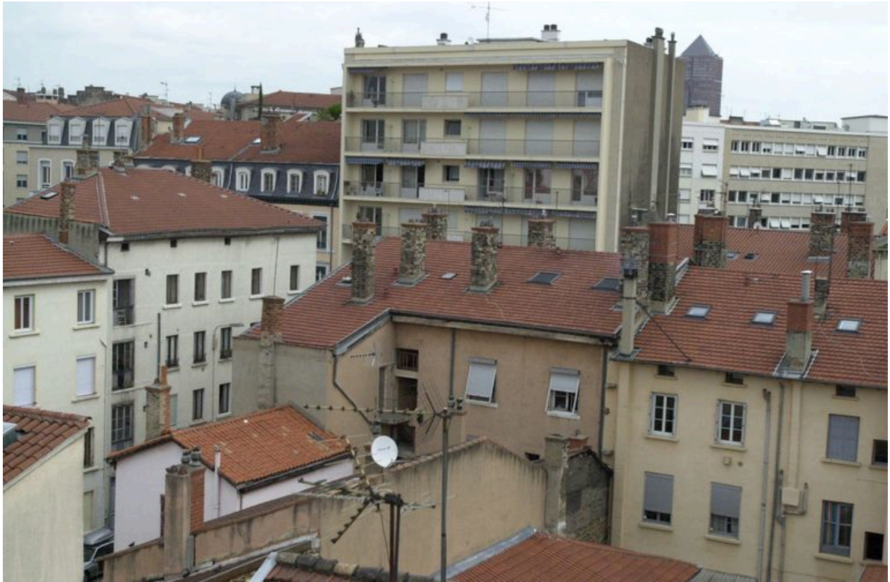
Vue de toiture