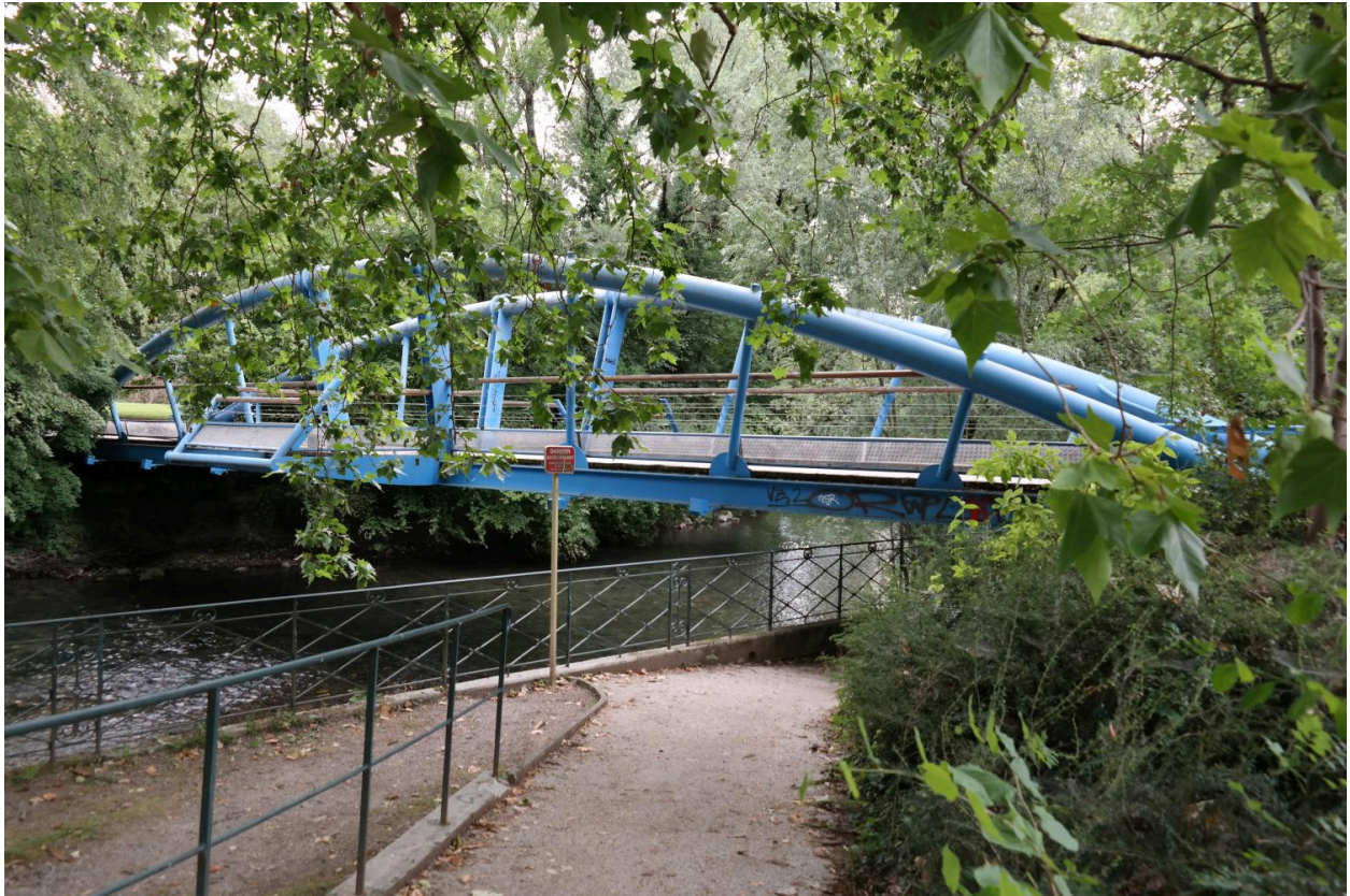
Passerelle piétonne sur le Thiou, vue de la face amont