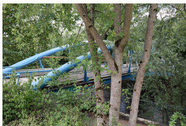
Passerelle piétonne sur le Thiou, vue de la face aval IVR84_20207403843NUCA