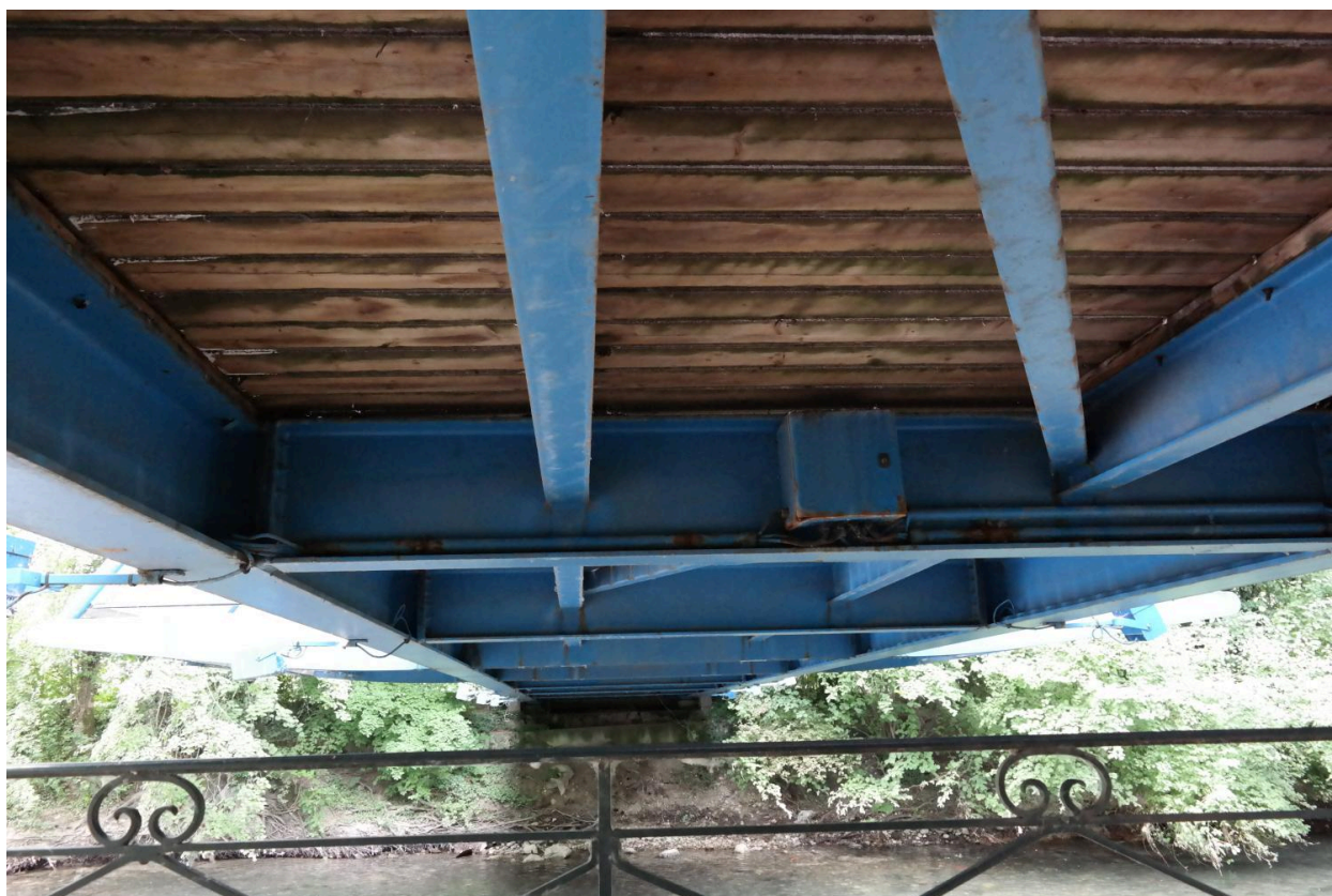
Passerelle piétonne sur le Thiou, vue de sous le tablier