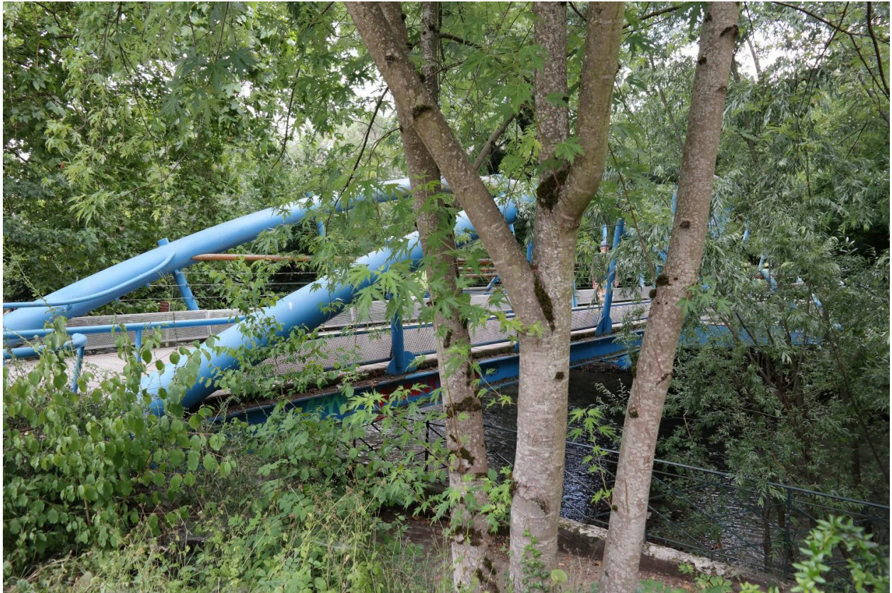
Passerelle piétonne sur le Thiou, vue de la face aval