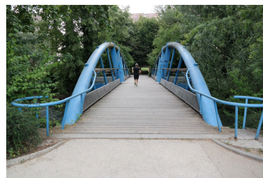
Passerelle piétonne sur le Thiou, vue de la chaussée IVR84_20207403844NUCA