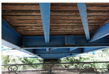
Passerelle piétonne sur le Thiou, vue de sous le tablier IVR84_20207403846NUCA