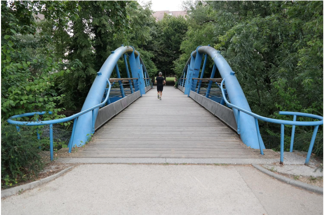
Passerelle piétonne sur le Thiou, vue de la chaussée