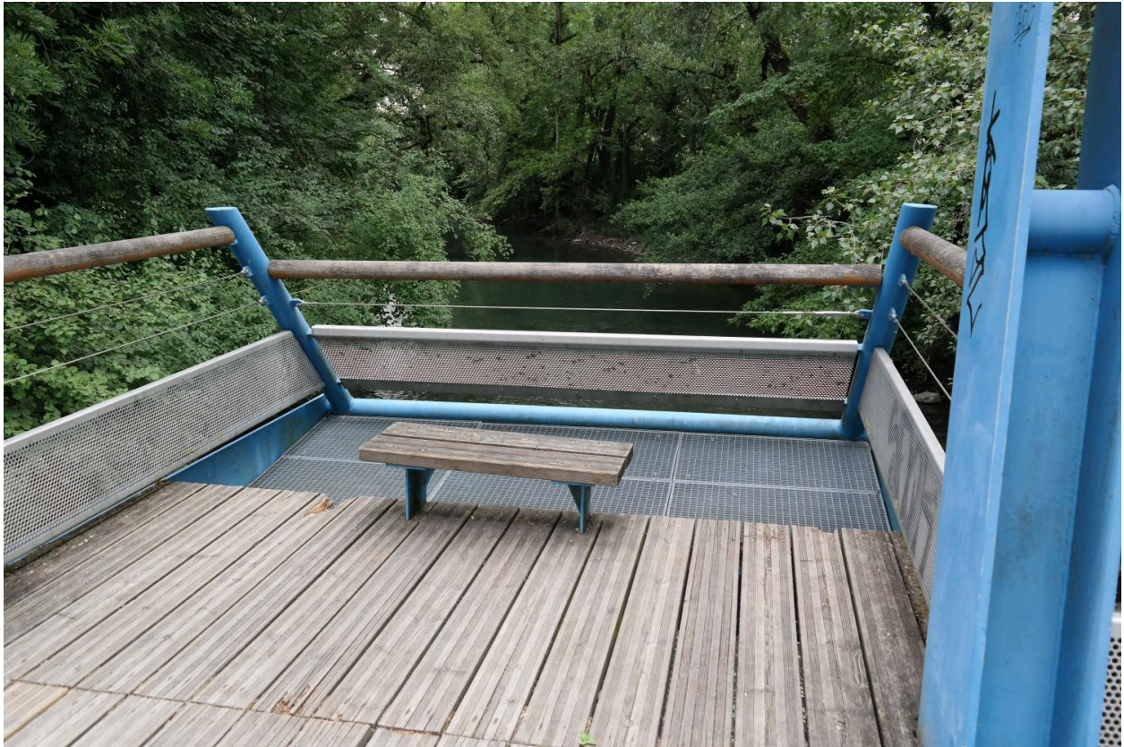
Passerelle piétonne sur le Thiou, détail d'un bévédère en porte-à-faux