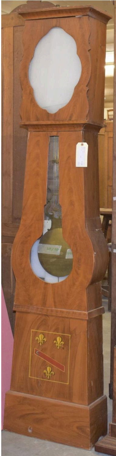
Vue générale IVR84_20226302561NUC4A