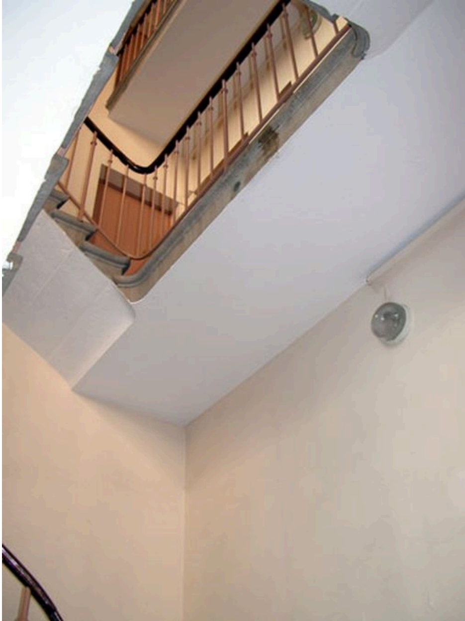
Vue de la cage d'escalier