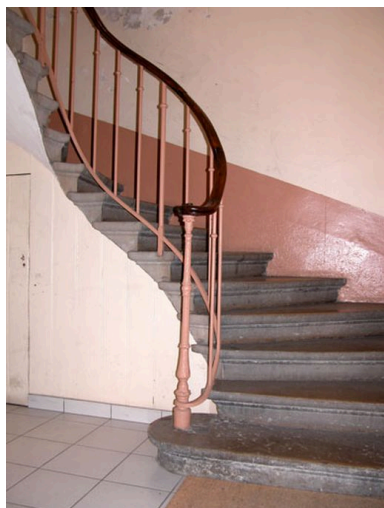
Départ de l'escalier IVR82_20046904640NUCA