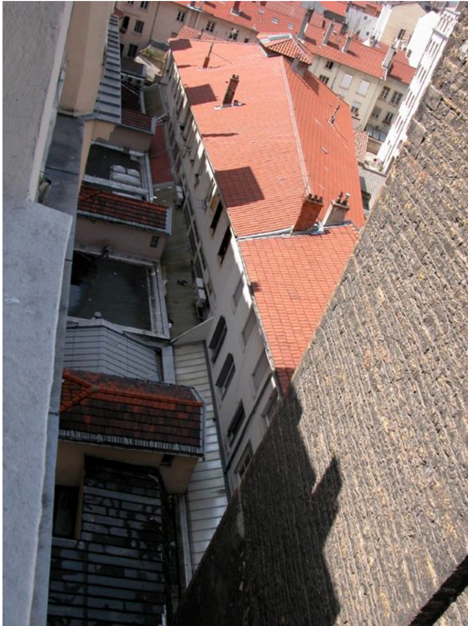
Elévation postérieure depuis le 4 avenue Jean-Jaurès