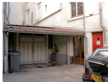
Vue du garage construit contre le mur de la cour au nord