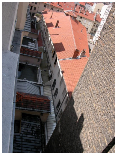
Elévation postérieure depuis le 4 avenue Jean-Jaurès IVR82_20046904537NUCA