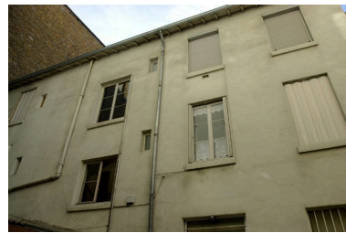
Détail de l'élévation principale IVR82_20046904689NUCA