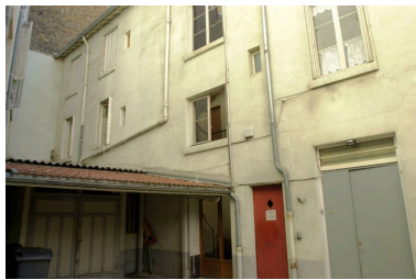
Elévation principale sur cour IVR82_20046904688NUCA