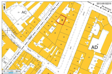
Plan masse et de situation, extrait de http://cadastre.gouv.fr IVR82_20136902210NUDA