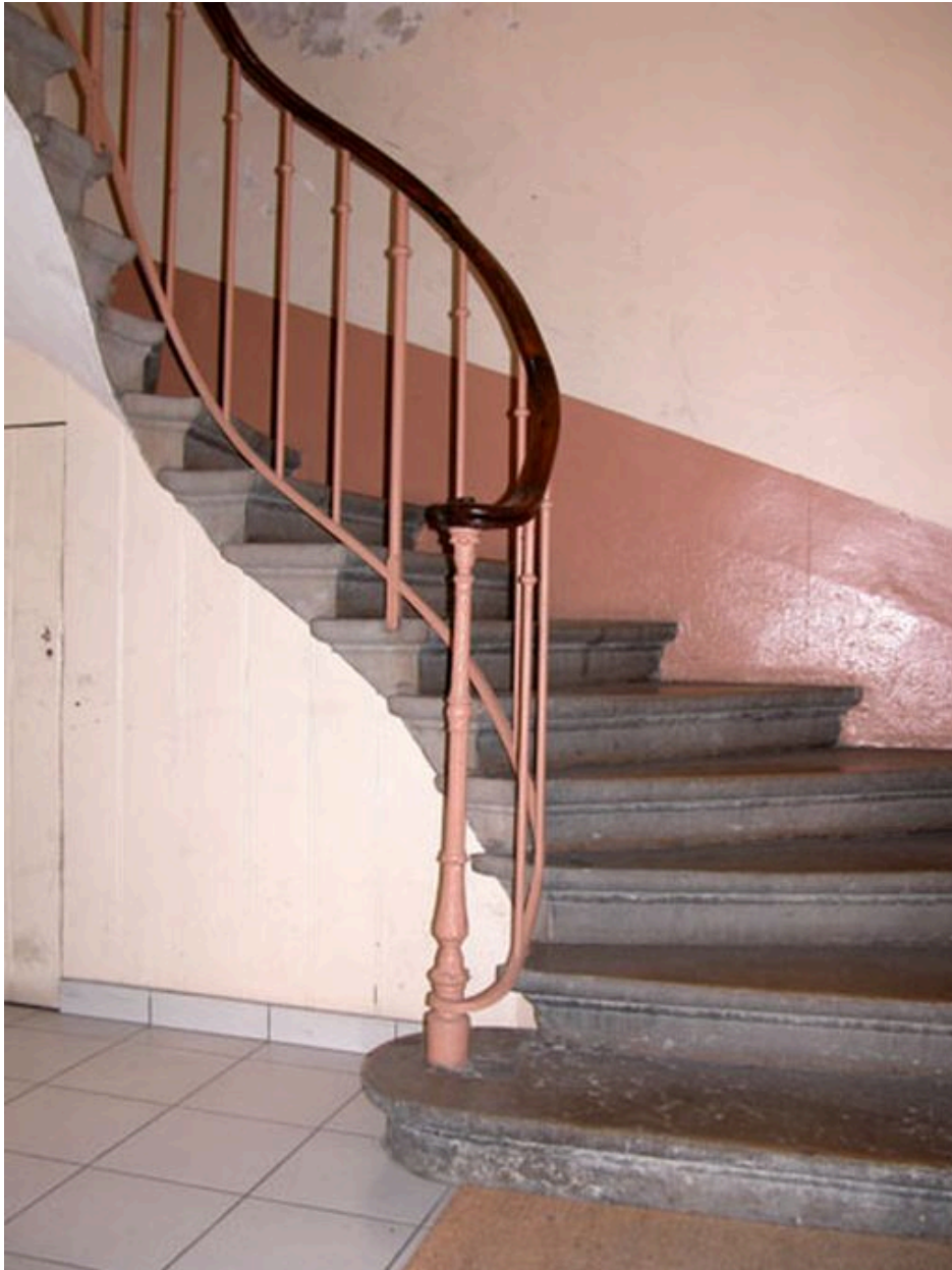
Départ de l'escalier