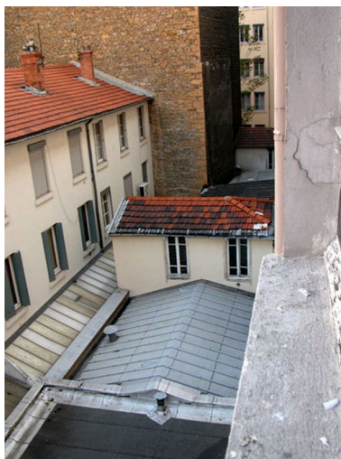
Elévation postérieure depuis le 8 avenue Jean-Jaurès