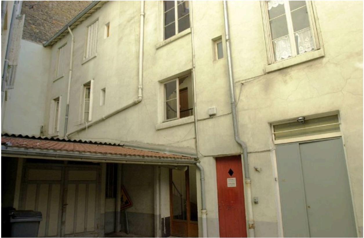
Elévation principale sur cour