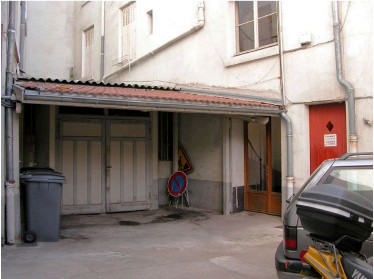
Vue du garage construit contre le mur de la cour au nord