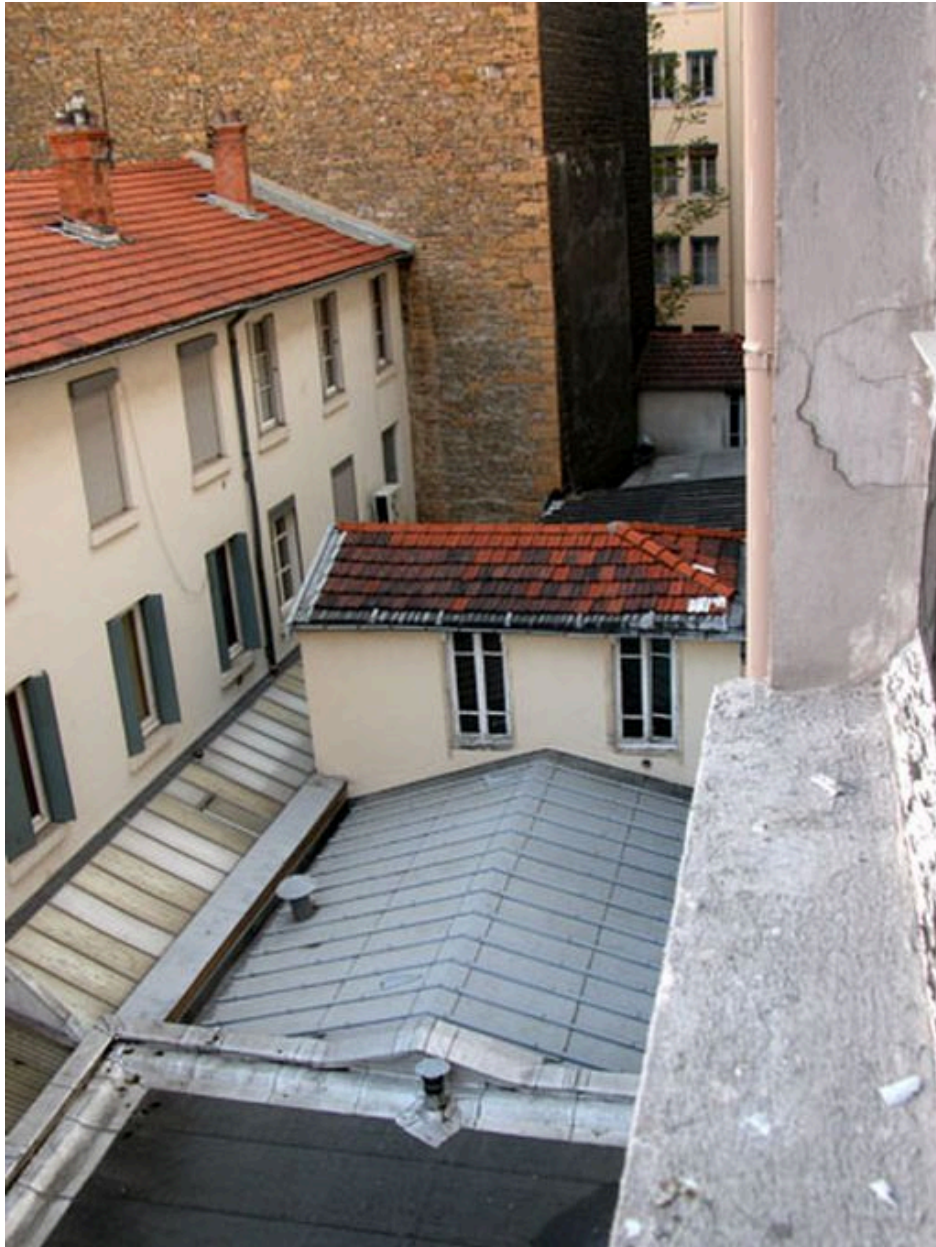
Elévation postérieure depuis le 8 avenue Jean-Jaurès