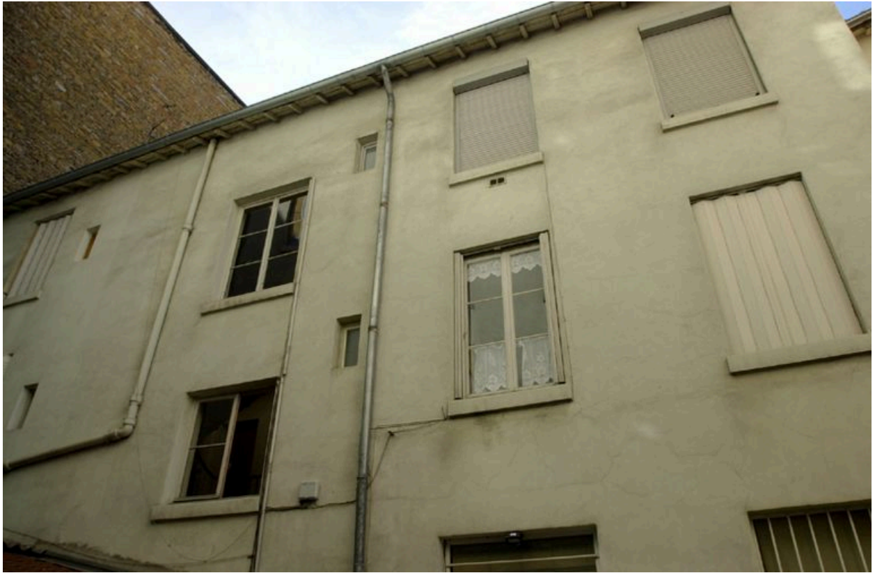
Détail de l'élévation principale