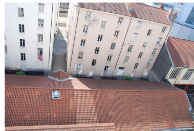
Vue en surplomb.