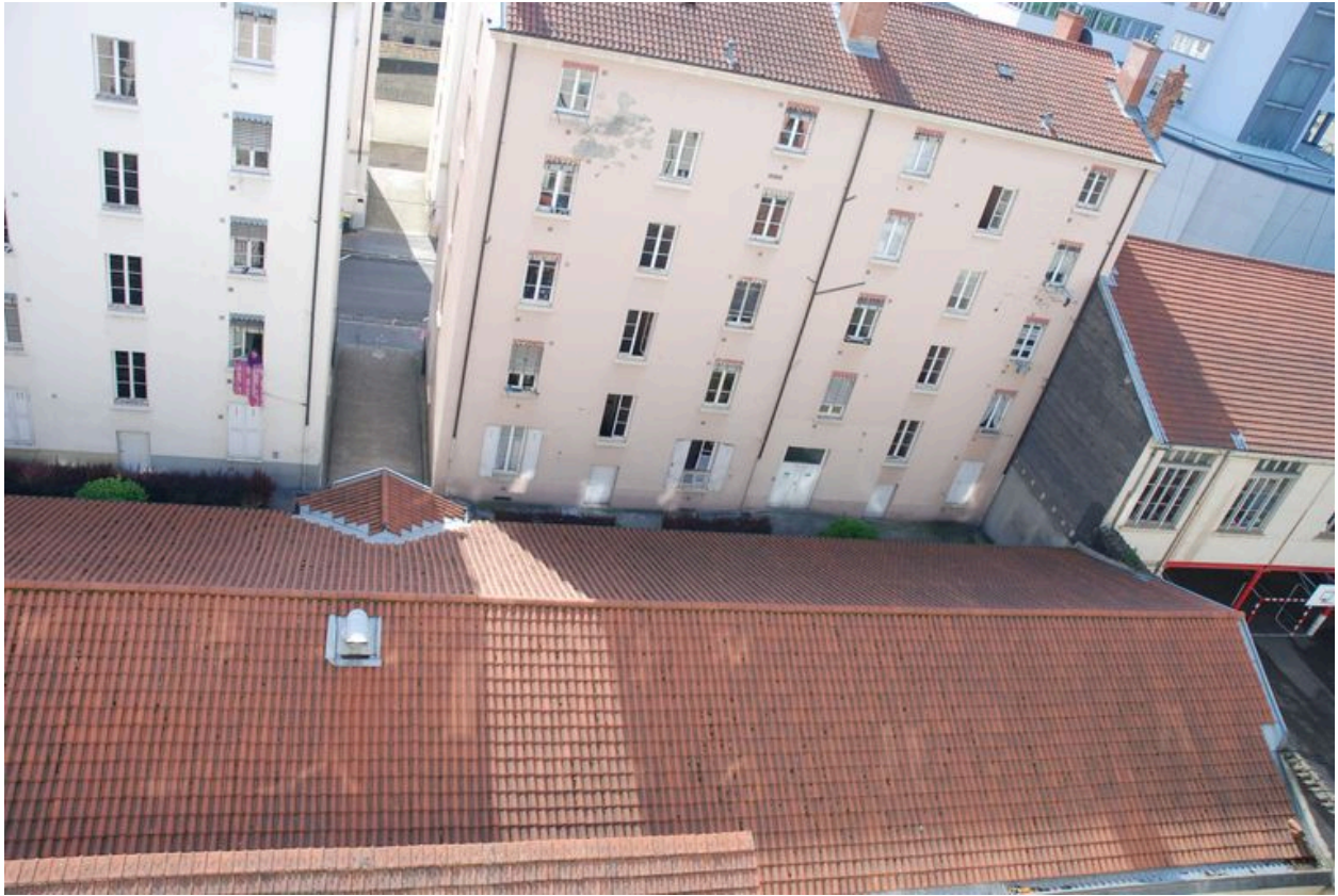
Vue en surplomb.