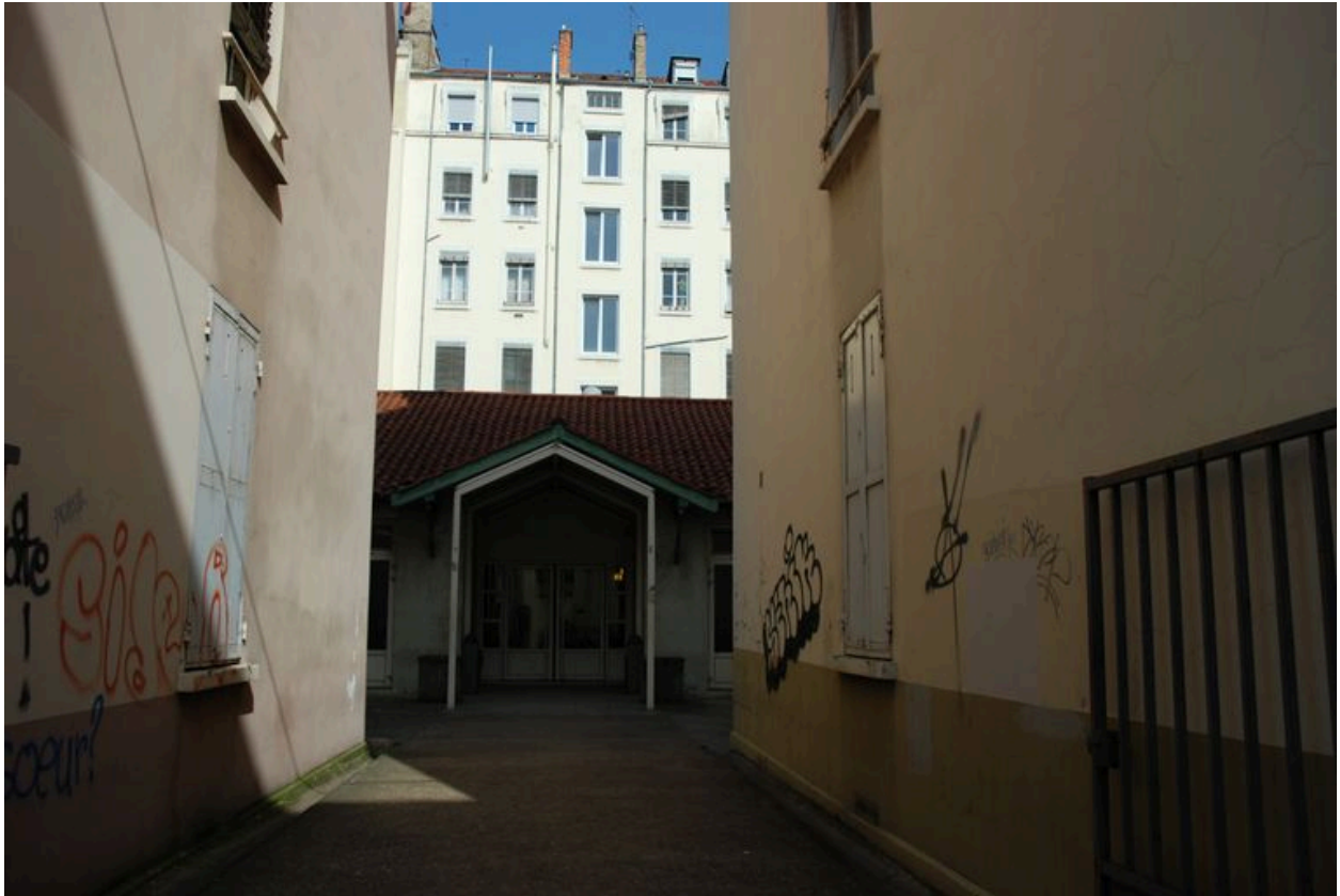
Détail de l'entrée, entre les 58 et 62 rue Pasteur.