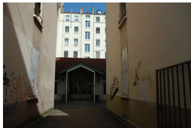
Détail de l'entrée, entre les 58 et 62 rue Pasteur.