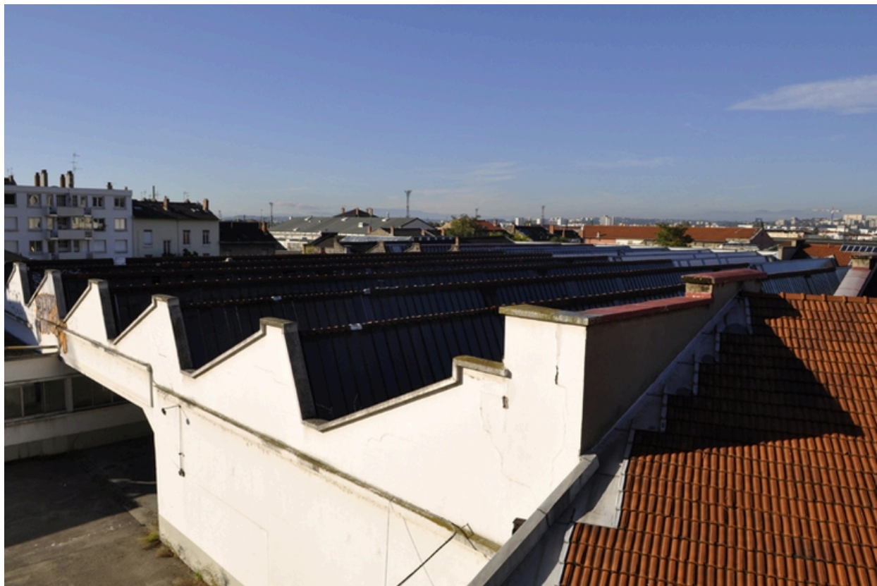
Vue des sheds