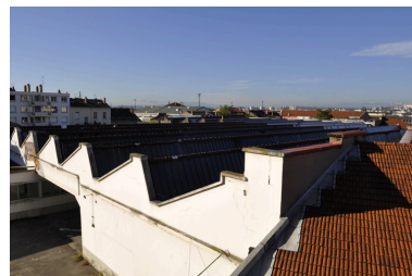
Vue des sheds IVR82_20106900507NUCA