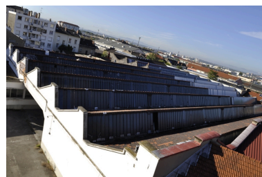
Détail shed