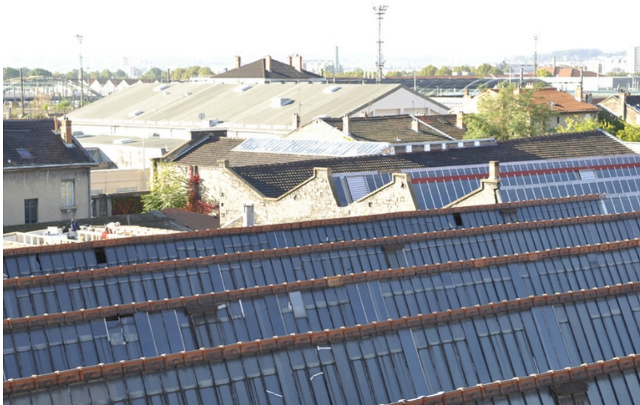
Vue d'ensemble des toitures