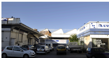
Vue générale est, route de Vienne IVR82_20106900502NUCA