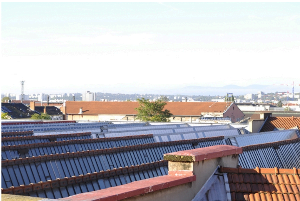
Vue générale des toitures