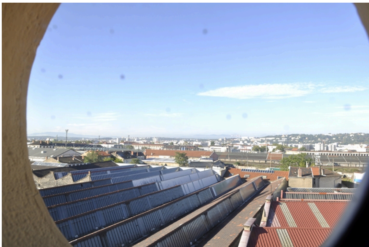
Vue d'ensemble des toitures