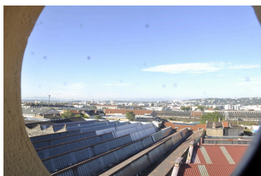
Vue d'ensemble des toitures