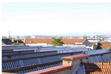
Vue générale des toitures IVR82_20106900508NUCA