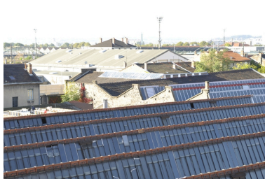
Vue d'ensemble des toitures IVR82_20106900514NUCA