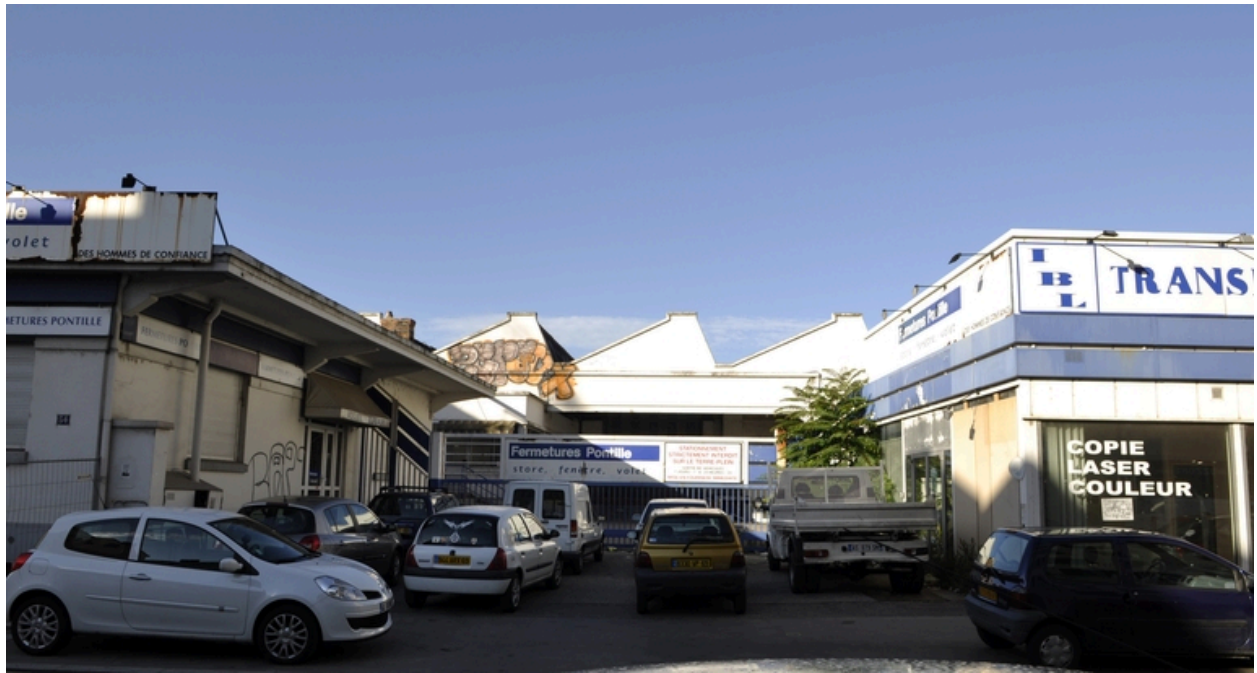
Vue générale est, route de Vienne