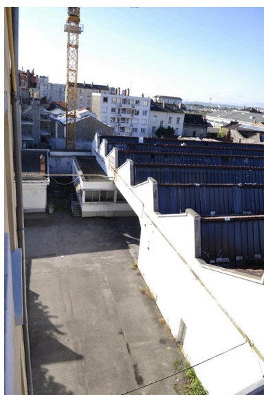
Vue nord