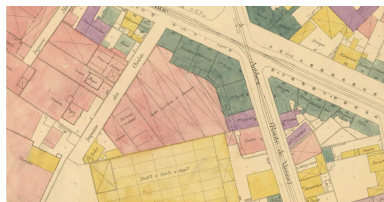
Plan général de Lyon (ACL 1940 : 4S282) usine Pontille IVR84_20256901454NUCA