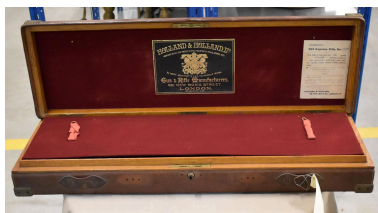
Vue générale IVR84_20226303108NUC4A