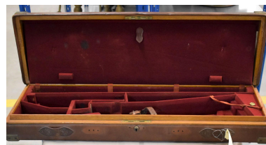
Vue générale IVR84_20226303109NUC4A