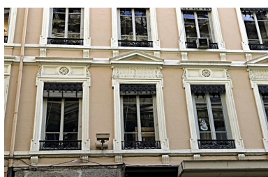
Façade principale, détail du 1er étage