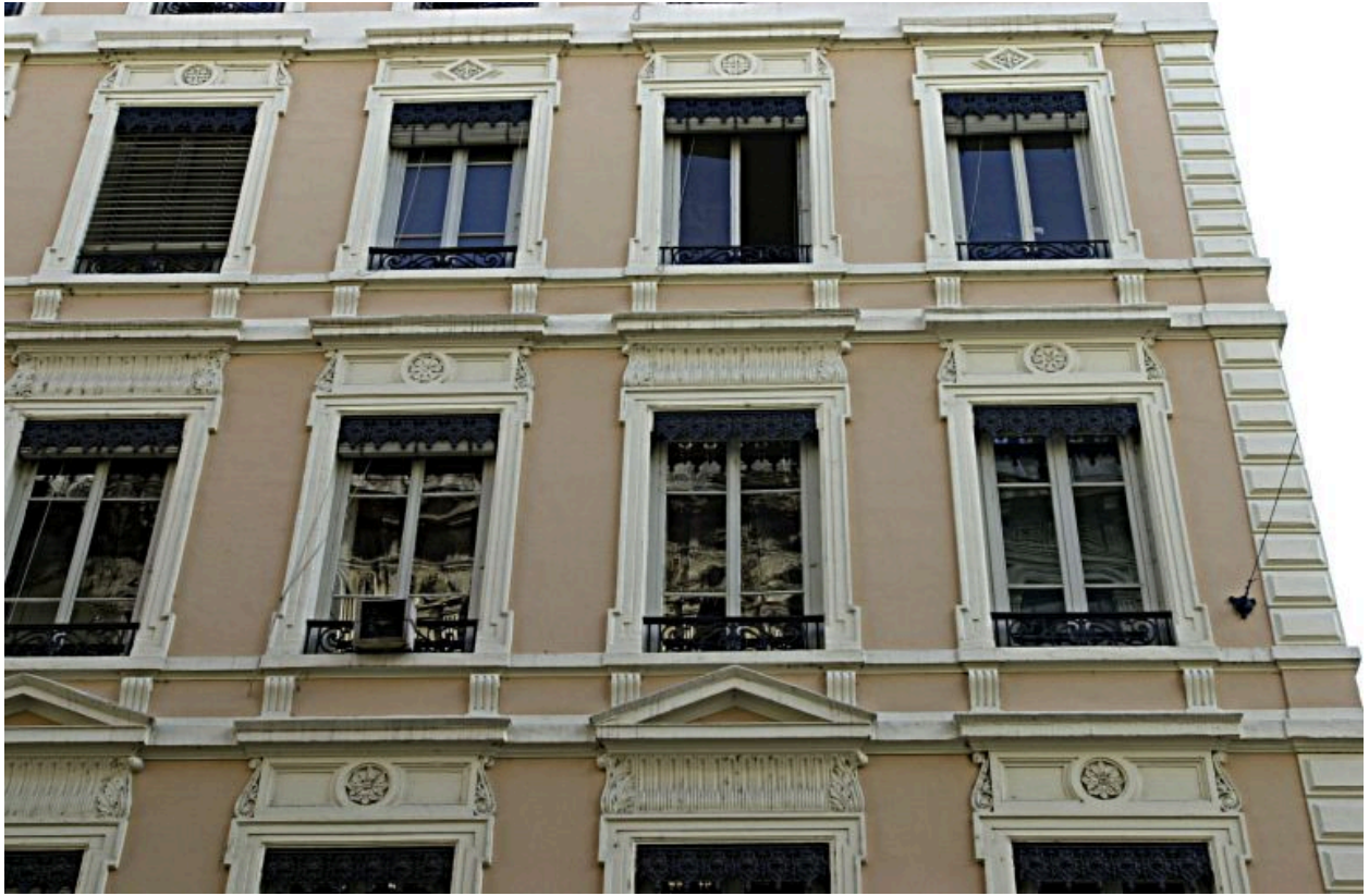
Façade principale, détail du 2e étage