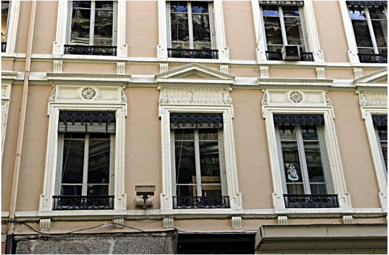
Façade principale, détail du 1er étage