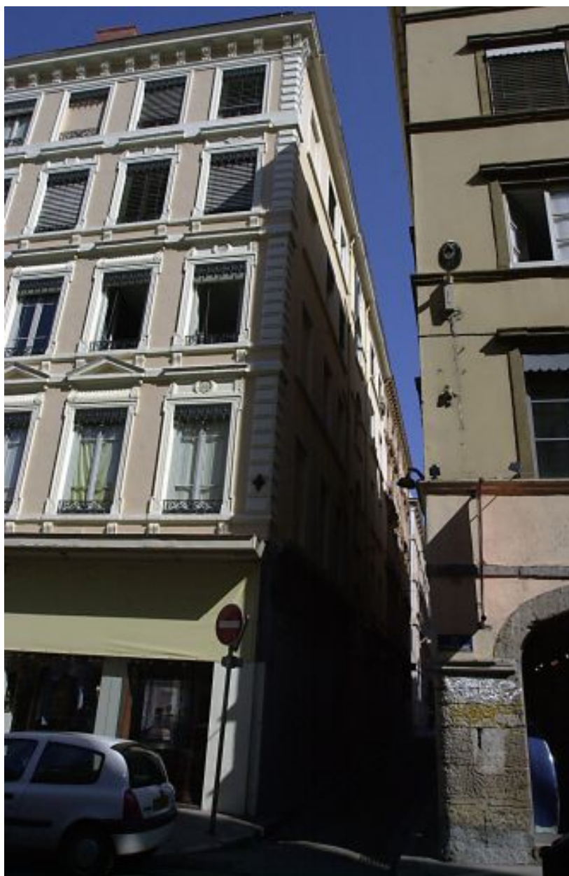
Angle entre les rues Fromagerie et Pléney