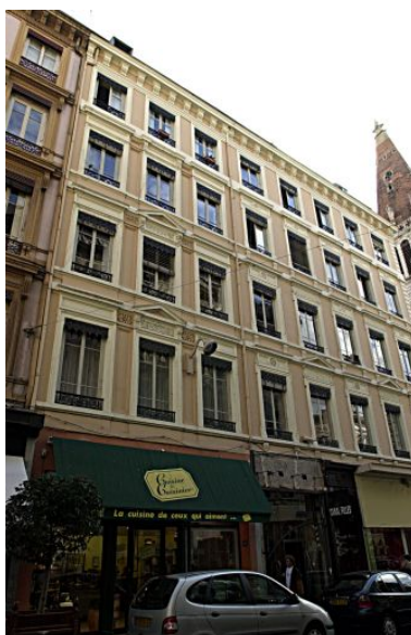
Façade principale sur la rue Paul-Chenavard IVR82_20046900131NUCA