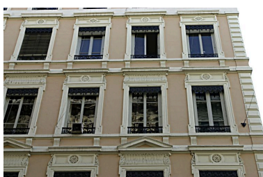
Façade principale, détail du 2e étage