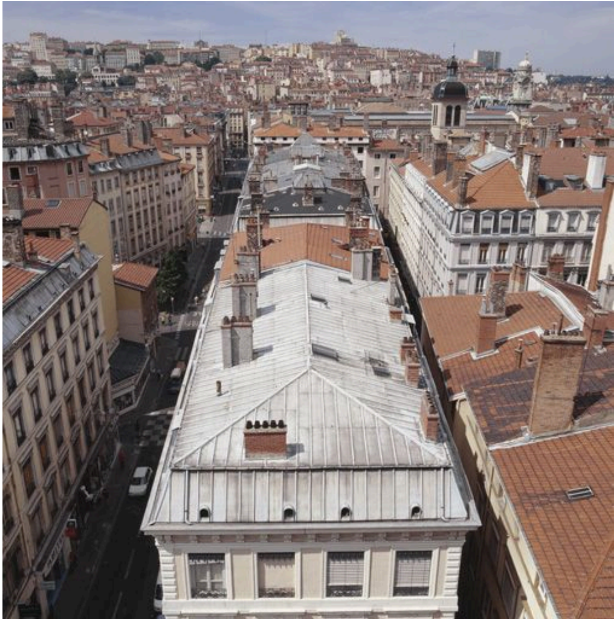
Vue générale du toit