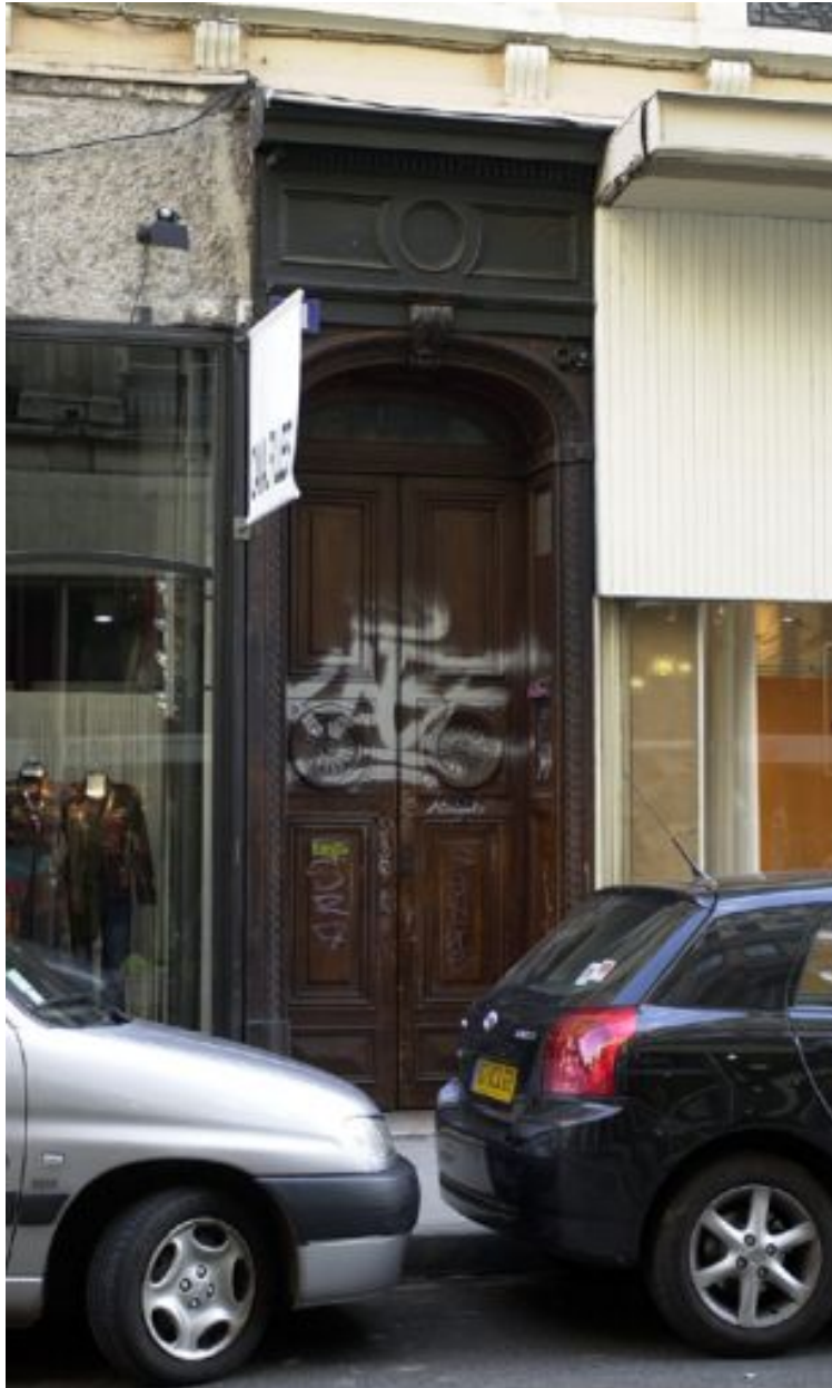
Façade principale, porte