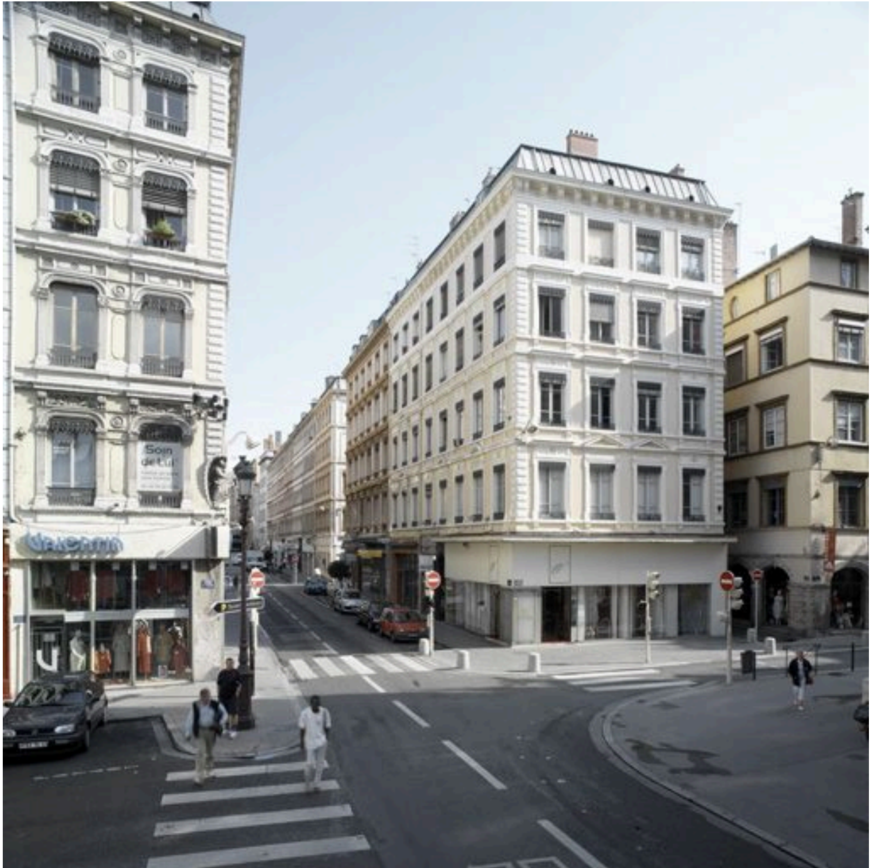
Vue générale des façades sur les rue Fromagerie et Paul-Chenavard