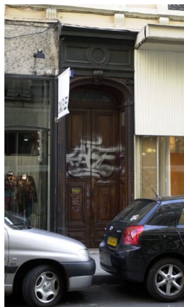
Façade principale, porte