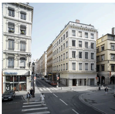
Vue générale des façades sur la rue Fromagerie et Paul-Chenavard