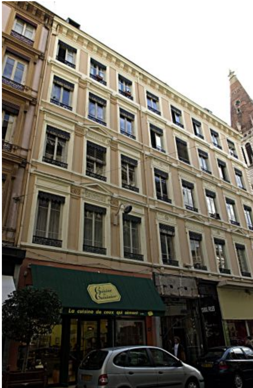
Façade principale sur la rue Paul-Chenavard