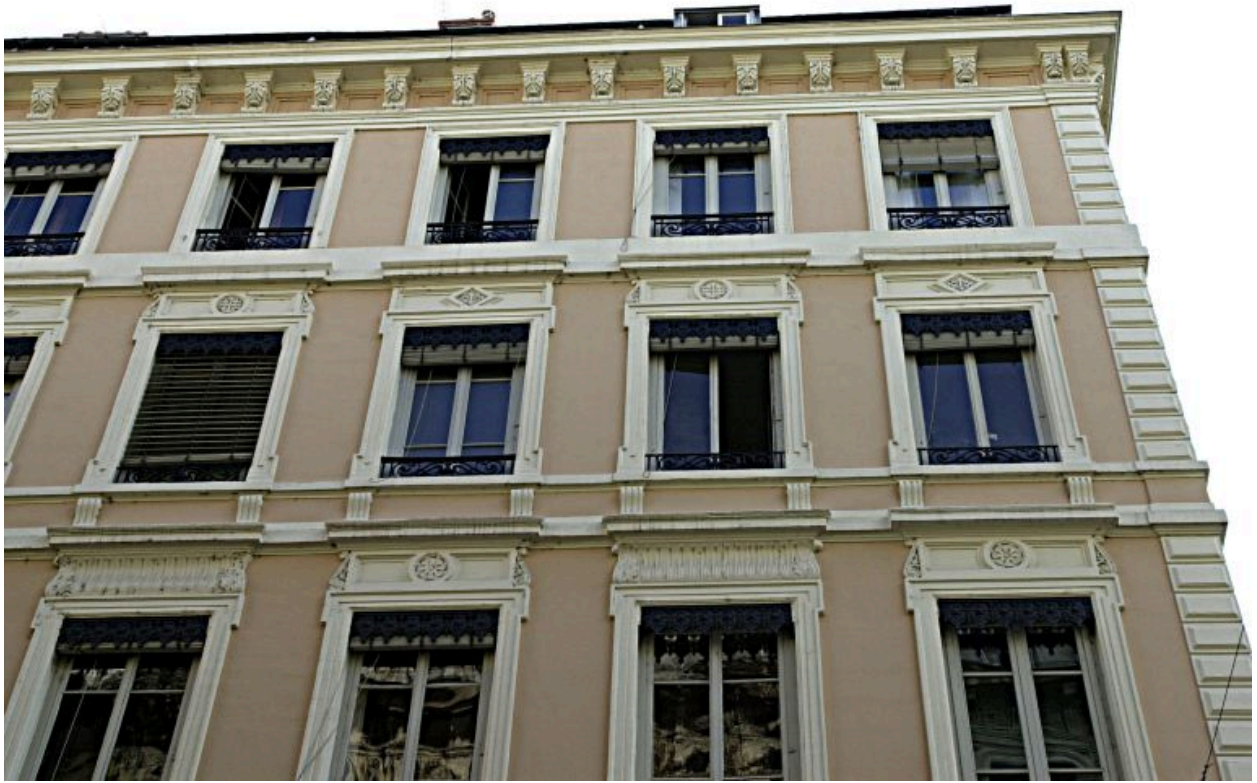
Façade principale, détail des 3e et 4e étages