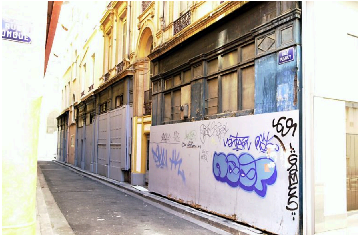
Alignement des boutiques rue Pléney des immeubles 39 (au 1er plan) et 41, rue Paul-Chenavard