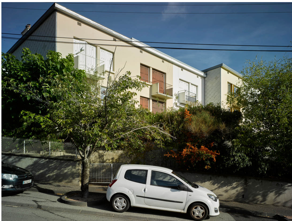
Habitations en bande (années 1959-1960), rue de Trémonteix.