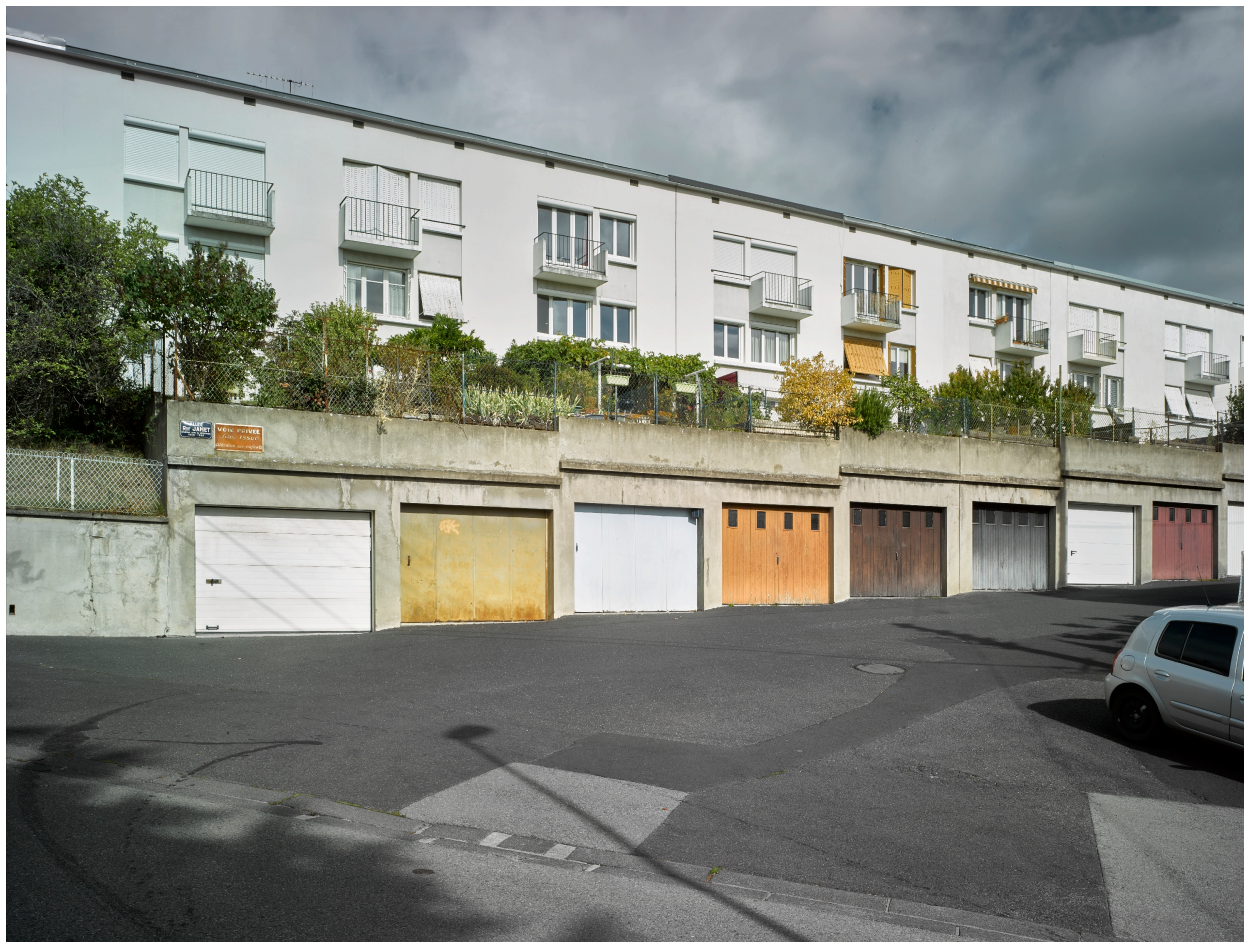
Habitations en bande, avec jardins sur garages semi-enterrés, allée Rémy-Jamet.