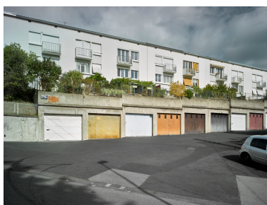
Habitations en bande, avec jardins sur garages semi- enterrés, allée Rémy-Jamet. IVR84_20196300353NUC4A