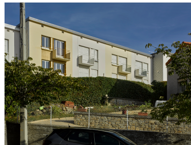
Habitations en bande (années 1959-1960), rue de Trémonteix. IVR84_20196300351NUC4A