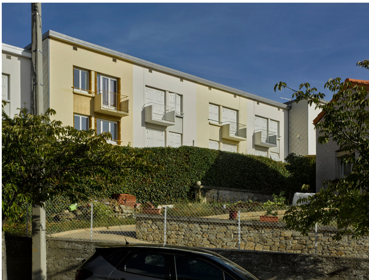
Habitations en bande (années 1959-1960), rue de Trémonteix.