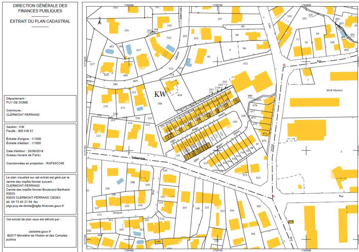
Extrait de plan cadastral (section KW).