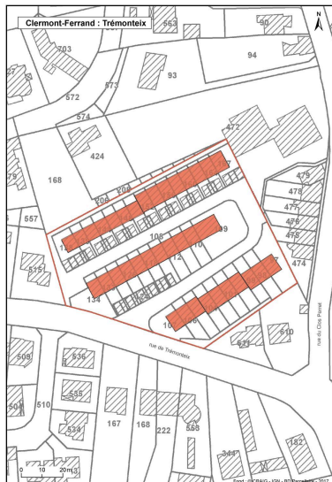
Plan des différents bâtiments d'origine de la cité. IVR84_20216301281NUDA