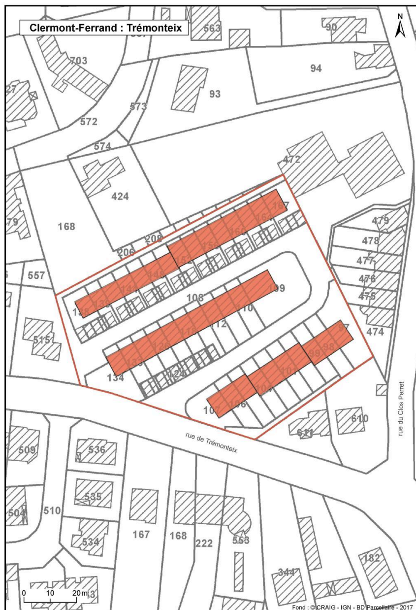
Plan des différents bâtiments d'origine de la cité.