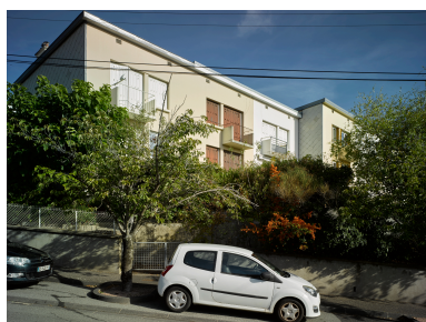
Habitations en bande (années 1959-1960), rue de Trémonteix. IVR84_20196300352NUC4A