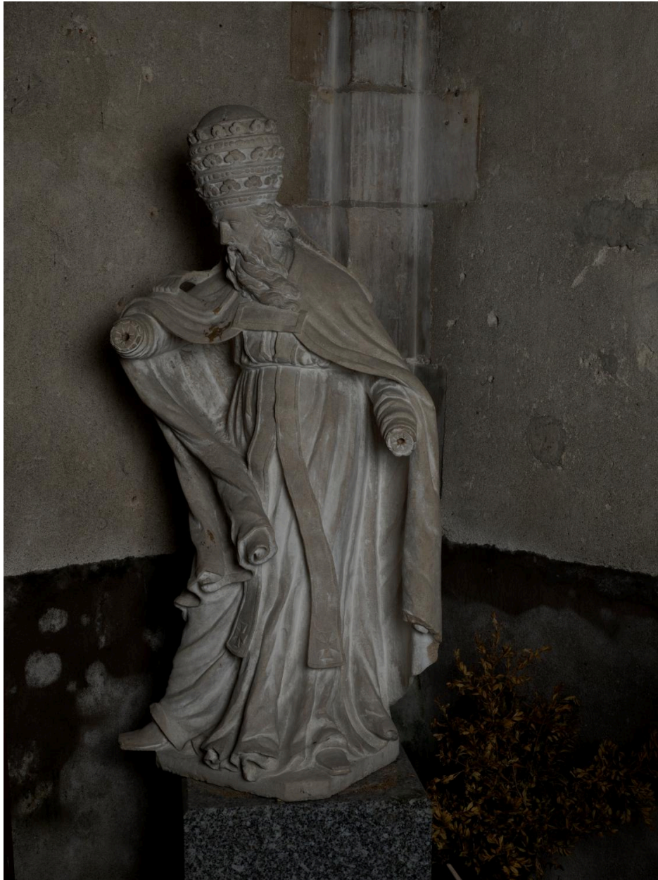
Vue générale de trois quarts