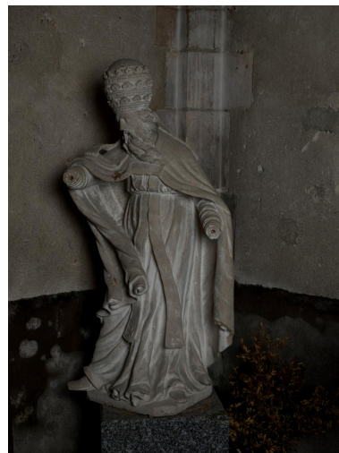
Vue générale de trois quarts