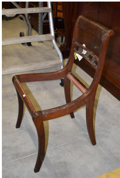
Vue générale IVR84_20226301047NUC4A