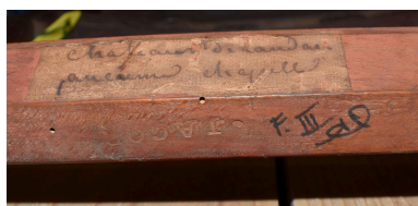
Vue d'une étiquette et de l'estampille IVR84_20226301051NUC4A