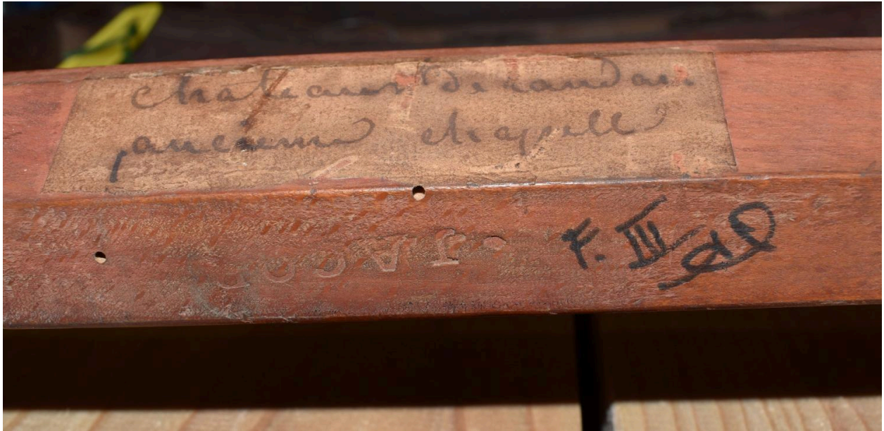
Vue d'une étiquette et de l'estampille