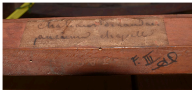
Vue de l'étiquette et de l'estampille IVR84_20226301049NUC4A