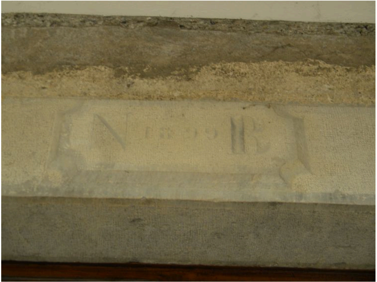
Détail du cartouche gravé N1899B.