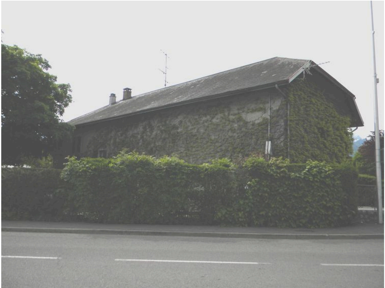
Vue de la façade nord depuis la route.