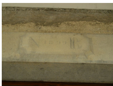
Détail du cartouche gravé N1899B.