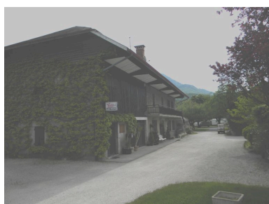
Vue générale de la façade principale.