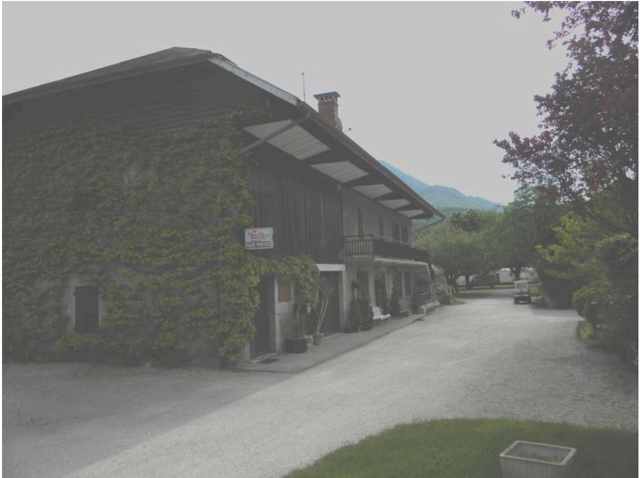
Vue générale de la façade principale.