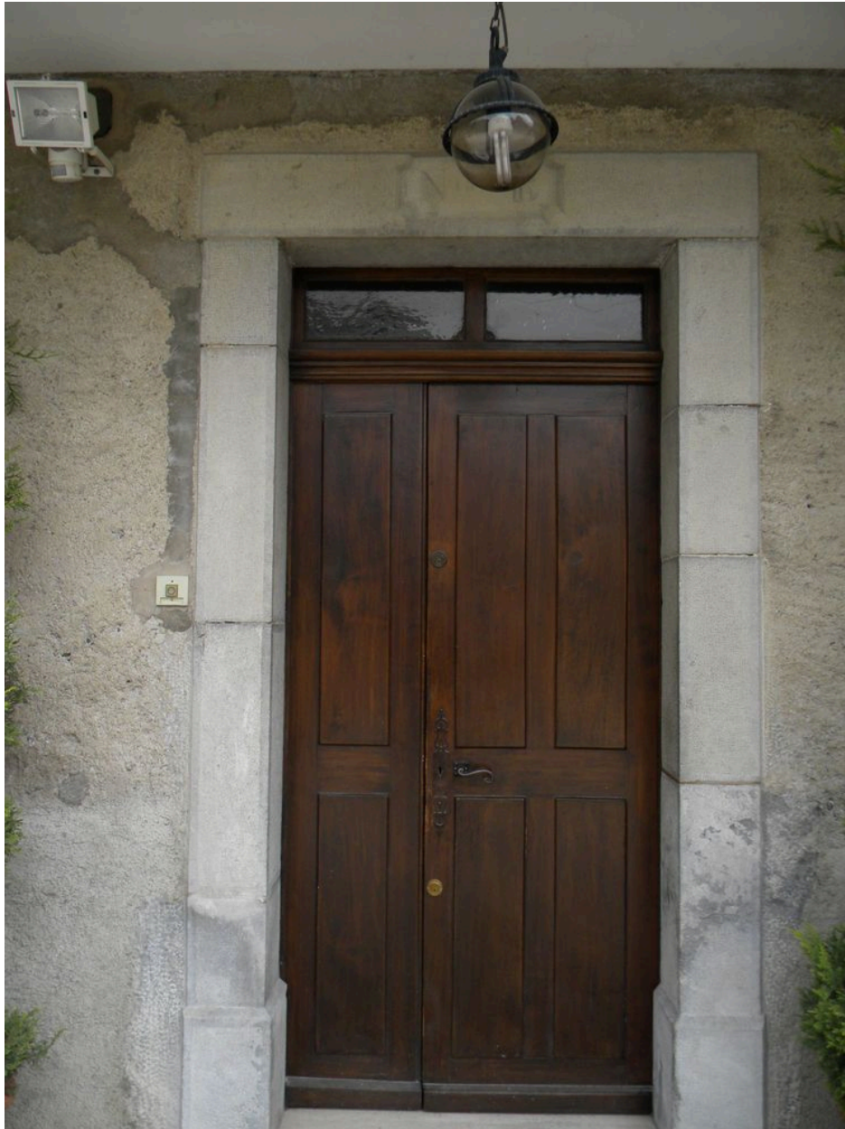
Vue de la porte d'entrée principale avec son cartouche gravé.