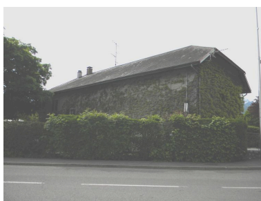
Vue de la façade nord depuis la route. IVR82_20117400739NUCA