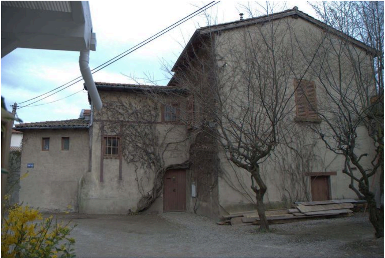
Vue de la maison située à l'ouest de la parcelle, depuis l'ouest