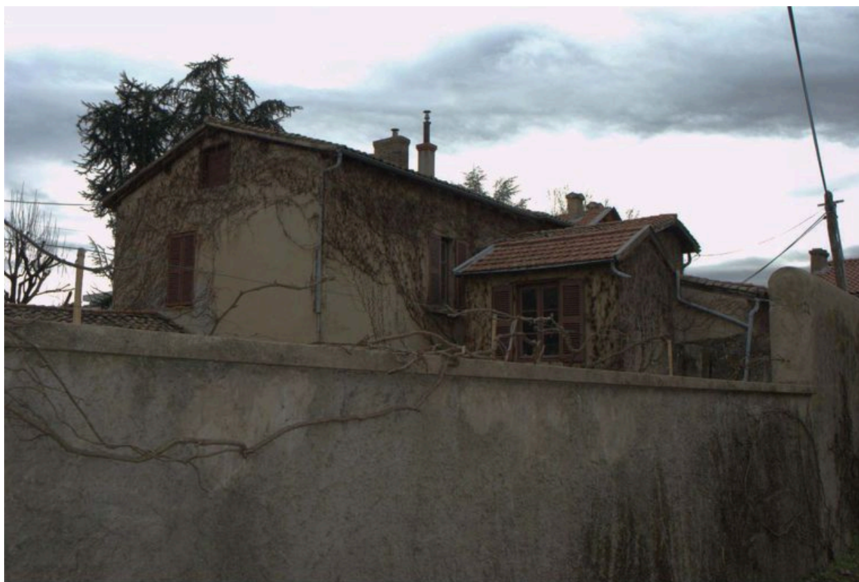
Vue de la maison à l'ouest de la parcelle, depuis le nord-est