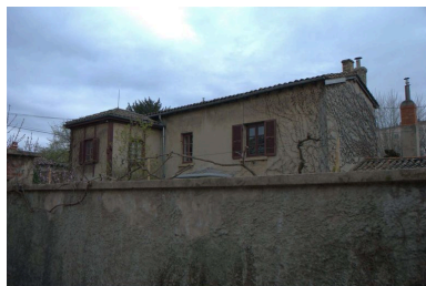
Vue de la maison située à l'est de la parcelle