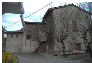
Vue de la maison située à l'ouest de la parcelle, depuis l'ouest