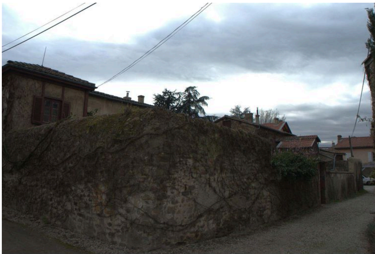
Vue de l'ensemble des maisons depuis l'est