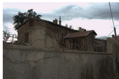
Vue de la maison à l'ouest de la parcelle, depuis le nord-est