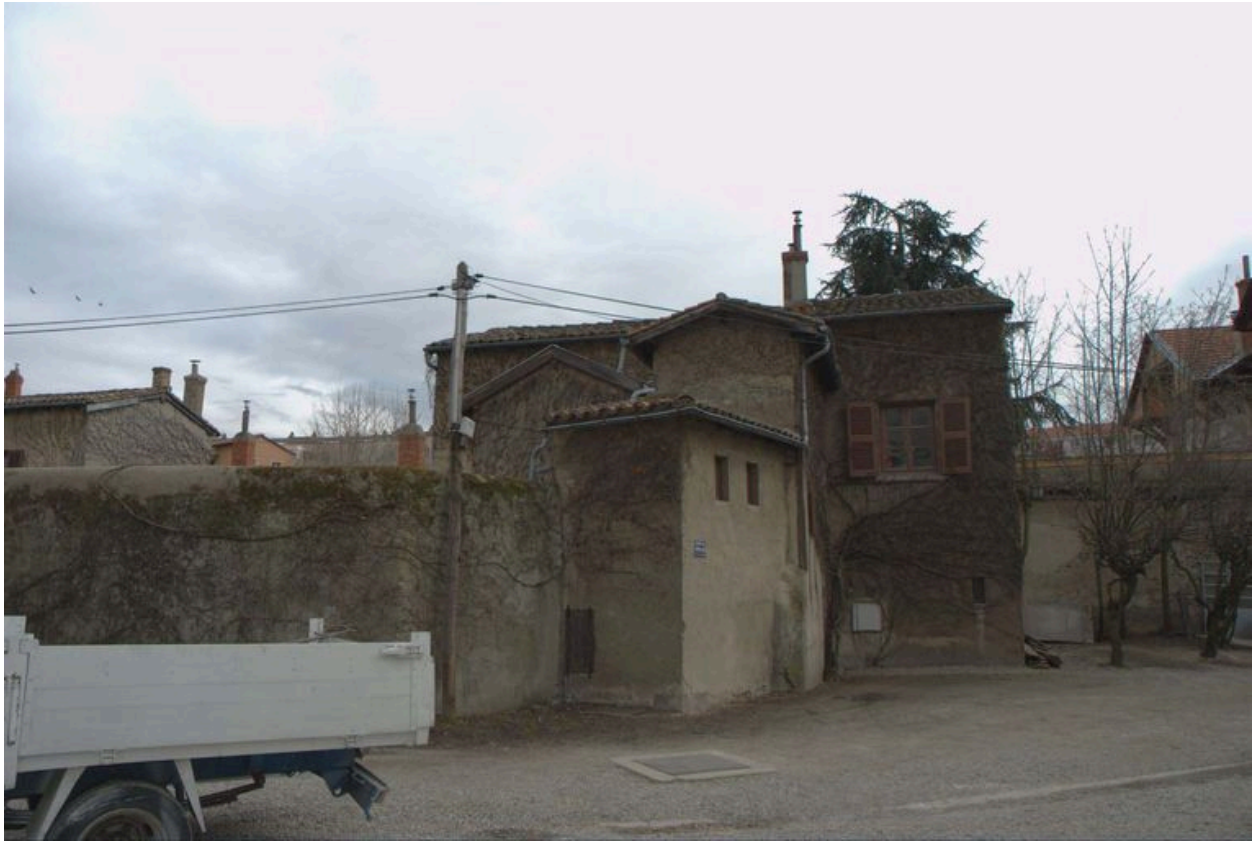
Vue de la maison située à l'ouest de la parcelle, depuis le nord