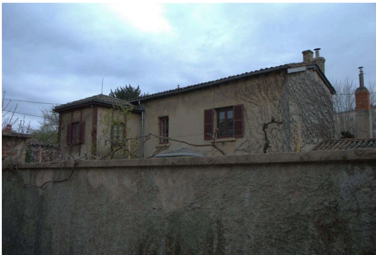
Vue de la maison située à l'est de la parcelle