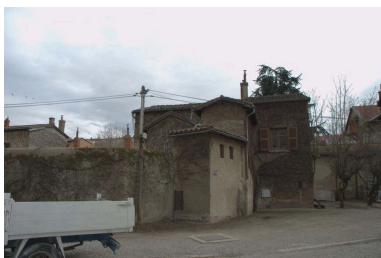
Vue de la maison située à l'ouest de la parcelle, depuis le nord