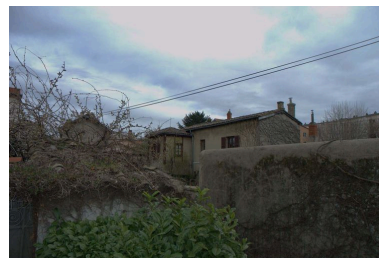
Vue de la maison située à l'est de la parcelle, depuis le nord-ouest