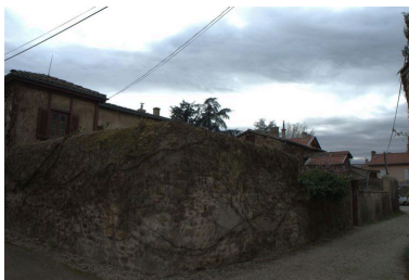
Vue de l'ensemble des maisons depuis l'est