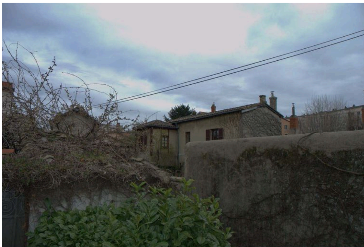
Vue de la maison située à l'est de la parcelle, depuis le nord-ouest