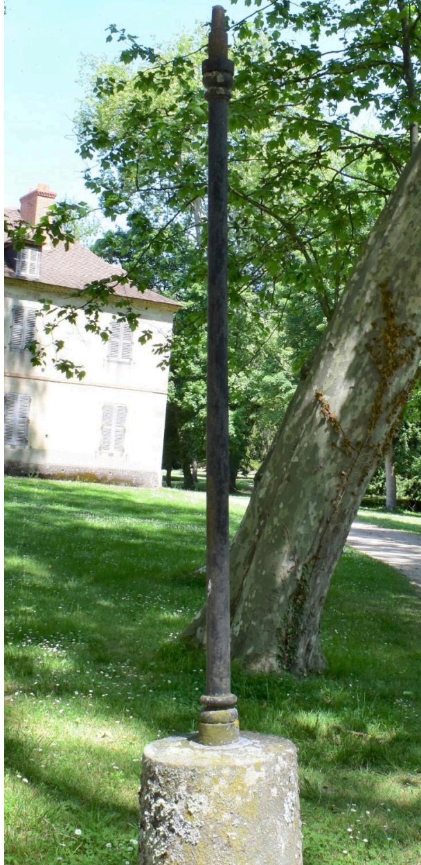
Vue générale d'un candélabre