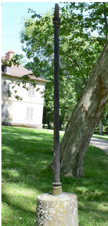
Vue générale d'un candélabre IVR84_20226300796NUCA