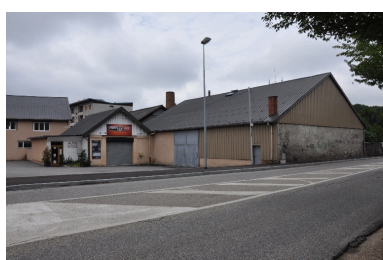
Vue générale du site IVR82_20127301838NUCA