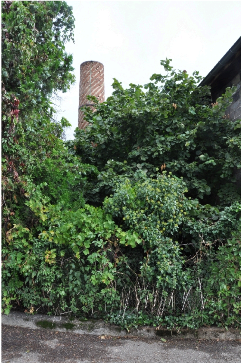
Vue de la cheminée présente sur le site