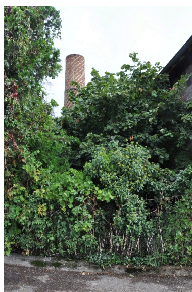
Vue de la cheminée présente sur le site IVR82_20127301839NUCA