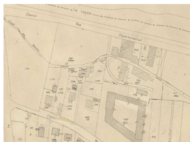
Cadastre rénové, 1988