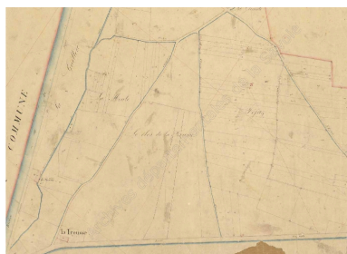
Premier cadastre français, 1862 IVR82_20127301835NUCA