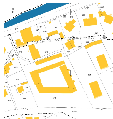
Cadastre actuel, 2007